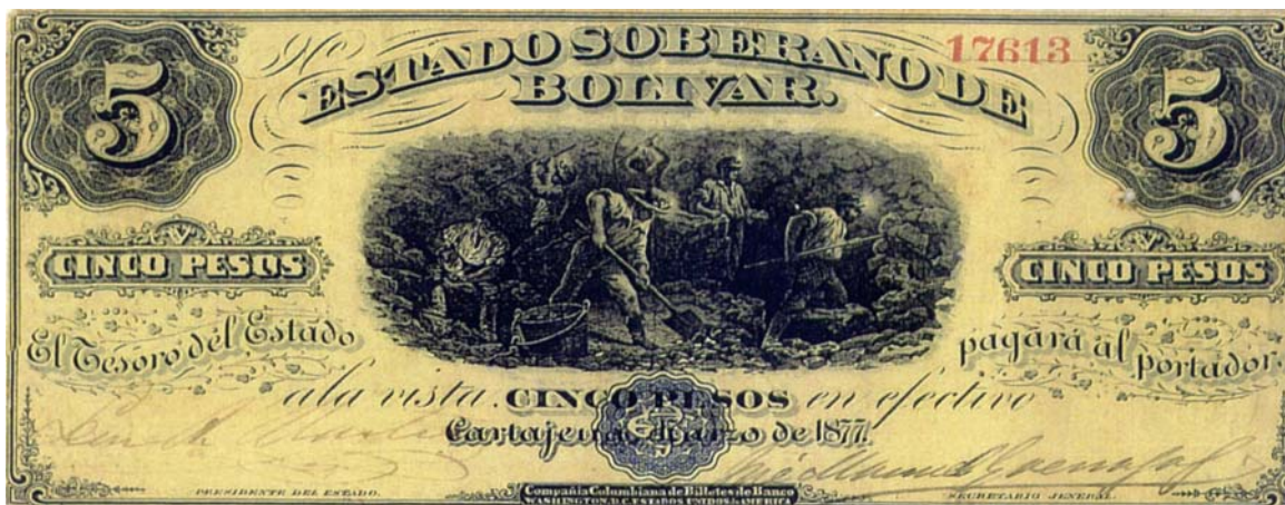
Estado Soberano de Bolívar, 5 pesos, 1877