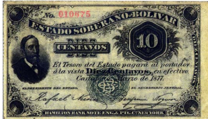
Estado Soberano de Bolívar, 10 centavos, 1877