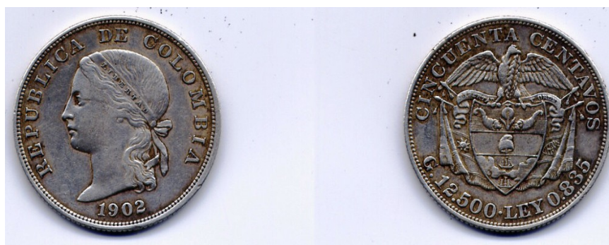
Cincuenta centavos, República de Colombia, 1902 (Anverso y reverso)

La ganadora es una moneda de 30 mm. de diámetro, con un peso de 12.5 gr., acuñada en plata Ley 0.835. Según algunos textos, fue acuñada en el exterior, por Decreto Legislativo del 28 de febrero de 1900 pero se desconoce si fue en Filadelfia o en Inglaterra. Se calcula una cantidad de 400.000 piezas. Tiene el canto estriado. En su anverso se encuentra la alegoría a la libertad, rodeada en su parte superior por la leyenda: "República de Colombia"; y en su parte inferior la fecha: 1902. Su reverso nos muestra al escudo nacional en la parte central, rodeado en la parte superior por la leyenda: "cincuenta centavos", y en su parte inferior, los datos sobre el peso y la ley: "G. 12.500. Ley 0,835".