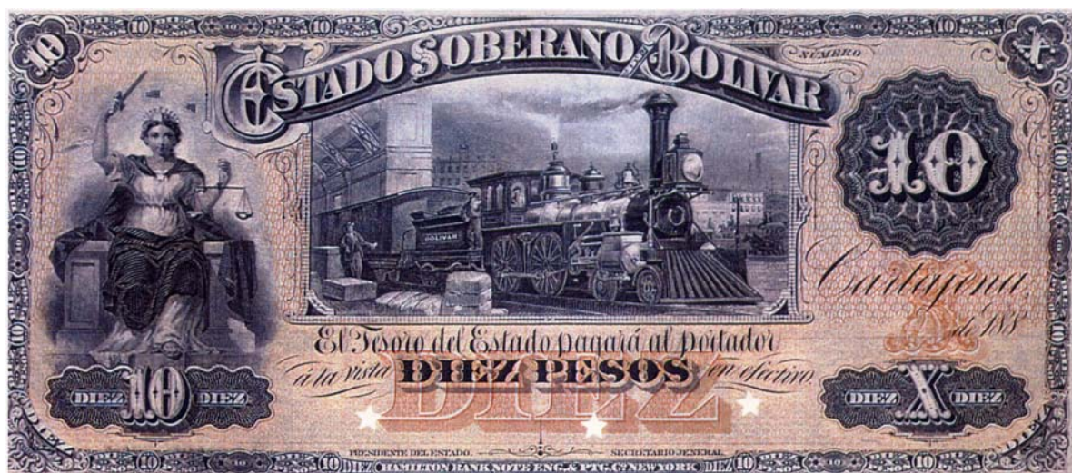
Estado Soberano de Bolívar, 10 pesos, 1883