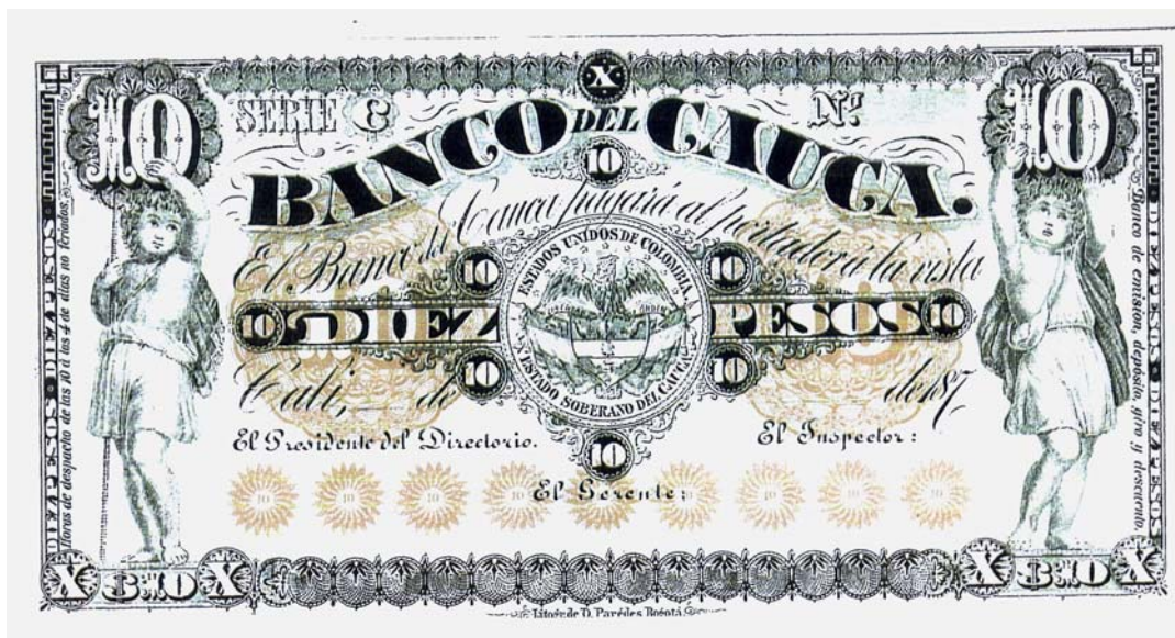
Banco del Cauca, 10 pesos, 187., reverso