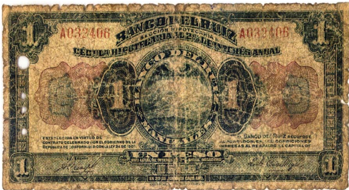
Banco del Ruíz, un peso, 1919, pick 821

El primero es el billete (cédula hipotecaria al 2% de interés anual) de un peso del Banco del Ruíz sin el resello del Banco López, color verde. Esta serie se compone de: cincuenta centavos, un peso, cinco pesos, diez pesos y veinte pesos. Ya se conocía el de cincuenta centavos, los demás (sin resello) apenas se conocen. Los números en Pick son: 821, 822, 823, 824, 825, 826 (este último, de cincuenta pesos, aún sin confirmar su existencia). Los de cincuenta centavos y veinte pesos fueron resellados por el Banco del Huila, los demás, por el Banco López de Bogotá.