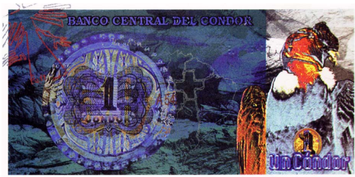
Banco Central del Cóndor, un cóndor, serie A

Asimismo, nos gustaría saber si alguien conoce las piezas emitidas y si quiere dárnoslas a conocer. Por nuestra parte, en un viaje que realizamos a Caracas, hallamos un ejemplar de un cóndor, el cual se lo damos a conocer.