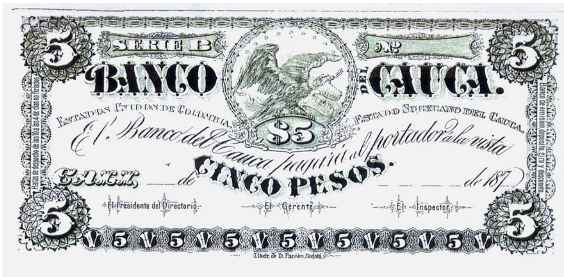
Banco del Cauca, 5 pesos, 187., anverso.