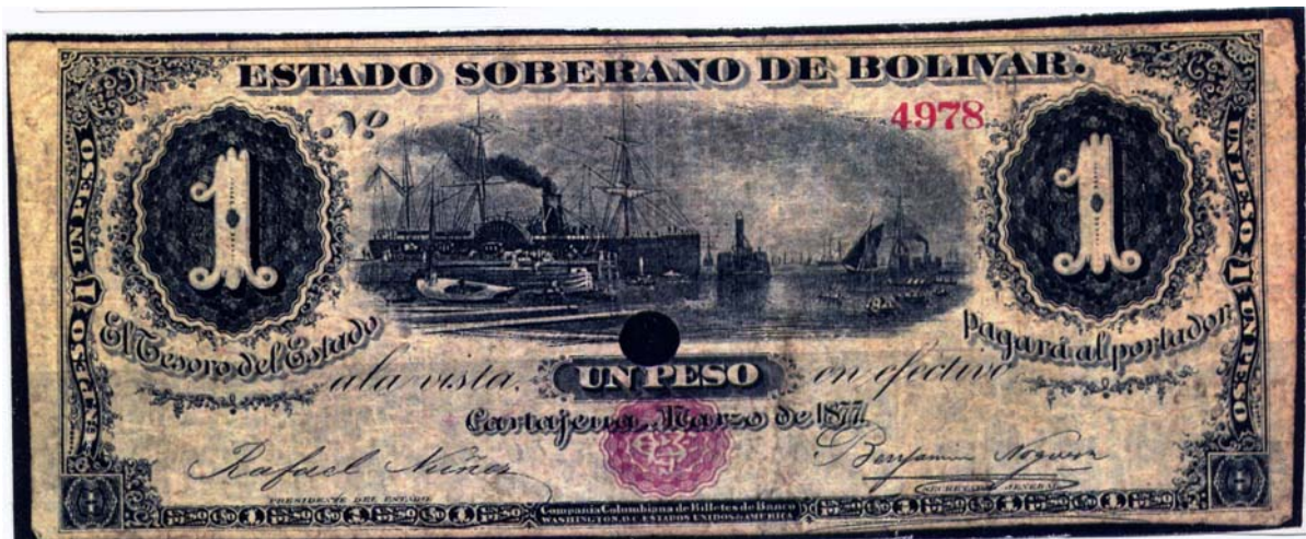
Estado Soberano de Bolívar, 1 peso, 1877