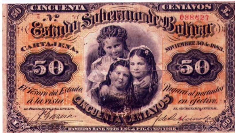
Estado Soberano de Bolívar, 50 centavos, 1883