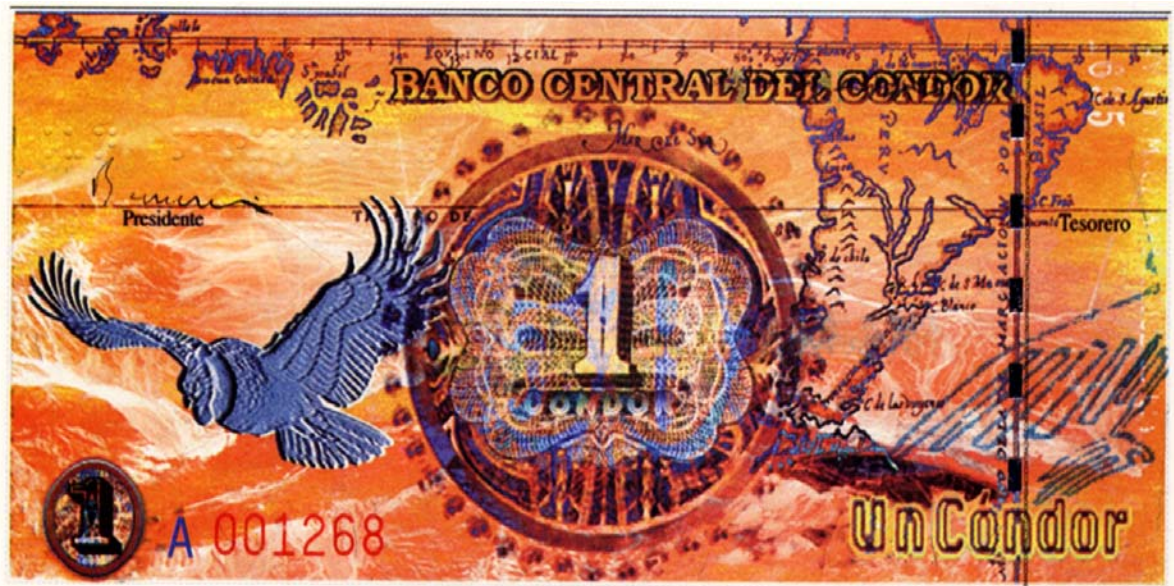
Banco Central del C3ndor, un c3ndor, serie A