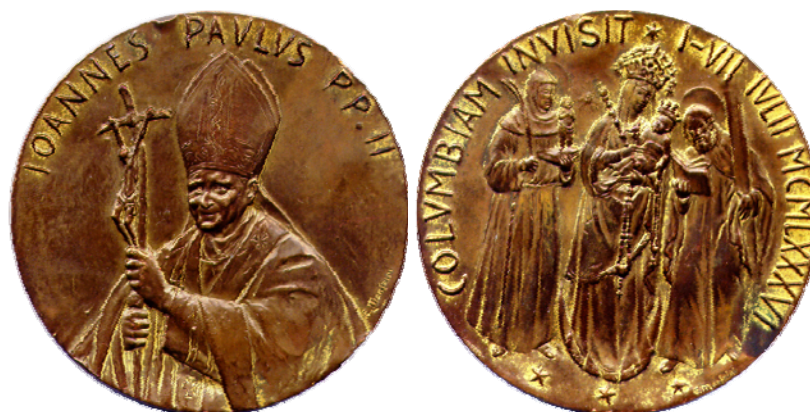
Medalla conmemorativa, visita de Juan Pablo II a Chiquinquirá

Otra medalla conmemorativa de la visita del papa a Colombia, es la que se acuñó para recordar la visita a Chiquinquirá (Boyacá). Por el anverso, la figura del papa con la cruz, Joannes Paulus P.P.II. Por el reverso, la imagen de la virgen de Chiquinquirá, alrededor, Columbian invisit 1-VII IVLII MLXXXVI, 3 estrellas.