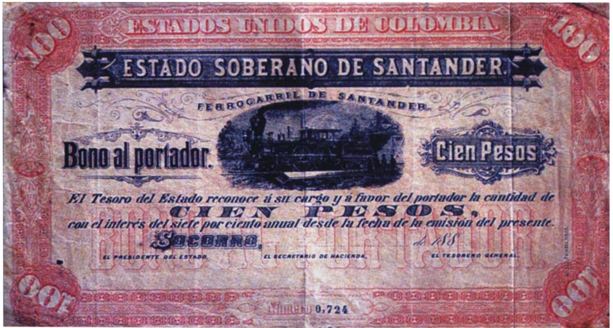
Estado Soberano de Santander, bono del Ferrocarril por 100 pesos, 188.