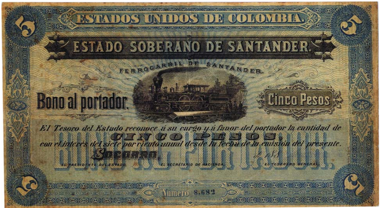
Estado Soberano de Santander, bono del ferrocarril por 5 pesos, 188.

No se conocen firmados. En la parte inferior viene el número de emisión, en este caso, para el de cinco pesos es: 8.682, y para el de cien pesos es: 0.724. Picks: 1621 y 1625.