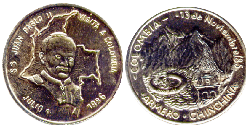
Medalla conmemorativa, visita de Juan Pablo II a Armero

Otra medalla conmemorativa de la visita del papa a Colombia, es la que se acuñó para recordar la visita a Chiquinquirá (Boyacá). Por el anverso, la figura del papa con la cruz, Joannes Paulus P.P.II. Por el reverso, la imagen de la virgen de Chiquinquirá, alrededor, Columbian invisit 1-VII IVLII MLXXXVI, 3 estrellas.