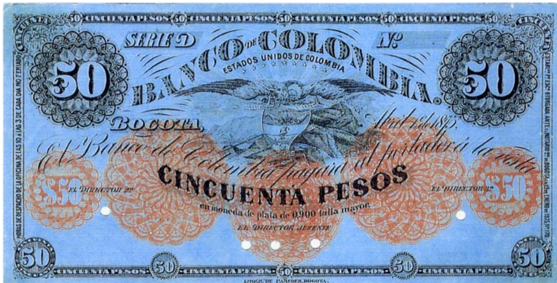
Banco de Colombia, 50 pesos, 1875