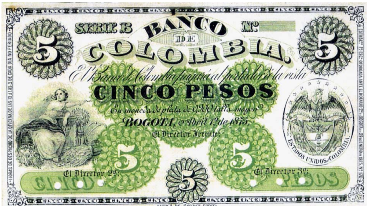
Banco de Colombia, 5 pesos, 1875

Son tres bellos ejemplares de El Banco de Colombia de 1875. Al parecer, nunca se pusieron en circulación. Fueron elaborados por la firma bogotana D. Paredes. Esta serie se compone de los siguientes valores: un peso serie A, cinco pesos serie B, diez pesos serie C y cincuenta pesos serie D. Los colores y las viñetas están muy bien armonizadas.