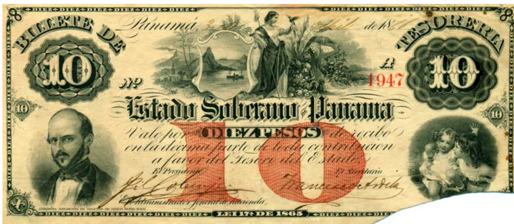
Serie de billetes del Estado Soberano de Panamá, uno, dos, tres y diez pesos.