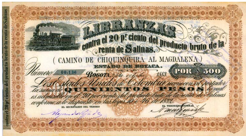
Estado Soberano de Boyacá, libranza por 500 pesos, 1883

construcción del camino de Chiquinquirá al Magdalena. El valor es de 500 pesos, una suma verdaderamente alta para la época de emisión: 1883.