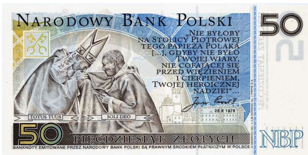
Banco de emisión de Polonia, 50 zlotych, 2006 (anverso y reverso)