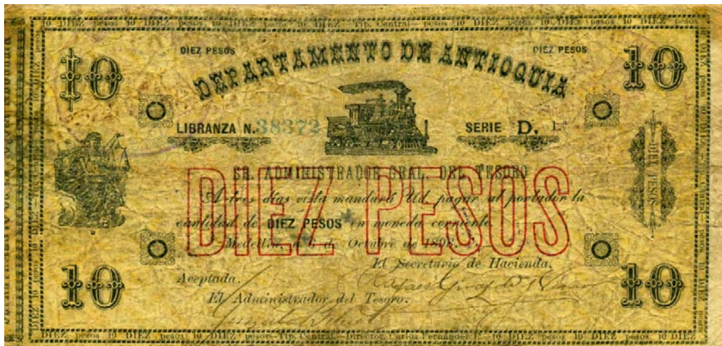
Departamento de Antioquia, diez pesos, 1900 (Pick 1017)