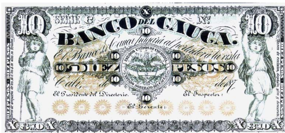
Banco del Cauca de Cali, 10 pesos, 187.