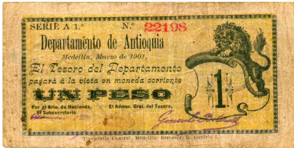
Departamento de Antioquia, un peso, 1901 (Pick 1024)