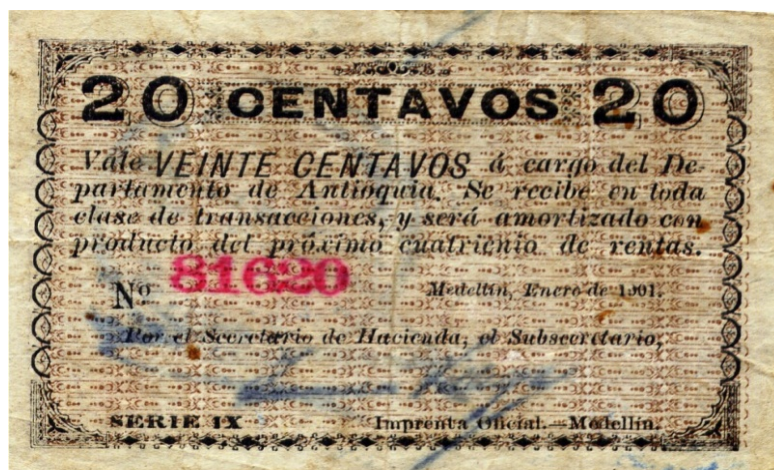
Departamento de Antioquia, veinte centavos, 1901 (Pick 1013)