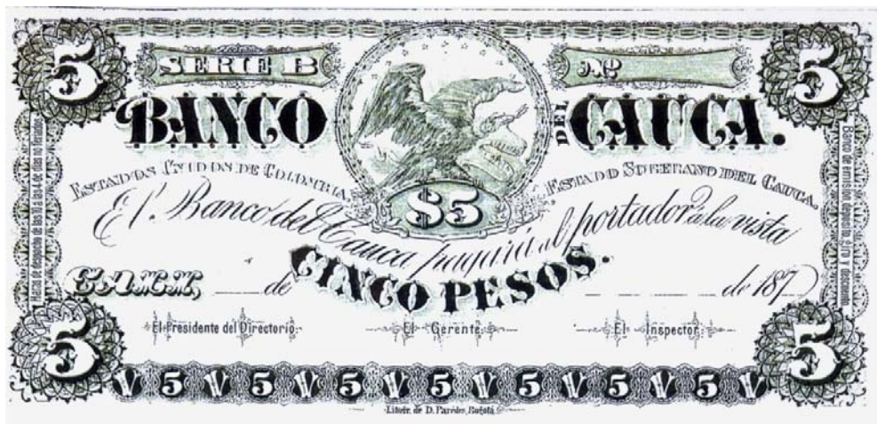
Banco del Cauca de Cali, 5 pesos, 187.