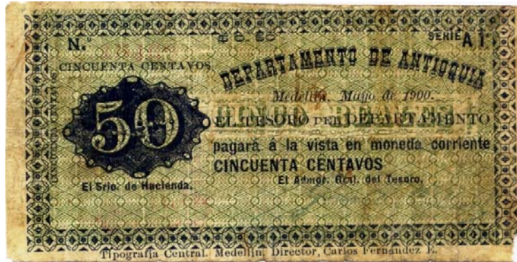
Departamento de Antioquia, cincuenta centavos, 1900 (Pick 1014)