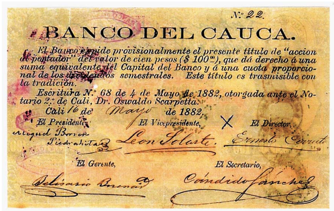
Acción del Banco del Cauca de Cali, 1882

Es una verdadera curiosidad que llegue a nuestras manos un ejemplar en buen estado, de una acción de un banco antiguo. Sin embargo, a veces suceden esas gratas ocasiones en las que conocemos estas piezas y no queremos dejarla pasar por alto. Se trata de una acción por 100 pesos del Banco del Cauca de Cali, de 1882. Tiene la firma del presidente, el vicepresidente, el director, el gerente y el secretario. Recordemos que este banco fue fundado el 4 de mayo de 1882.