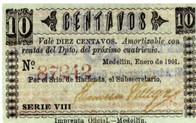
Departamento de Antioquia, diez centavos, 1901 (Pick 1021)