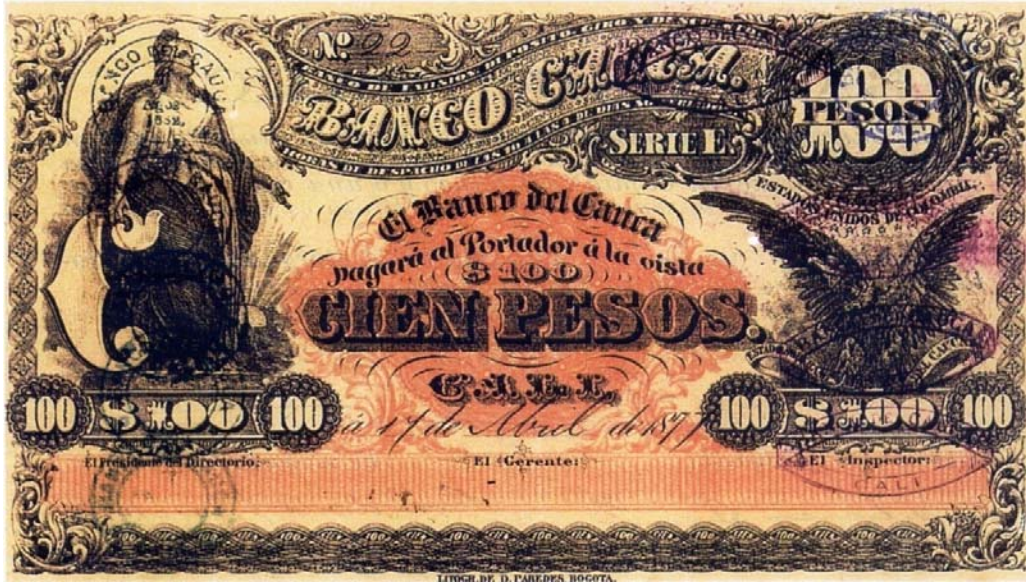
Banco del Cauca de Cali, 100 pesos, 1877