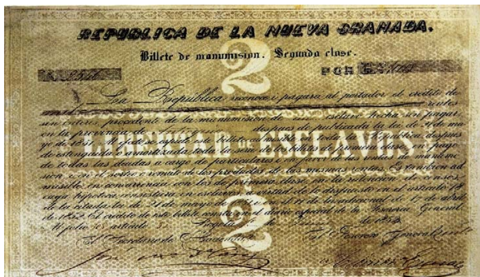
Vale de manumisión de esclavos, segunda clase, 1852