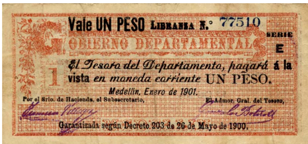
Gobierno Departamental, un peso, 1901