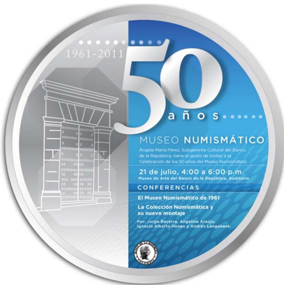
Afiche promocional de los 50 años del Museo Numismático del Banco de la República

Para promocionar este importante evento, el Banco de la República diseñó el afiche que enseguida compartimos.