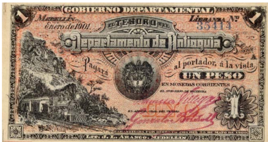
Gobierno Departamental, un peso, 1901