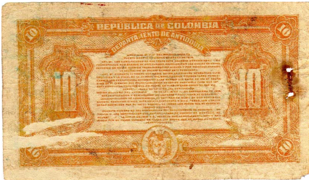
10 pesos, Casa de Moneda de Medellín, 1919 (anverso y reverso) aparentemente falso.