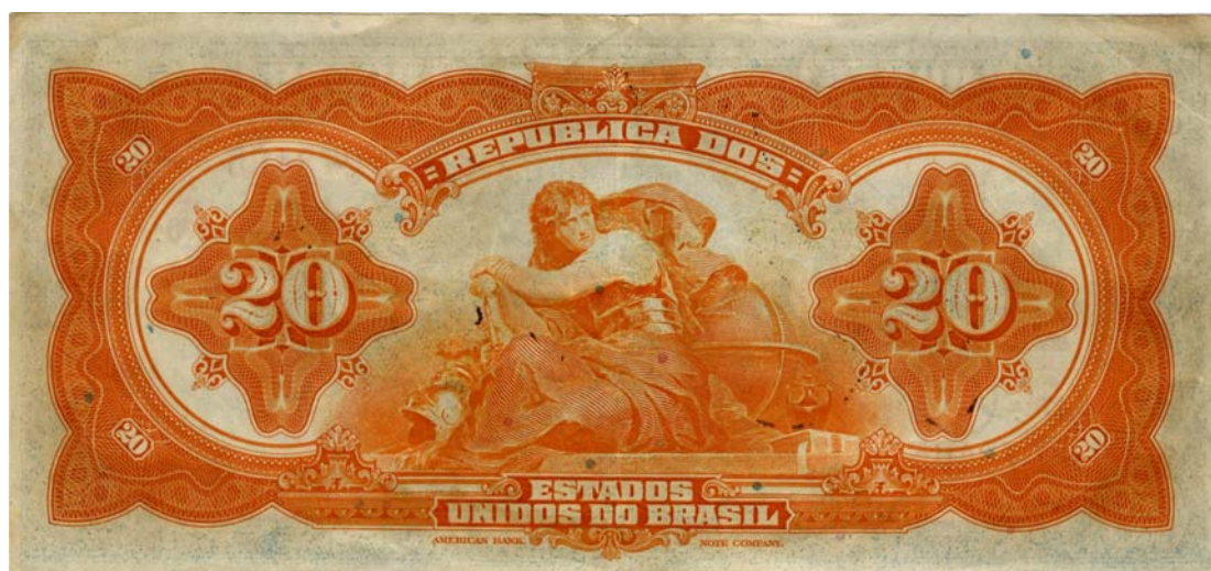
Veinte mil reis, República dos Estados Unidos do Brasil (Anverso y reverso)