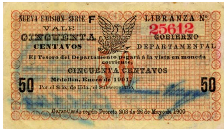
Gobierno Departamental, cincuenta centavos, 1901