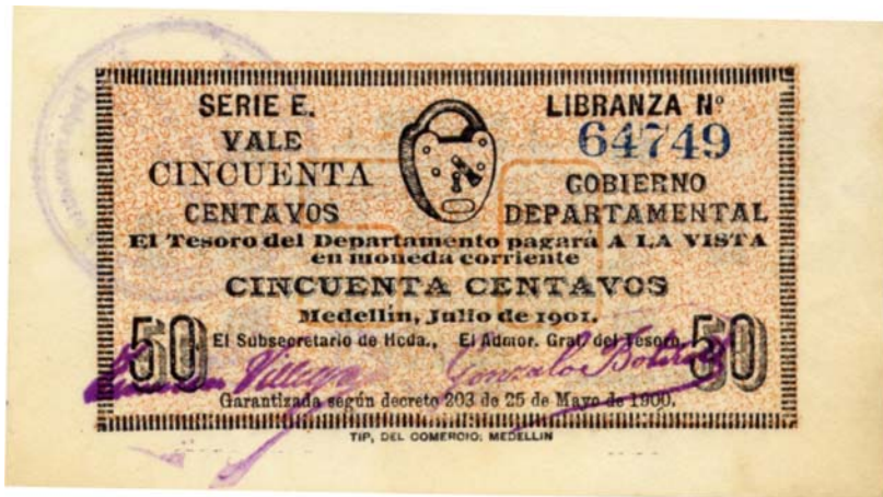
Gobierno Departamental, cincuenta centavos, 1901