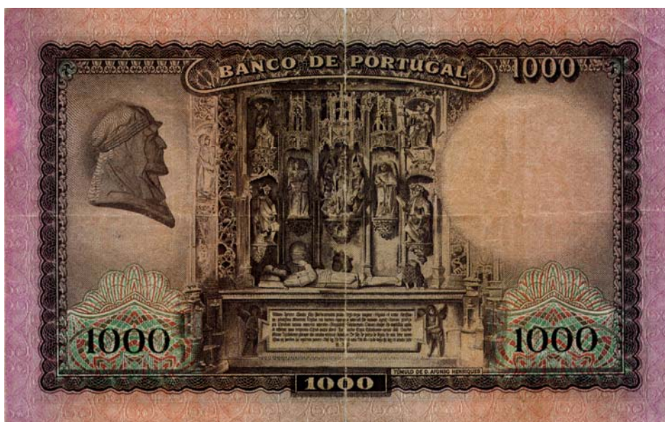
Banco de Portugal, mil escudos, 1942 (anverso y reverso)