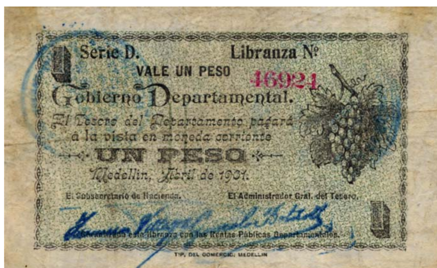
Gobierno Departamental, un peso, 1901