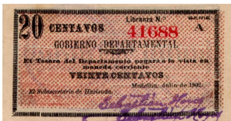
Gobierno Departamental, veinte centavos, 1901

Puesto que son numerosas las emisiones monetarias (libranzas) de este periodo, hemos seleccionado las de mejor estado de conservación para compartirlas con nuestros lectores.