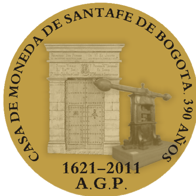
Pieza gráfica realizada por Arcelio Gómez Prada para conmemorar los 390 años de la Casa de Moneda de Bogotá

Para unirnos a esta efeméride hemos realizado la siguiente pieza gráfica en homenaje a la Casa de Moneda de Bogotá, con las siguientes características: en la parte central, la portada de la Casa de Moneda. A la izquierda, la primera prensa de acuñación de la época colonial