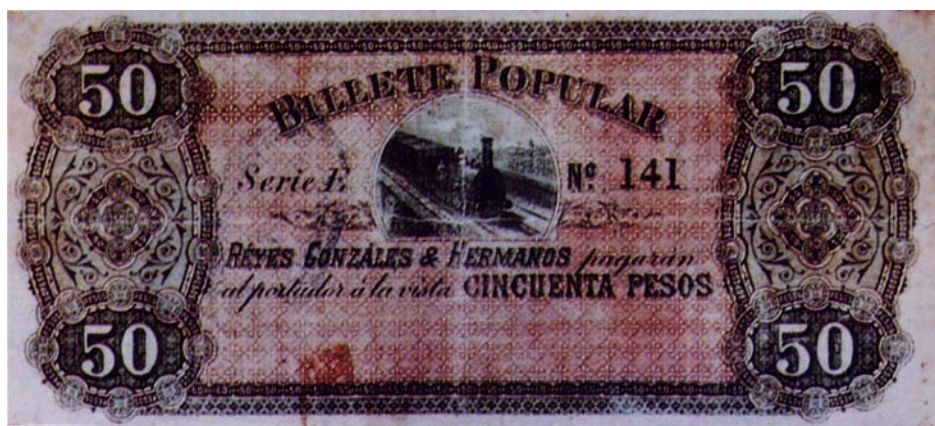
Billete popular de cincuenta pesos, resellado por el reverso, 1900

Enseguida les compartimos billetes del Banco Popular de Soto resellados por el reverso y adoptados por la Junta de Emisión. Todos tienen el mismo resello por el reverso, como puede verse en el de diez pesos.