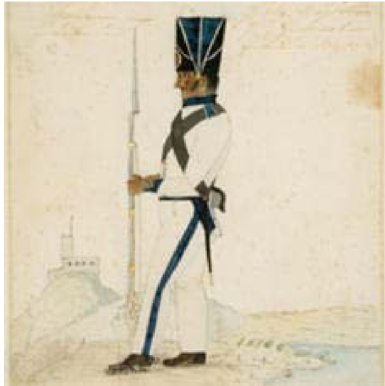
Imagen de presentación de la exposición

territorio, lograr el reconocimiento de Colombia como república independiente ante las potencias europeas y afianzar las nuevas instituciones republicanas". No olviden que la entrada es gratuita, desde las 9 a.m. hasta las 5 p.m.