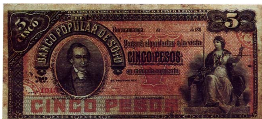
Billete del Banco Popular de Soto de cinco pesos, resellado por el reverso, 1900