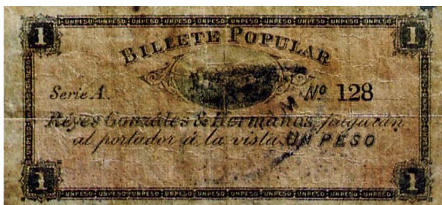
Billete popular de un peso, resellado por el reverso, 1900

A continuación, les mostramos billetes populares de Reyes González & Hermanos resellados por el reverso y adoptados por la Junta de Emisión. Todos tienen el mismo resello por el reverso, como puede verse en el de diez pesos.