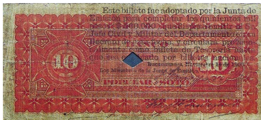
Billete del Banco Popular de Soto de diez pesos, resellado por el reverso, 1900