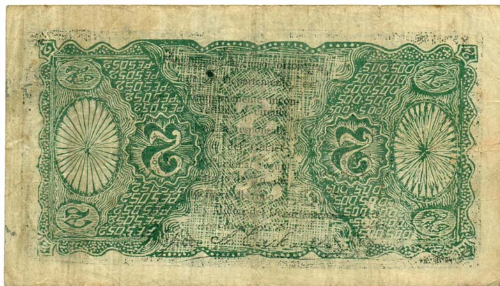
Banco de Barranquilla, dos pesos, 1900. (Reverso invertido)