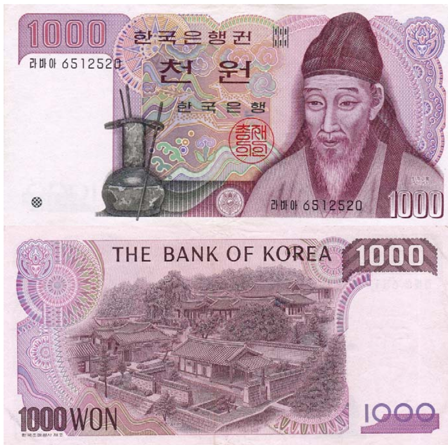
Banco de Corea, 1000 won (anverso y reverso)