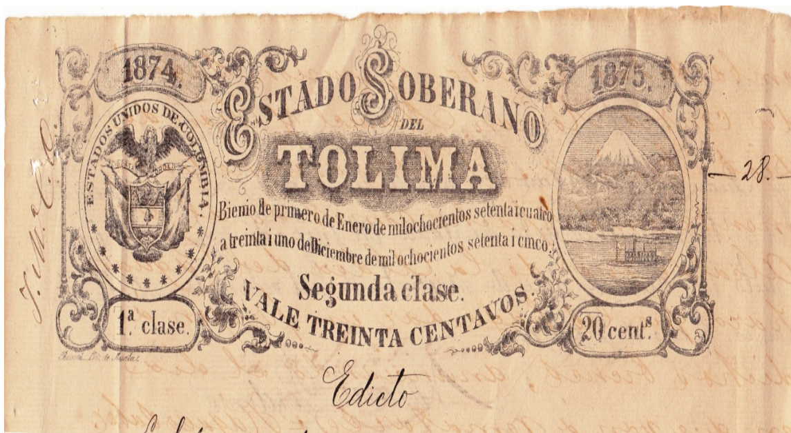
Papel sellado Estado Soberano del Tolima, 1874-1875