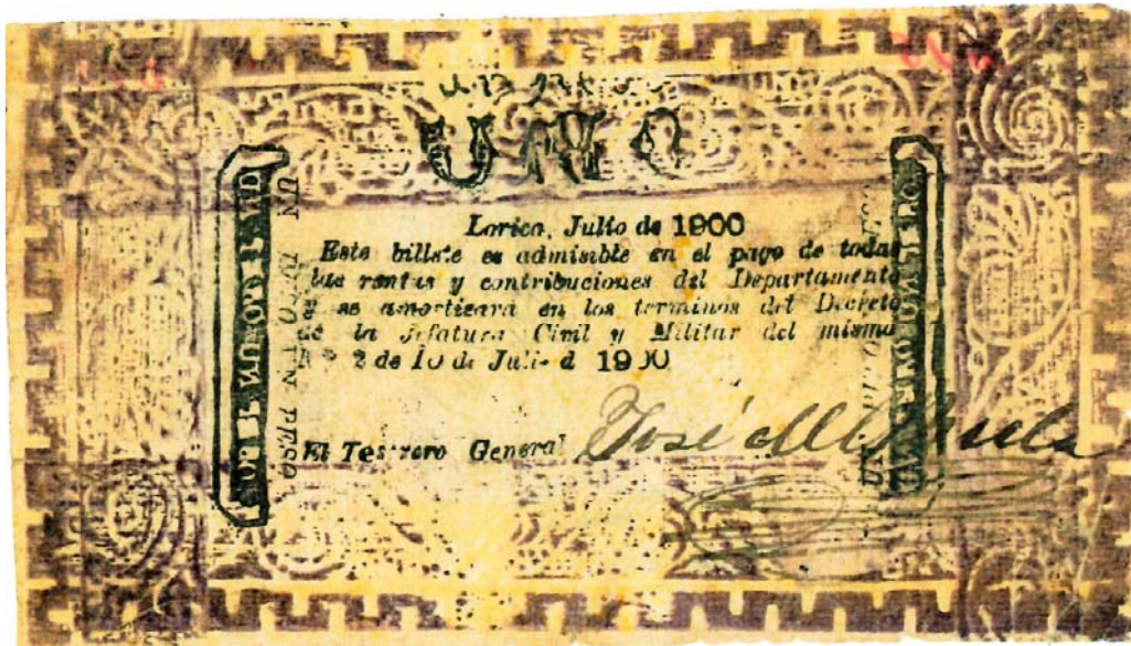
Un peso, Departamento de Bolívar, Lórica, 1900 (Reverso)