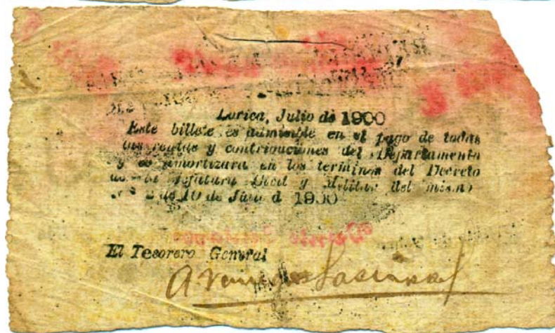
20 centavos, Departamento de Bolívar, Lorica, 1900 (Anverso y reverso)