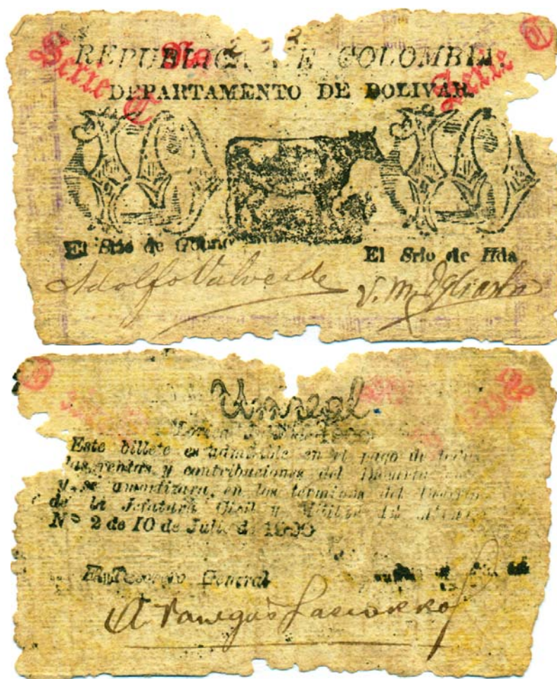
10 centavos, Departamento de Bolívar, Lórica, 1900 (Anverso y reverso)

Estas piezas son bastante raras y conseguirlas en un buen estado de conservación es casi imposible. Solamente conocemos dos colecciones particulares donde reposan las que les mostraremos, por lo cual le agradecemos a sus dueños y los felicitamos por conservar estas joyas. Los valores son 10, 20, 50 centavos y 1 peso. Fueron elaborados rústicamente en papeles comunes, a una sola tinta (negra en unos y verde en otros), todos en fondo blanco.