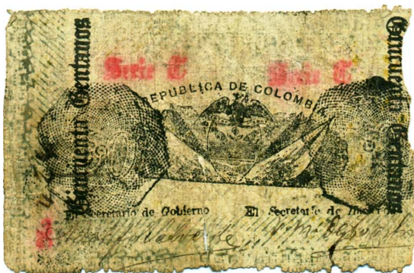
50 centavos, Departamento de Bolívar, Lorica, 1900 (Anverso)