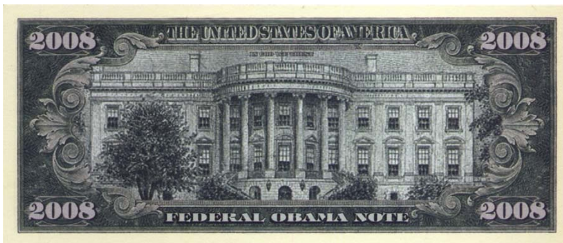
Billete fantasía, conmemorativo de la primera elección de Barack Obama