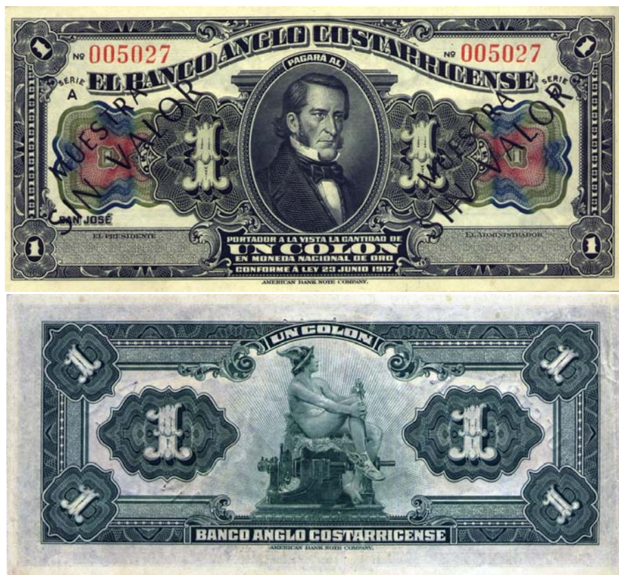
Banco Anglo Costarricense, un colon, 1917 (Anverso y reverso)

Todos son profusamente ilustrados tanto por el anverso como por el reverso, en tonos suaves de colores y elegantemente diseñados.