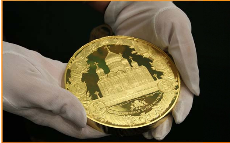
Moneda conmemorativa de veinticinco mil rublos, 2012