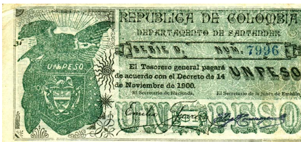
Departamento de Santander. Un peso, 1900 (Anverso)

Administrador Deptal. de Hda. Nacional. El Secretario de la Junta de Emisión. Tiene dos firmas. A la izquierda nos muestra el escudo nacional ilustrado con una especie de "arañas". Son de colores verdes y negros. Tiene un sello de color rojo. Pick 1160. Este mismo catálogo de billetes menciona un cuarto valor por un peso, con el número 1161, el cual no conocemos. Si alguien tiene noticias del mismo, le agradecemos que nos lo haga saber.