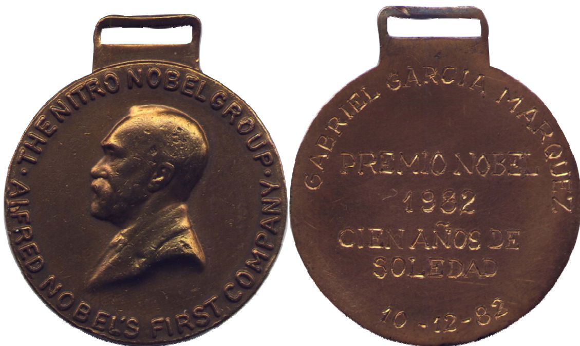
Medalla Gabriel García Márquez Premio Nobel 1982 (anverso y reverso)

Tenemos en nuestra colección una medalla que homenajea al Nobel por su premio de 1982, la cual queremos compartirles. En el anverso tiene una imagen de Alfred Nobel y alrededor de la misma, la leyenda "The Nitro Nobel Group. Alfred Nobel's First Company". Por el reverso, alrededor, "Gabriel García Márquez". En el centro, a cuatro líneas, "Premio Nobel 1982. Cien años de soledad. 10.12.82". La medalla está batida en cobre rojo.