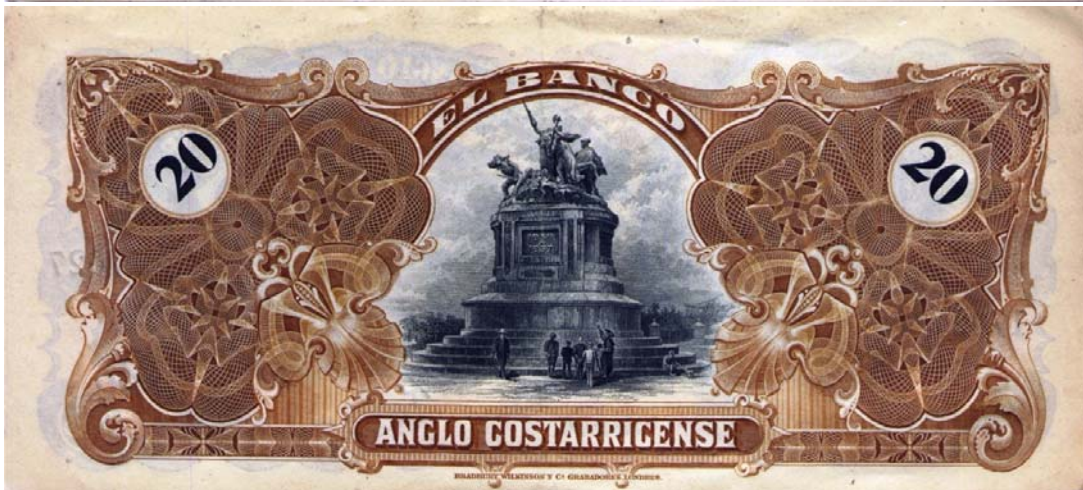
Banco Anglo Costarricense, veinte colones, 19.. (Anverso y reverso)