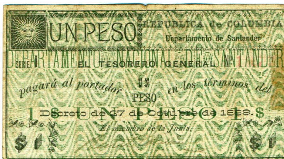
Departamento de Santander. Un peso, 1899 (Anverso)

El segundo billete de un peso tiene la siguiente descripción: Anverso: Departamento de Santander. Serie B. Imagen de un sol radiante a la izquierda. Tiene el siguiente texto: "El Tesorero General pagará al portador un peso en los términos del Decreto de 27 de octubre de 1889. El miembro de la Junta". Tiene una firma. No. 1099. Pick 1153.