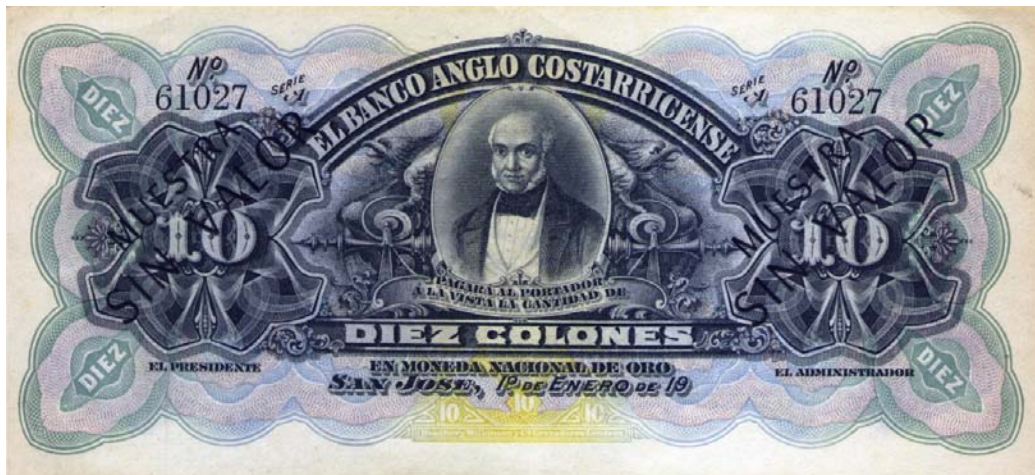
Banco Anglo Costarricense, diez colones, 19.. (Anverso)