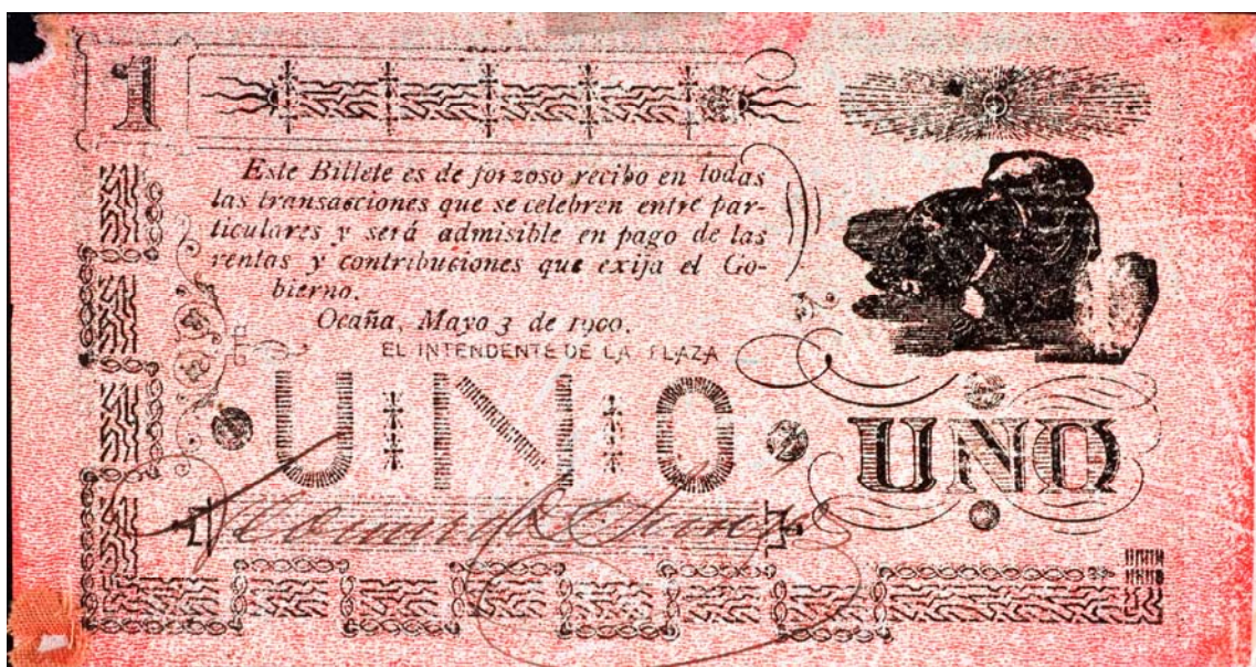
Departamento de Santander. Un peso, Ocaña, 1900 (Reverso)

El segundo billete de un peso tiene la siguiente descripción: Anverso: Departamento de Santander. Serie B. Imagen de un sol radiante a la izquierda. Tiene el siguiente texto: "El Tesorero General pagará al portador un peso en los términos del Decreto de 27 de octubre de 1889. El miembro de la Junta". Tiene una firma. No. 1099. Pick 1153.