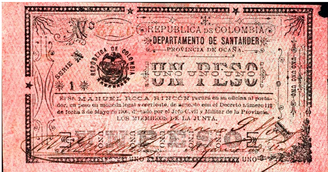
Departamento de Santander. Un peso, Ocaña, 1900 (Anverso)

En valores de 1 peso se conocen tres tipos. Uno de ellos es el emitido por la Provincia de Ocaña. Anverso : República de Colombia Departamento de Santander. Un peso. Escudo nacional. Reverso : está ilustrado con la imagen de un bello ejemplar canino. Pick 1155. Es muy raro. Tiene como fecha 1900.