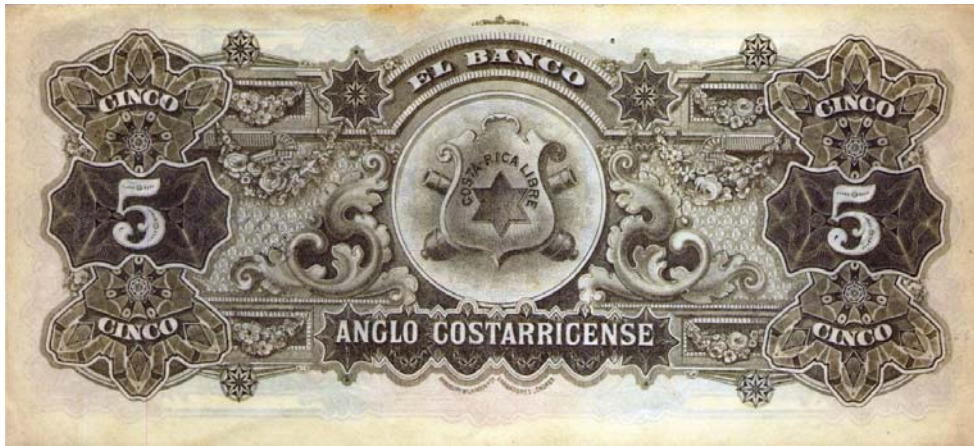
Banco Anglo Costarricense, cinco colones, 19.. (Anverso y reverso)