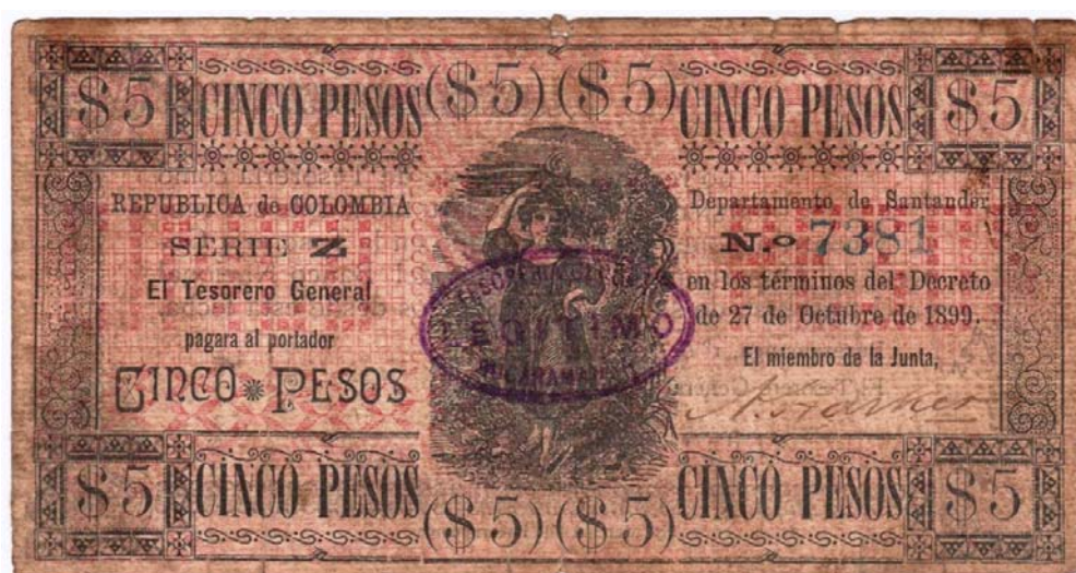
Departamento de Santander. Cinco pesos, 1899 (Anverso)

El valor de cinco pesos es bastante curioso por el anverso, pues nos muestra en todo el centro, la imagen de una bella mujer descalza. El valor en números se repite ocho veces, y en letras, cinco veces. La serie es la Z y el Decreto que le da vida es del 29 de octubre de 1899. Tiene una firma y un sello. No. 0429. Pick 1154.