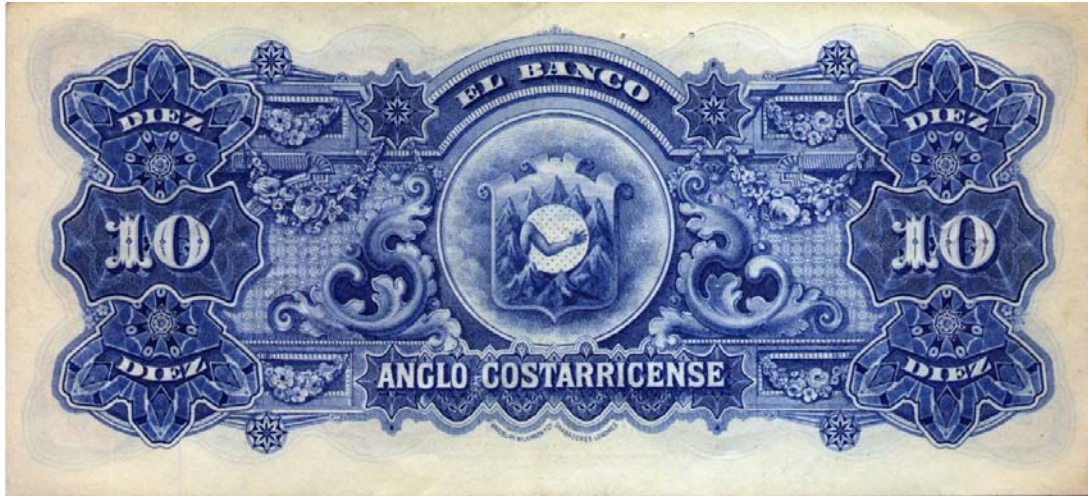
Banco Anglo Costarricense, diez colones, 19.. (Reverso)