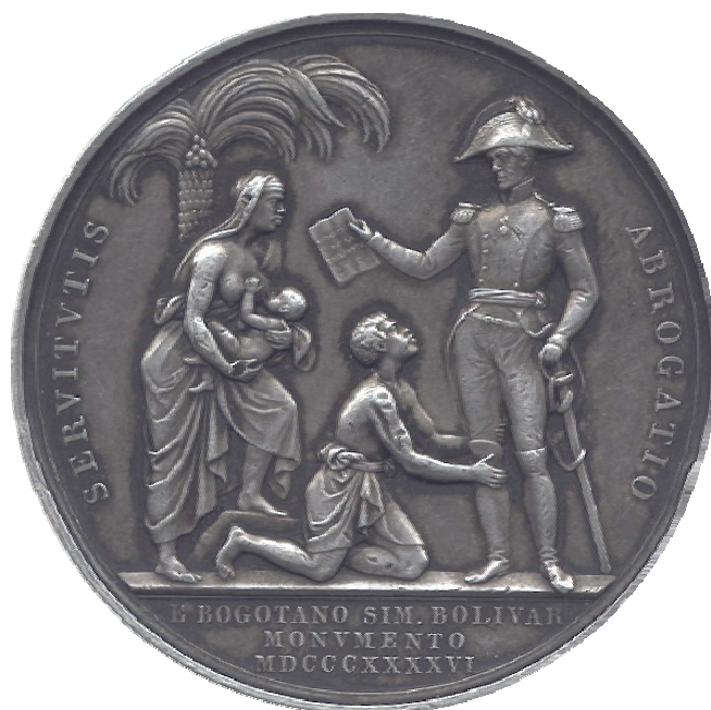
Medalla conmemorativa Estatua de Simón Bolívar (Reverso)

Y a propósito de la libertad de los esclavos en Colombia, también nos parece oportuno recordar a uno de los emblemáticos santos de la Iglesia Católica, el primero de raza negra en América: San Martín de Porres Velásquez, nacido en Lima el 9 de diciembre de 1579. Hijo de un hidalgo español y una negra liberta.