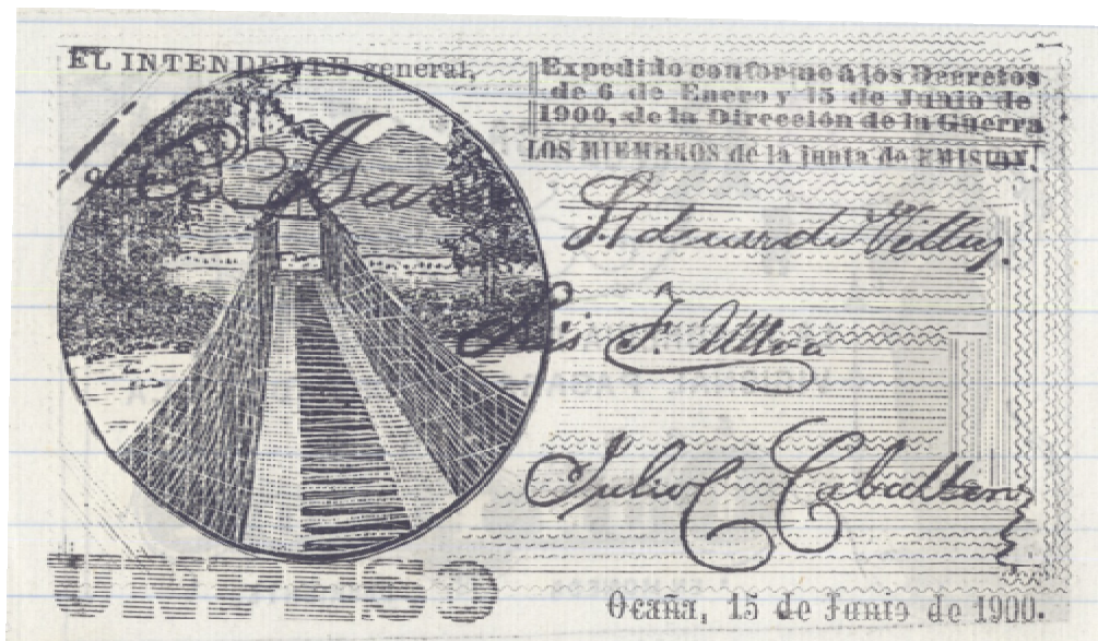
Un peso, Ocaña, 1900 (Anverso y reverso)

Cinco pesos. Anverso: República de Colombia, La Tesorería del Gobierno Provisional pagará al portador a la vista 5 pesos en moneda corriente. Tiene la imagen de un soldado sosteniendo una bandera al lado de un cañón.