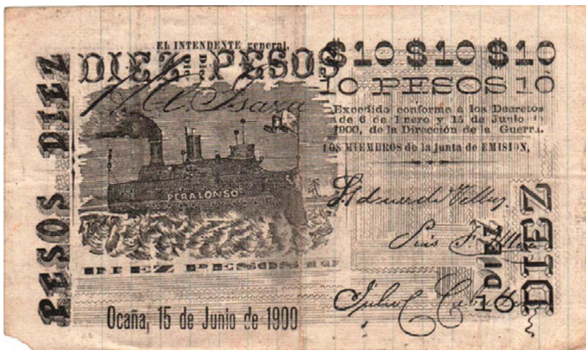
Diez pesos, Ocaña, 1900 (Anverso y reverso)