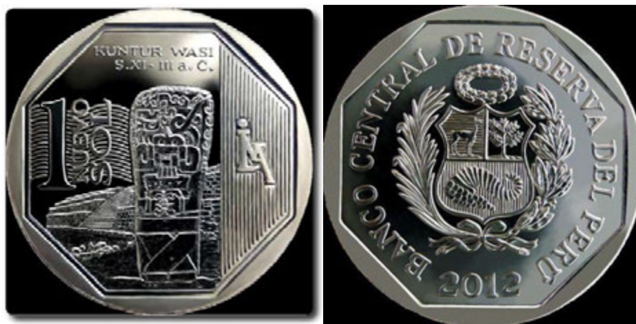
Un nuevo sol de Perú (Kuntur Wasi)

BCR. En el anverso de la moneda se observa en el centro el Escudo de Armas del Perú, en el borde la leyenda "Banco Central de Reserva del Perú", el año de acuñación y un polígono inscrito de ocho lados. En el reverso, en la parte central, se distingue uno de los monolitos descubierto en 1946, que representa a un personaje de pie con rasgos de felino. Detrás del monolito se aprecia parte del templo o centro ceremonial de Kuntur Wasi. También se observa la marca de la Casa Nacional de Moneda sobre un diseño geométrico de líneas verticales así como la denominación en número y el nombre de la unidad monetaria sobre unas líneas ondulantes. En la parte superior se muestra la frase Kuntur Wasi S. XI – III a.C. Anteriormente el BCR lanzó monedas alusivas al Tumi de Oro (Lambayeque), los Sarcófagos de Karajía (Amazonas), la Estela de Raimondi (Ancash), las Chullpas de Sillustani (Puno), el Monasterio de Santa Catalina (Arequipa), Machu Picchu (Cusco), el Gran Pajatén (San Martín), la Piedra de Saywite (Apurímac), la Fortaleza del Real Felipe (Callao) y el Templo del Sol, Vilcashuamán (Ayacucho).