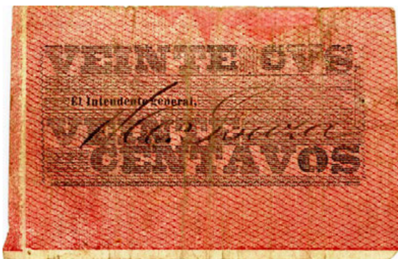
Veinte centavos, Ocaña, 1900 (Anverso y reverso)

Un peso. Anverso: en la parte superior, República de Colombia. Al lado izquierdo, una alegoría a la libertad, sosteniendo en una mano una espada y en la otra una cadena rota. En todo el centro, la Tesorería del Gobierno Provisional pagará al portador a la vista un peso en moneda corriente. Tiene un sello de la revolución. Reverso: al lado izquierdo, un puente colgante sobre el río Peralonso. El Intendente General, firma a la derecha.