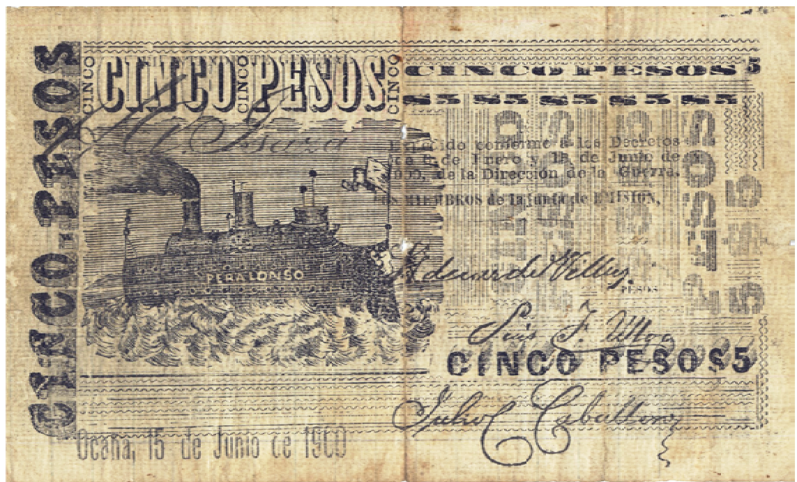
Cinco pesos, Ocaña, 1900 (Anverso y reverso)

Diez pesos. Anverso y reverso similares al de cinco pesos, solamente cambia la cifra.