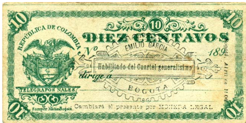
Diez centavos, Bogotá, 1900

Los valores son: diez, veinte, treinta, cuarenta, cincuenta, sesenta, setenta, ochenta y noventa centavos, y un peso. Sólo se conocen resellados los valores de 10, 30 y 50 centavos, y el de 1 peso. El resello está en tinta negra y dice: "Emilio García. Habilitado del Cuartel Generalísimo. Bogotá. Cambiará el presente por moneda legal. Bogotá abril de 1900". No sabemos a cuánto llegó esta emisión, pero por la escases en el mercado actual, deducimos que fue muy limitada.