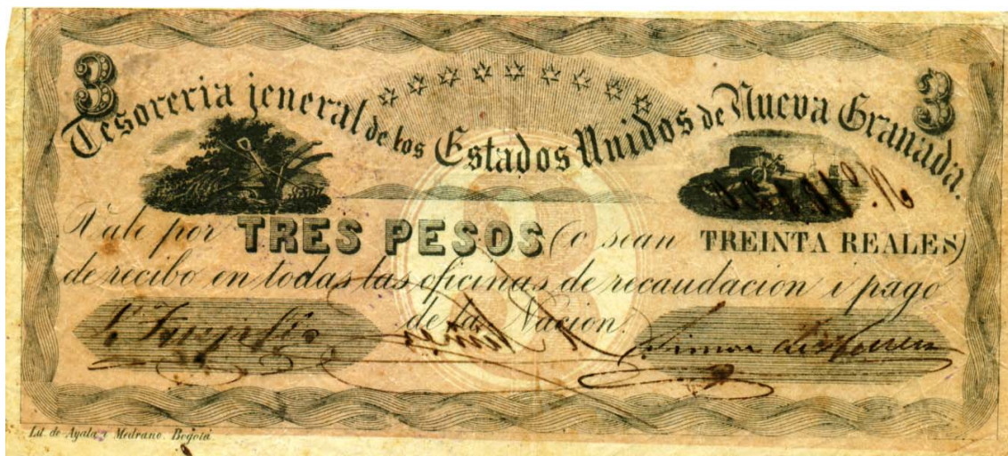
Tesorería Jeneral de los Estados Unidos de Nueva Granada, tres pesos

superior, tiene nueve estrellas alusivas a los nueve estados de la Nueva Granada. A lado y lado de la cifra central, hay alegorías referentes a la agricultura. El texto es el mismo de los anteriores. Posee dos firmas. No tiene fecha. Es unifax.