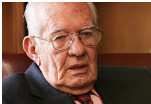
Alfonso López Michelsen, expresidente colombiano