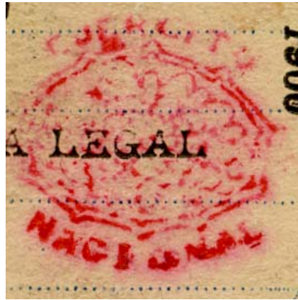
Detalle con resello del Ejército Nacional Liberal