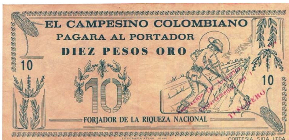
Bono “El campesino colombiano” por diez pesos (anverso y reverso)