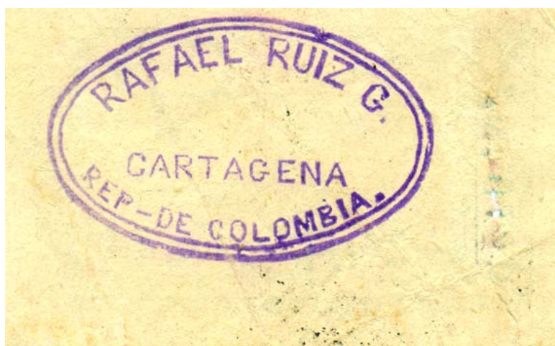
Bono del Bazar de Cartaga por 5 centavos, 1900 (anverso y reverso)