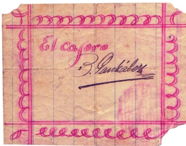
Cincuenta centavos, Labranzagrande, 1900 (anverso y reverso)

A pesar de que hemos reseñado algunas emisiones monetarias en Colombia durante este periodo de conflicto, no alcanzaron a ser tan numerosas como en otros países latinoamericanos. Es el caso de México, donde en la Revolución del Catorce, se emitieron numerosos billetes por el gobierno, los revolucionarios, los estados, las ciudades, las poblaciones y los particulares, quienes también emitieron fichas. El caso más abundante en Colombia fueron los resellos, que el Banco Nacional realizaba sobre billetes de bancos privados. Esto será tema para el próximo capítulo.