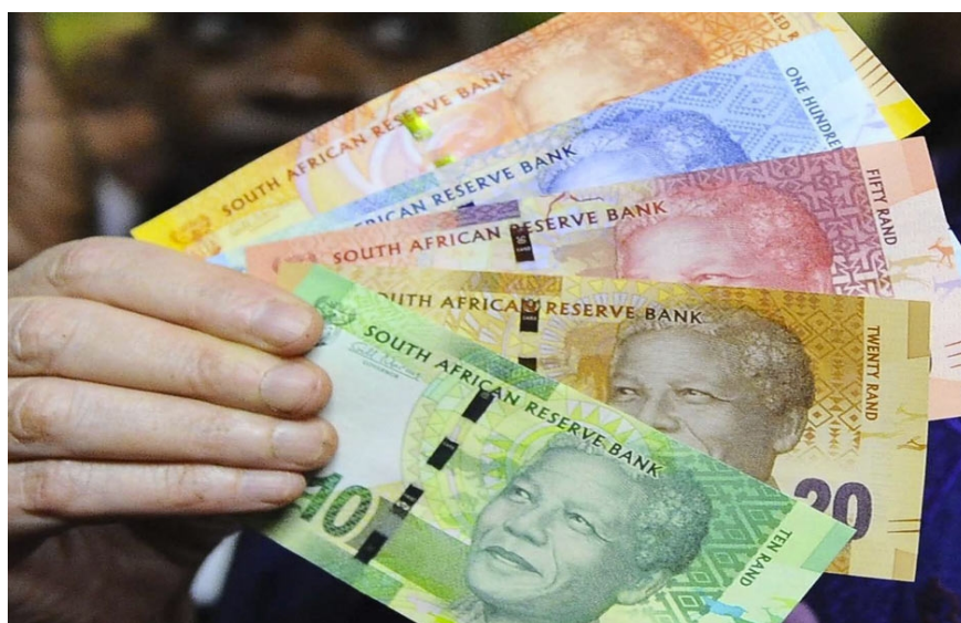
Nueva serie de billetes sudafricanos con la imagen de Nelson Mandela

le conoce popularmente en su clan. El reverso de los billetes permanecerá como hasta el momento, con uno de los “cinco grandes” en cada billete: leopardo, león, búfalo, elefante y rinoceronte, supuestamente los más difíciles de abatir. Los flamantes billetes, que cuentan con nuevas medidas para detectar las falsificaciones, compartirán el curso legal con los antiguos. Nelson Mandela, que luchó durante 67 años contra el régimen de segregación racial del apartheid, impuesto por la minoría blanca sudafricana hasta su elección como presidente en 1994, llegó a 94 años en julio de 2012.