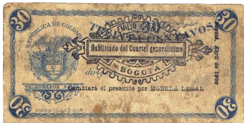
Treinta centavos, Bogotá, 1900