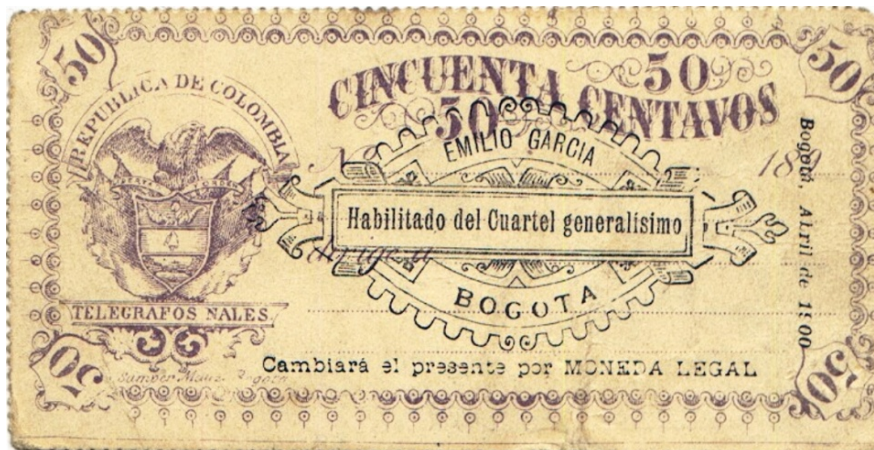
Cincuenta centavos, Bogotá, 1900