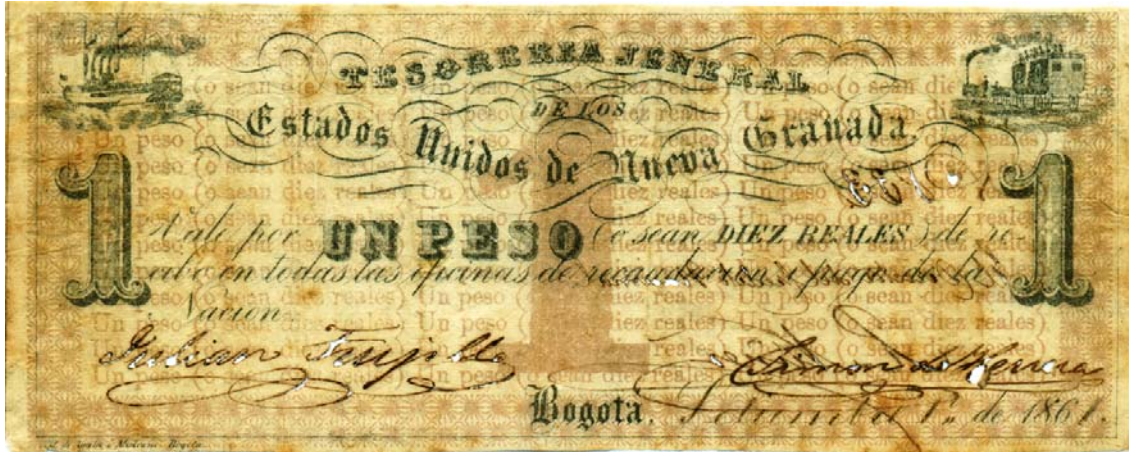
Tesorería Jeneral de los Estados Unidos de Nueva Granada, un peso, 1861

El de un peso equivalía a diez reales. Posee dos viñetas en las esquinas superiores: a la izquierda un barco, y a la derecha una locomotora de vapor. Tiene la cifra "1" a la izquierda, en el centro y a la derecha. "Vale UN PESO (o sean diez reales) de recibo en todas las oficinas de recaudación i pago de la Nación". Tiene dos firmas. Bogotá, septiembre 1 de 1861. Es unifax.