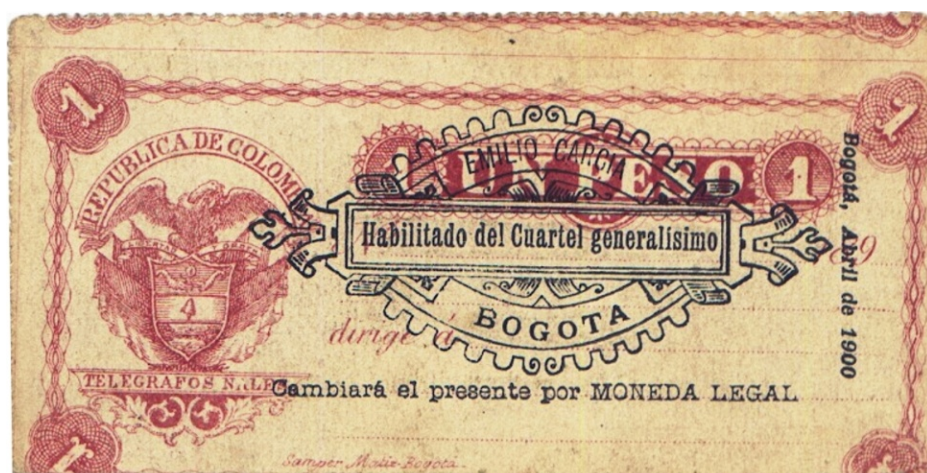
Un peso, Bogotá, 1900