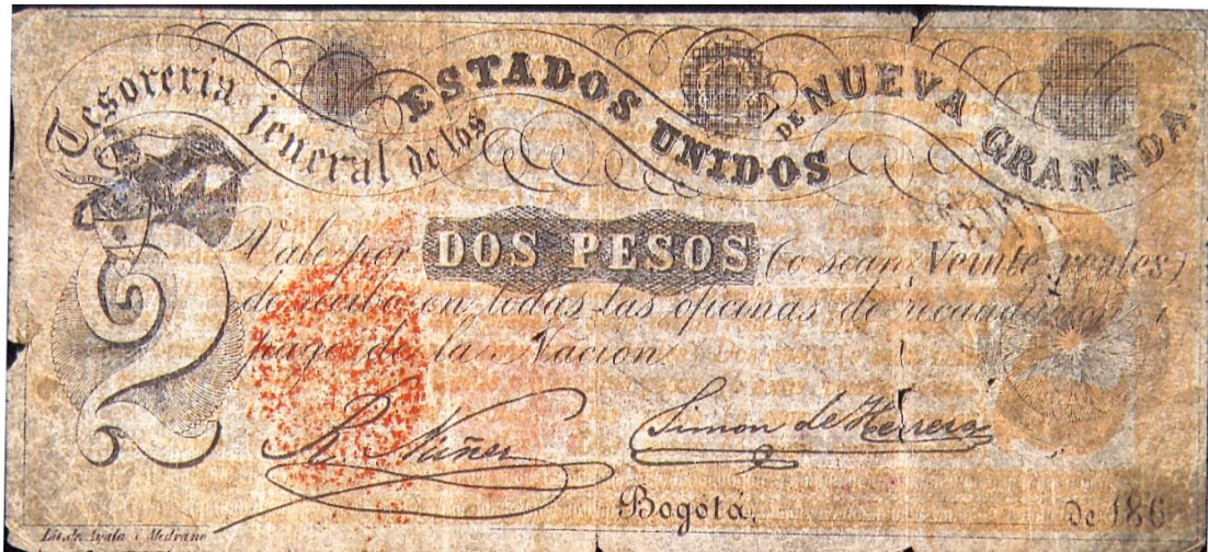
Tesorería Jeneral de los Estados Unidos de Nueva Granada, dos pesos, 1861

El de dos pesos equivalía a veinte reales. A la izquierda, de manera notoria, aparece la cifra "2", y en la parte superior de ella, superpuesto, el escudo nacional. Está firmado por Rafael Núñez y Simón de Herrera. Tiene el mismo texto del anterior. Posee un sello en color rojo, ilegible. Es unifax.