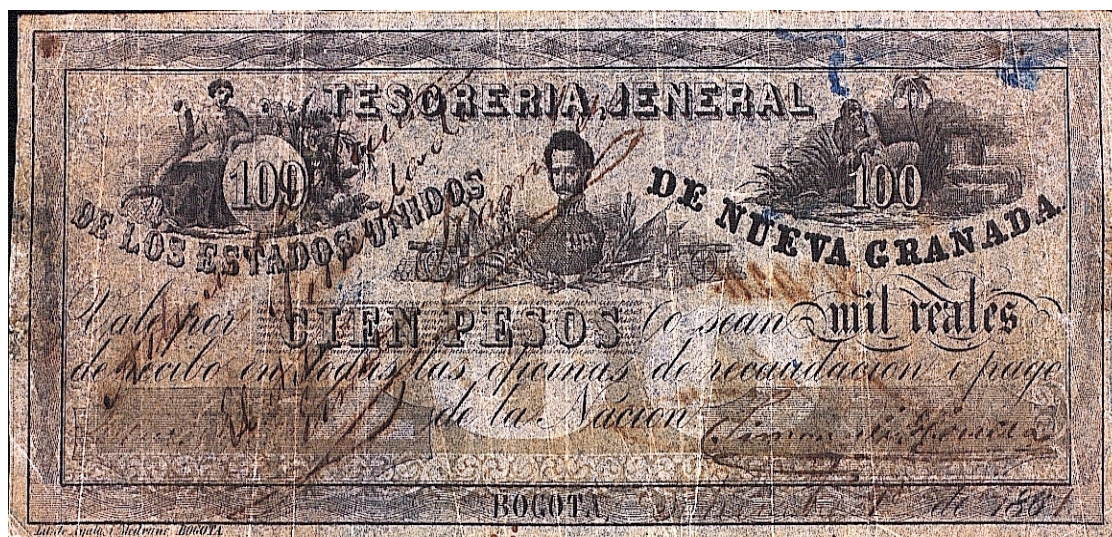
Tesorería Jeneral de los Estados Unidos de Nueva Granada, cien pesos, 1861

El texto es el mismo de los anteriores. Tiene dos firmas. Bogotá, septiembre 1 de 1861. Al igual que los otros valores, es unifax.