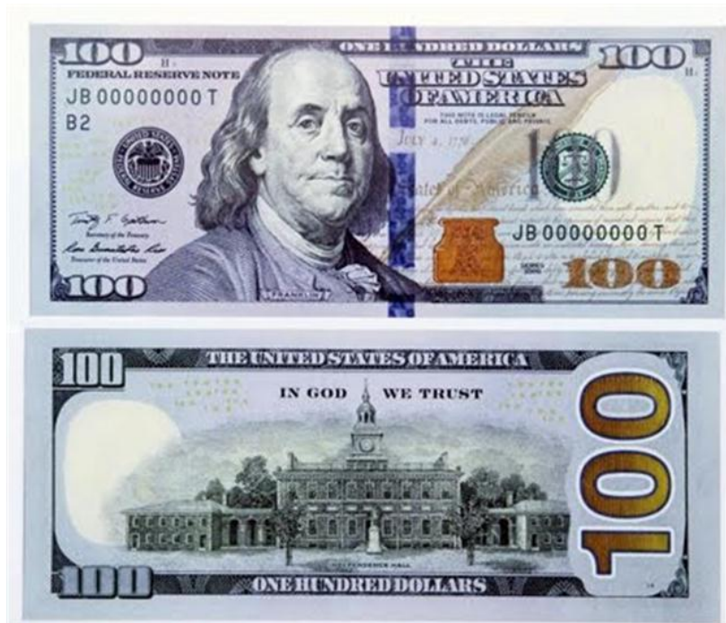
Nuevo billete de 100 dólares de los Estados Unidos de América

las nuevas tecnologías, y no tanto con que el billete tenga muchos distintivos, algo que los usuarios "no quieren", según Lambert. En los nuevos billetes se mantendrán otros distintivos de seguridad que ya están presentes en los actuales, como la imagen "oculta" de Franklin que está a la derecha del retrato principal, un hilo que se ilumina de rosa con la luz ultravioleta y el número 100 en uno de los bordes que cambia de cobre a verde. También el papel con el que se hacen los billetes de 100 es "bastante único", en palabras de Lambert, compuesto de lino en un 25 % y de algodón en un 75 %, y con fibras de seguridad rojas y azules. Gracias a ese papel, solamente con el tacto "se puede detectar si un billete es falso o no", indicó el director asociado de la Fed. La Reserva Federal quiere, ante todo, dejar claro a los consumidores y a las empresas que los billetes con el anterior diseño van a continuar totalmente legales y no van a verse devaluados. En la actualidad hay aproximadamente 8.900 millones de billetes de 100 dólares en circulación, con un valor total de 890.000 millones de dólares. Entre la mitad y dos tercios se mueve fuera de Estados Unidos. Los billetes con el diseño antiguo, que data de la remodelación hecha en 1996, volverán paulatinamente al sistema bancario en un proceso que "durará años", según Lambert, y de ahí pasarán a la Reserva Federal, donde se verificará su autenticidad y serán destruidos.