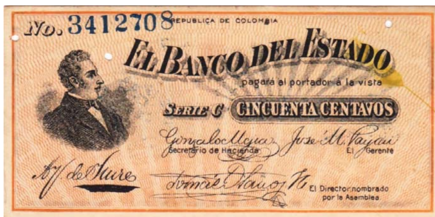
50 centavos, Banco del Estado, 1900