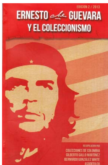
Carátula del catálogo "Ernesto Che Guevara y el coleccionismo"