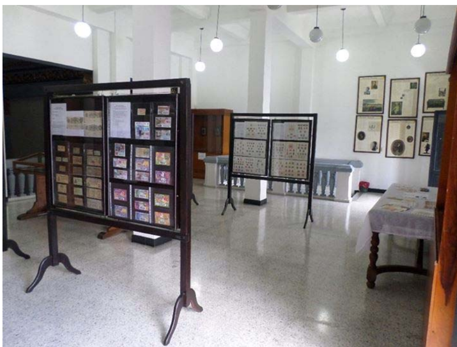
Vista de una sala de la exposición, cortesía del señor Ernesto Arévalo

por la División de Cultura y Patrimonio de la Universidad del Cauca y el Grupo de Coleccionistas de Popayán y tiene como objetivo dar a conocer material filatélico, numismático y loterofílico en el que se destaca la historia de Colombia: personajes, hechos e hitos históricos (batallas, tratados, lugares) y aspectos que han contribuido al engrandecimiento de nuestra nación. El material expuesto pertenece a miembros del Grupo de Coleccionistas de Popayán y a la Universidad del Cauca. La exposición estará abierta al público durante todo el mes de Octubre de 2013 en horario laboral, en el Panteón de los Próceres, carrera 7 No. 3-55, en el centro histórico de Popayán.