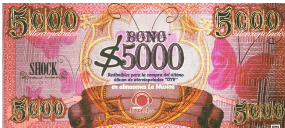
Bono de apoyo a la Banda de rock Aterciopelados, por 5.000 pesos (anverso y reverso)