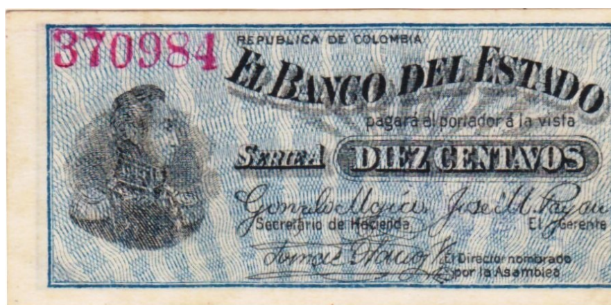
10 centavos, Banco del Estado, 1900

Un dato curioso es que todos están fechados por el reverso, ignoramos a qué se debió, pues lo usual es que sea por el anverso. Los reversos son iguales para todos.