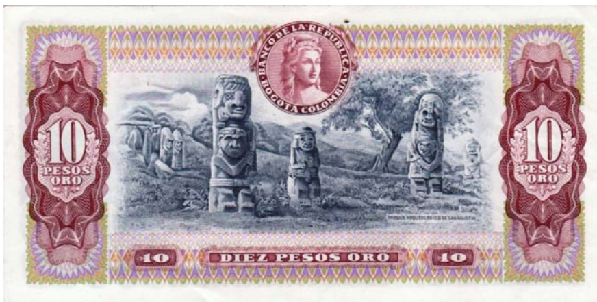
10 pesos, Banco de la República (Detalle Parque Arqueológico de San Agustín)

El Banco de la República de Colombia en su emisión de diez pesos oro de julio 20 de 1963, nos muestra por el reverso una vista del Parque Arqueológico de San Agustín. La última fecha conocida de este ejemplar es 1980. Serie AZ (PPH., 209).