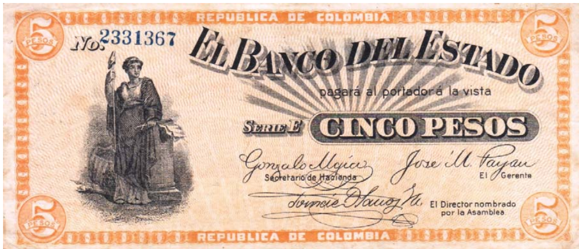
Cinco pesos, Banco del Estado, 1900