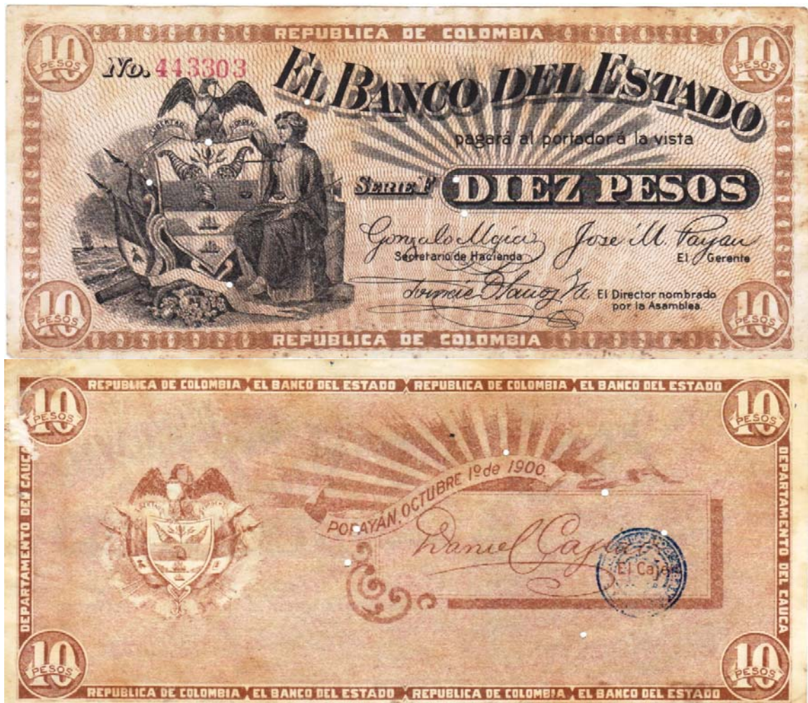
10 pesos, Banco del Estado, 1900 (anverso y reverso)