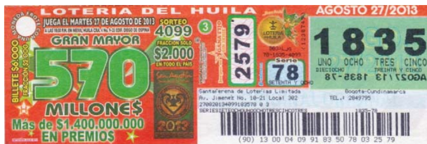
Billete de la Lotería del Huila, agosto 27 de 2013

La lotería del Huila, en sus sorteos semanales, también está conmemorando los cien años del descubrimiento de la zona arqueológica de San Agustín.