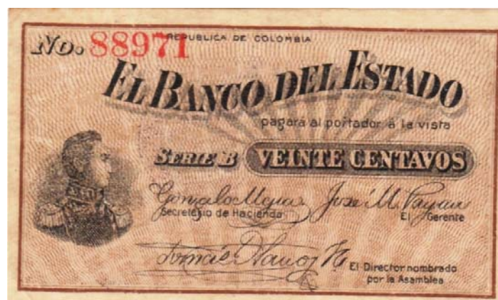
20 centavos, Banco del Estado, 1900