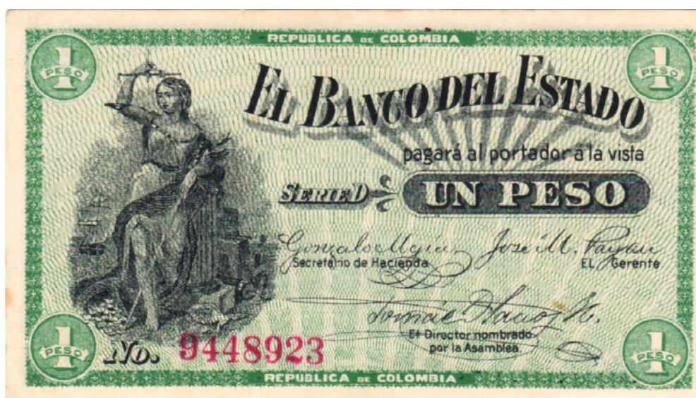
Un peso, Banco del Estado, 1900