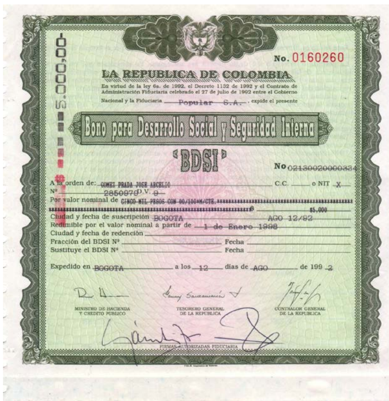
Bono para Desarrollo Social y Seguridad Interna, 1992

Igualmente, les mostramos un cupón de otra emisión por valor de $2.75, serie A No. 04900 de 1973. Firma el Ministro de Hacienda y Crédito Público.