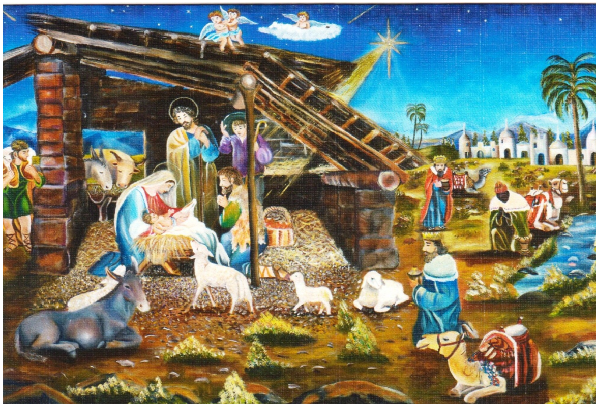
“El nacimiento”, obra de Fabián Castillo Ortiz (Pintor con la boca) – Asociación de pintores con la boca y con el pie – Bogotá DC.

A manera de editorial, queremos compartirles la alegría que nos embarga en estos días porque: ¡ES NAVIDAD!