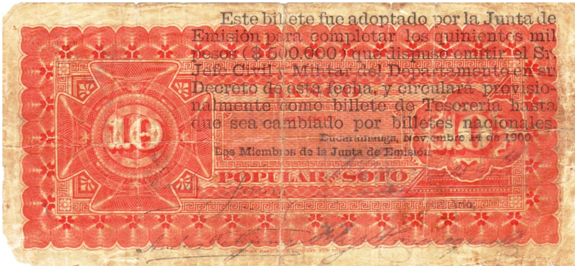
Diez pesos, Banco Popular de Soto, resellado en 1900 (Reverso)

Los de la firma particular Reyes González & Hermanos fueron resellados igualmente, por el reverso. La serie consta de los valores de uno, cinco, diez, veinte, cincuenta y cien pesos, pero no todos fueron resellados y adoptados como billetes provisionales. Son verdaderamente raros tanto los unos como los otros. Les compartimos algunos de los que conocemos resellados de esta serie.