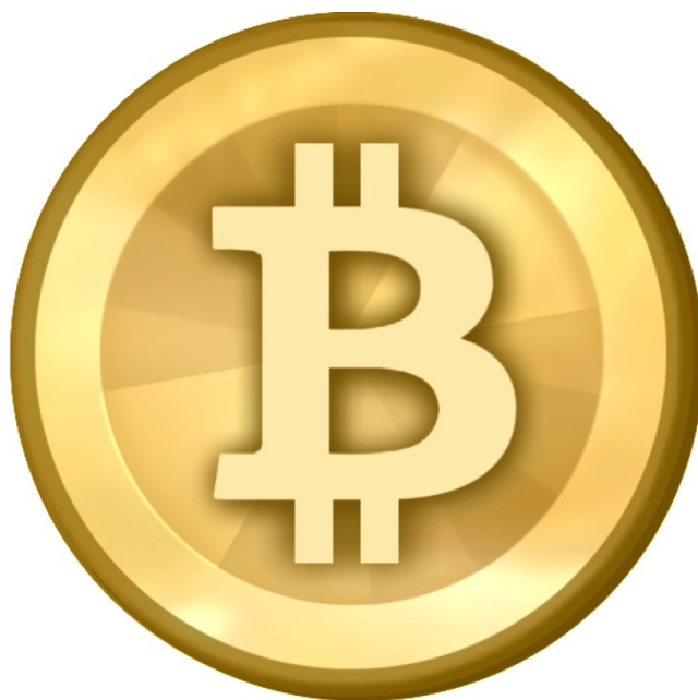
Bitcoin, moneda virtual