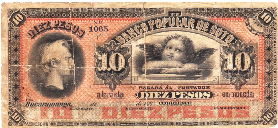
Diez pesos, Banco Popular de Soto, resellado en 1900