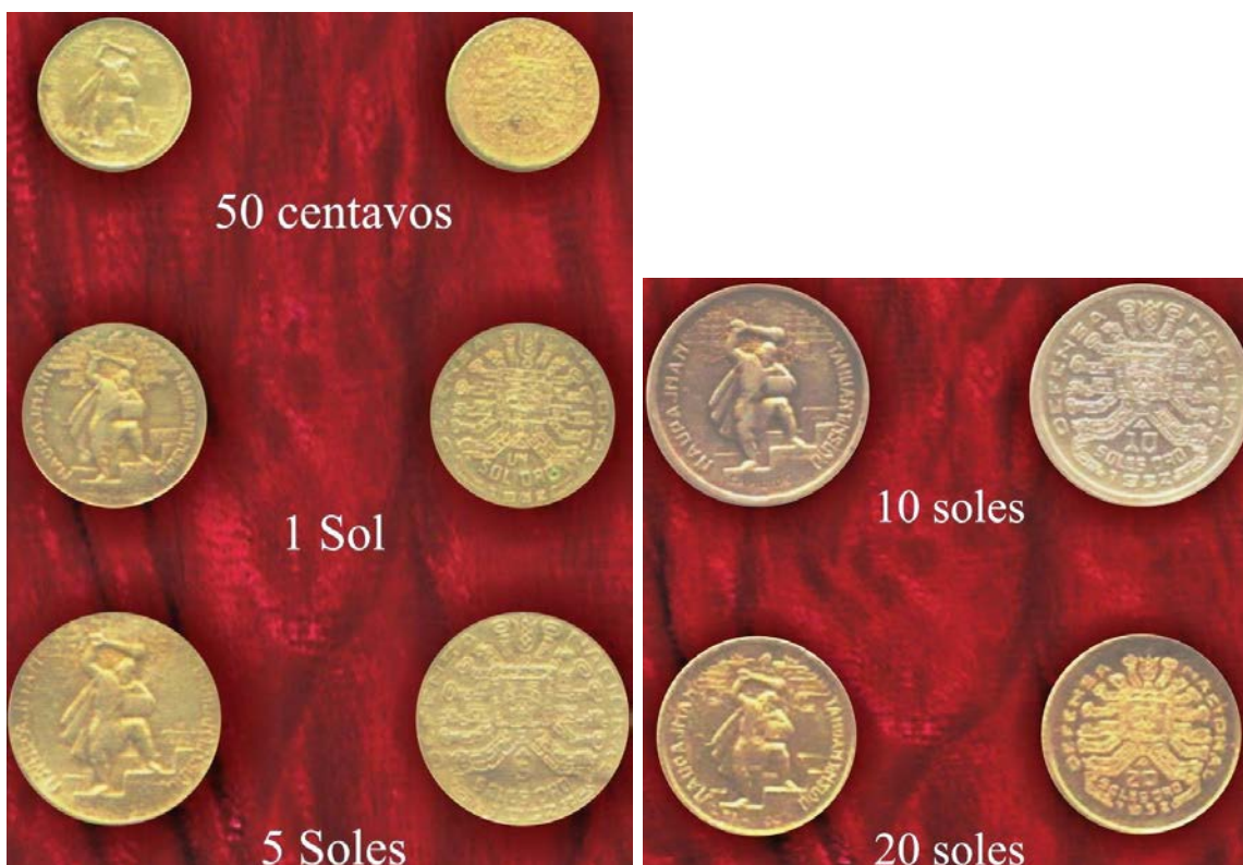
Monedas de la Defensa Nacional del Perú, 1932.