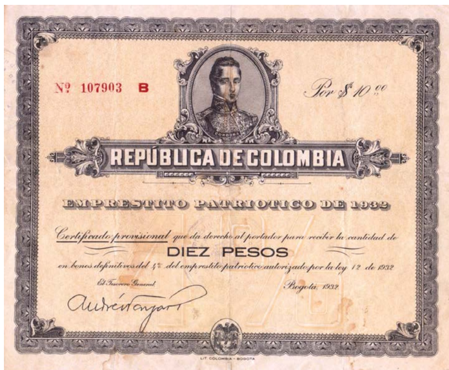
Diez pesos, Bono provisional de la Defensa Nacional, 1932

El gobierno emitió dos bonos por valores de cinco y diez, a los cuales llamó empréstito patriótico de 1932. Primero fueron provisionales mientras se imprimían los propios. Estos traen la figura del general antioqueño José María Córdova. Fueron impresos en la litografía Colombia-Bogotá, hoy imprenta nacional, a una sola tinta (negra). Tienen un sello que les da autenticidad: "Empréstito Patriótico de 1932. República de Colombia. Bono de la Defensa Nacional. Fue un diseño sencillo pero elegante.