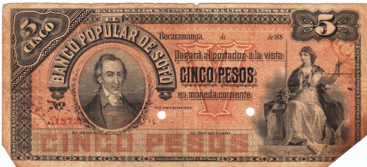
Cinco pesos, Banco Popular de Soto, resellado en 1900

El Banco Popular de Soto fue fundado en la ciudad de Bucaramanga en la década de 1880 y sólo alcanzó a emitir una serie de billetes. Fueron elaborados por la firma americana American Bank Note de Nueva York, y de ahí que sean de gran factura. En el de un peso no identificamos el personaje; en el de cinco pesos está Francisco de Soto y en el de diez pesos está Francisco de Paula Santander.