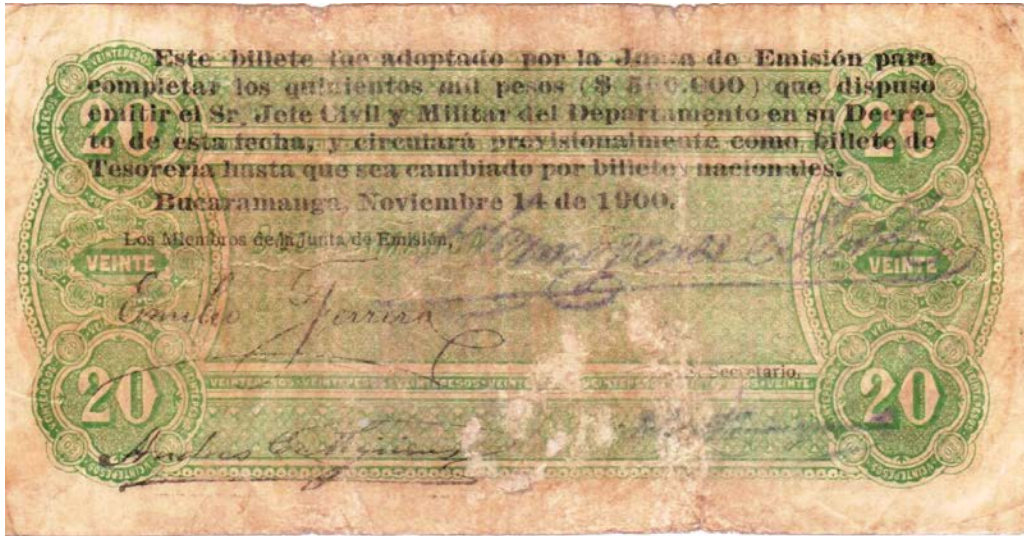
20 pesos, Billeto Popular Reyes Gonzáles & Hermanos, resellado en 1900 (reverso)

Más adelante hubo otro conflicto en el siglo pasado, el del año 1932 con Perú, luego de que un comando del ejército de este país se tomara la ciudad de Leticia (actual capital del departamento del Amazonas). Ante tal hecho y estando las arcas de la Tesorería colombiana con muy pocos recursos, el gobierno apeló a la solidaridad de los ciudadanos quienes se despojaron de dinero y joyas para apoyar la defensa del territorio.