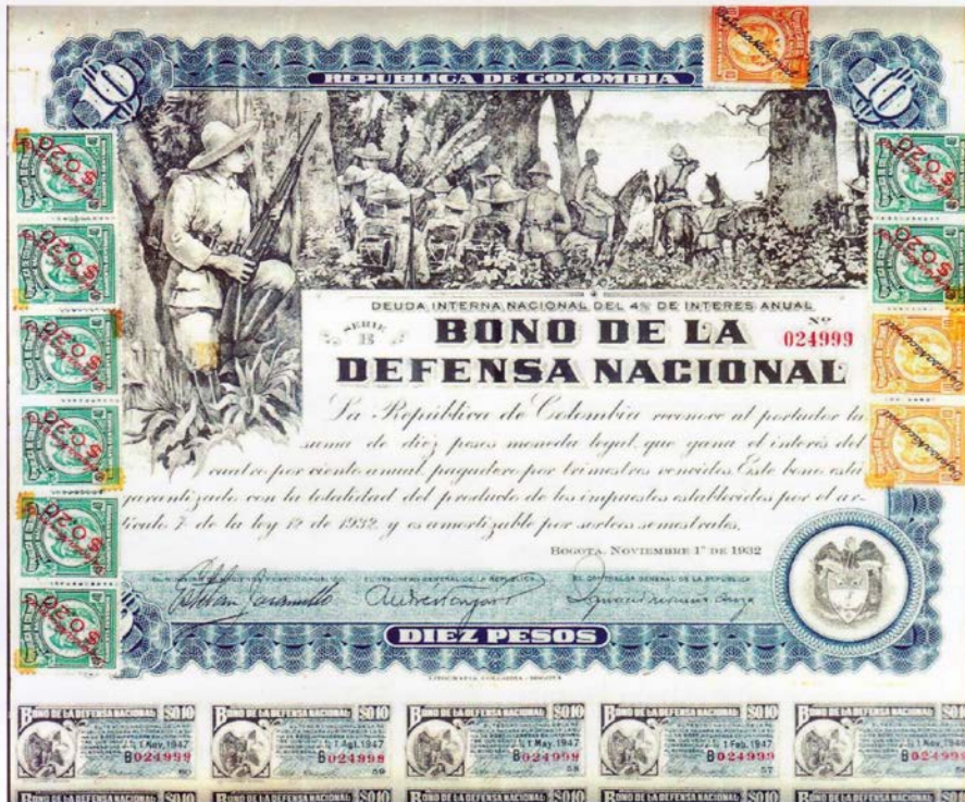
Bono de la Defensa Nacional de 10 Pesos de Colombia.

También les compartimos los cupones de cinco y diez centavos, a ser pagados en 1933 y 1934.