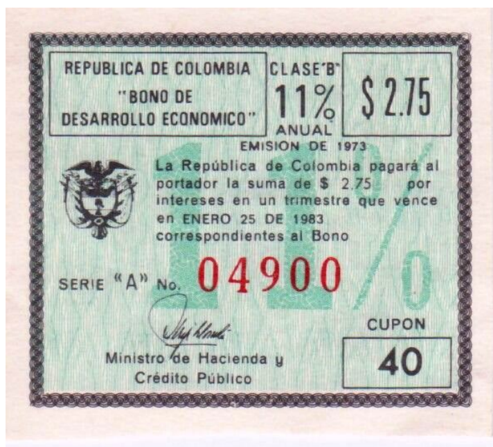
Bono de Desarrollo Económico, 1973