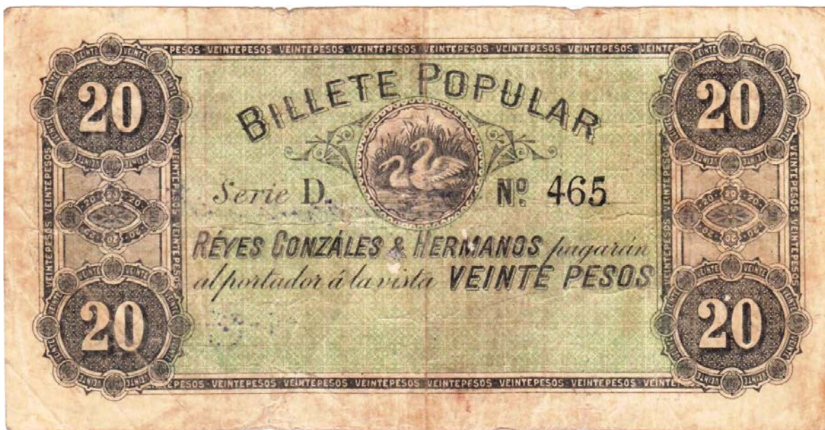
20 pesos, Billeto Popular Reyes González & Hermanos, resellado en 1900

Los de la firma particular Reyes González & Hermanos fueron resellados igualmente, por el reverso. La serie consta de los valores de uno, cinco, diez, veinte, cincuenta y cien pesos, pero no todos fueron resellados y adoptados como billetes provisionales. Son verdaderamente raros tanto los unos como los otros. Les compartimos algunos de los que conocemos resellados de esta serie.