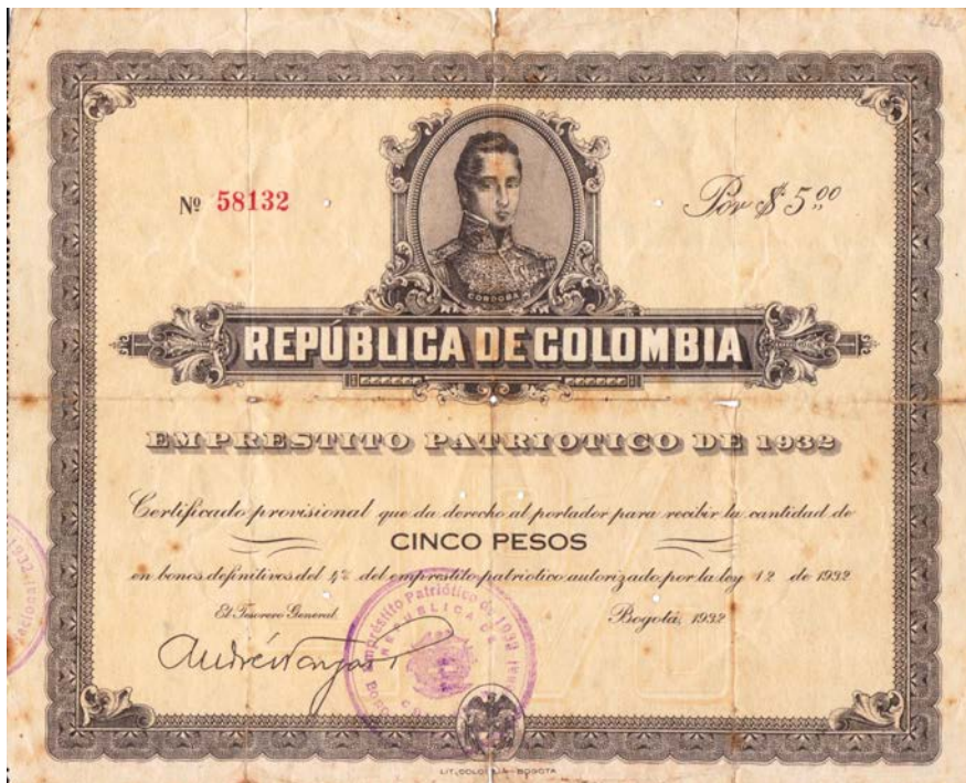
Cinco pesos, Bono provisional de la Defensa Nacional, 1932

Más adelante hubo otro conflicto en el siglo pasado, el del año 1932 con Perú, luego de que un comando del ejército de este país se tomara la ciudad de Leticia (actual capital del departamento del Amazonas). Ante tal hecho y estando las arcas de la Tesorería colombiana con muy pocos recursos, el gobierno apeló a la solidaridad de los ciudadanos quienes se despojaron de dinero y joyas para apoyar la defensa del territorio.