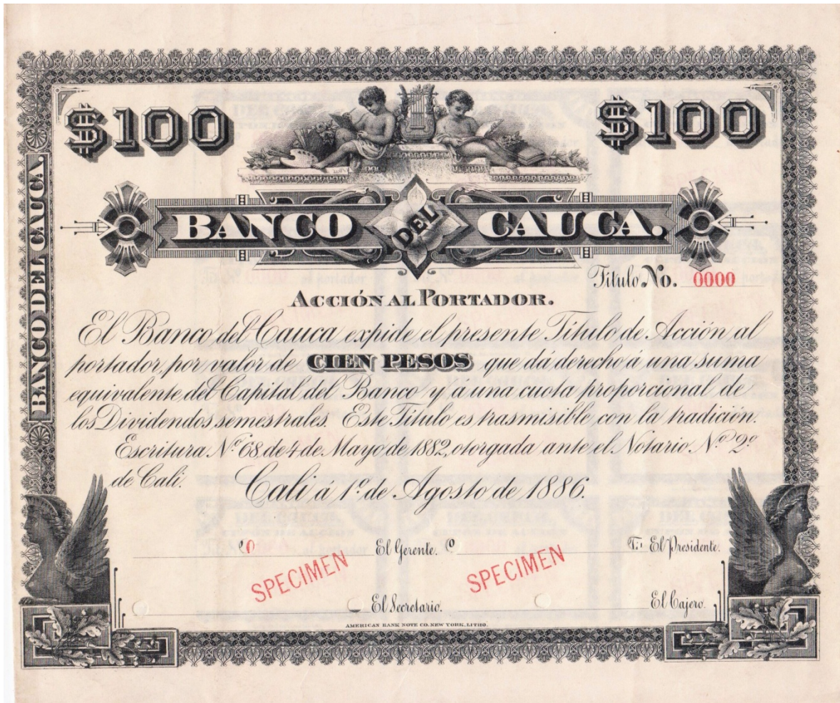
Acción por valor de 100 pesos, Banco del Cauca, 1886