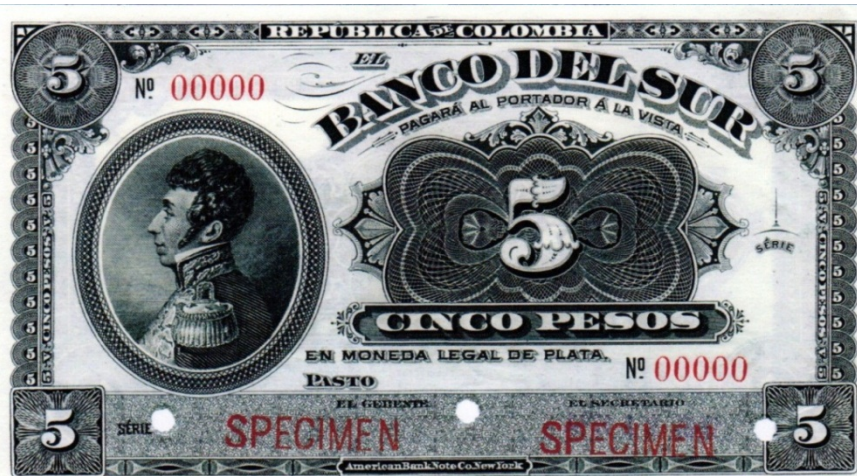
Banco del Sur, 5 pesos, specimen