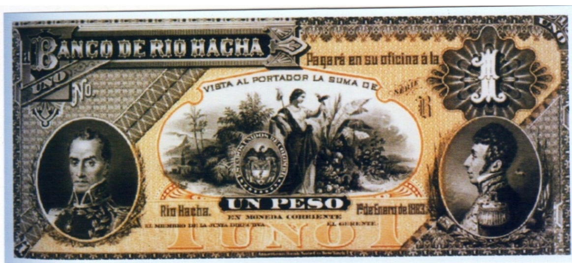
Banco de Rio Hacha, 1 peso, 1883

Los colores son negro y naranja (PPH, No. 1108). Es un hermoso ejemplar impreso por la American Bank Note Co. New York. Nariño comparte espacio con Simón Bolívar, quien está en la viñeta del lado izquierdo.