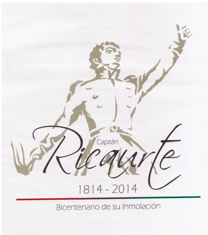
Capitán Ricaurte, Bicentenario de su inmolación 1814-2014