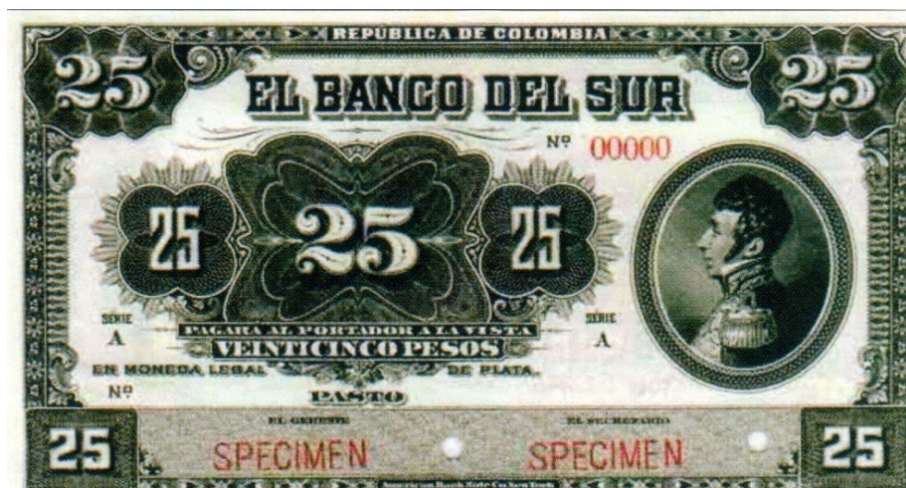
Banco del Sur, 25 pesos, specimen