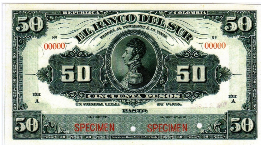
Banco del Sur, 50 pesos, specimen

De similar manera, el Banco López de Bogotá, que también tuvo existencia a comienzos del siglo pasado, aunque no emitió billetes, si se valió de las emisiones de otros bancos (entre ellos los del Banco del Ruiz de Manizales y los del Banco del Sur) para resellarlos y ponerlos a circulación como cédulas hipotecarias y bonos bancarios.