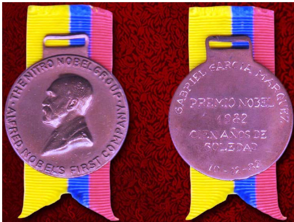
Medalla conmemorativa Premio Nobel de Literatura Gabriel García Márquez, 1982

colección con una medalla grabada para recordar el Premio Nobel de Literatura recibido por Gabriel García Márquez en 1982. Por el anverso, está acuñada la imagen de Alfred Nobel y por el reverso, grabada manualmente, se hace referencia al premio recibido por el escritor colombiano.