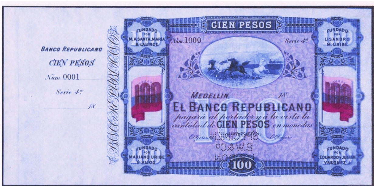
Banco Republicano de Medellín, 100 pesos, specimen

encontrarlos en buen estado. Por lo tanto, celebramos la aparición de esta pieza así sea como espécimen, y nos congratulamos con su nuevo dueño.