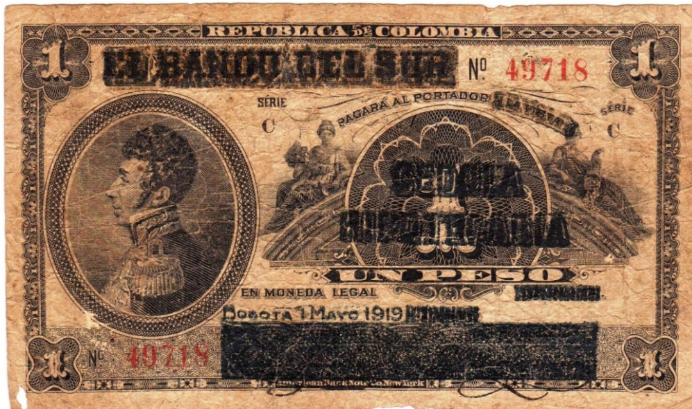
Banco de López, Cédula Hipotecaria, 1919 (resello)