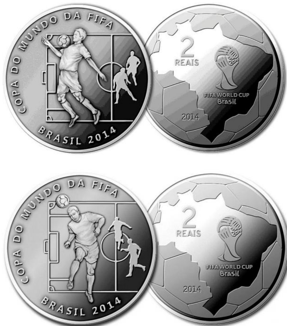
Serie de monedas conmemorativas del Mundial Brasil 2014- Banco Central del Brasil