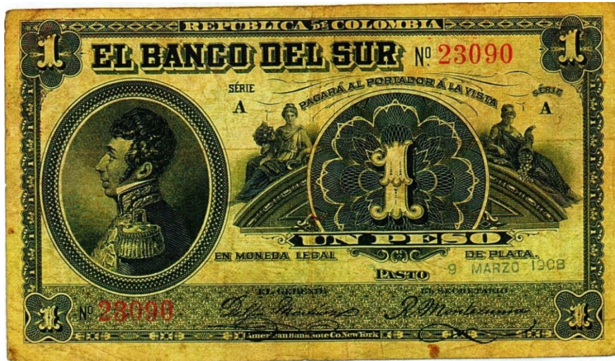
Banco del Sur, 1 peso, 1908