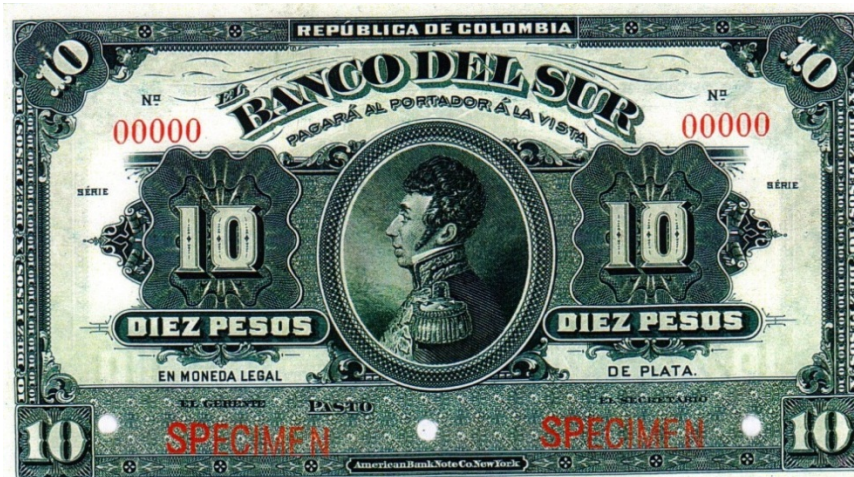
Banco del Sur, 10 pesos, specimen