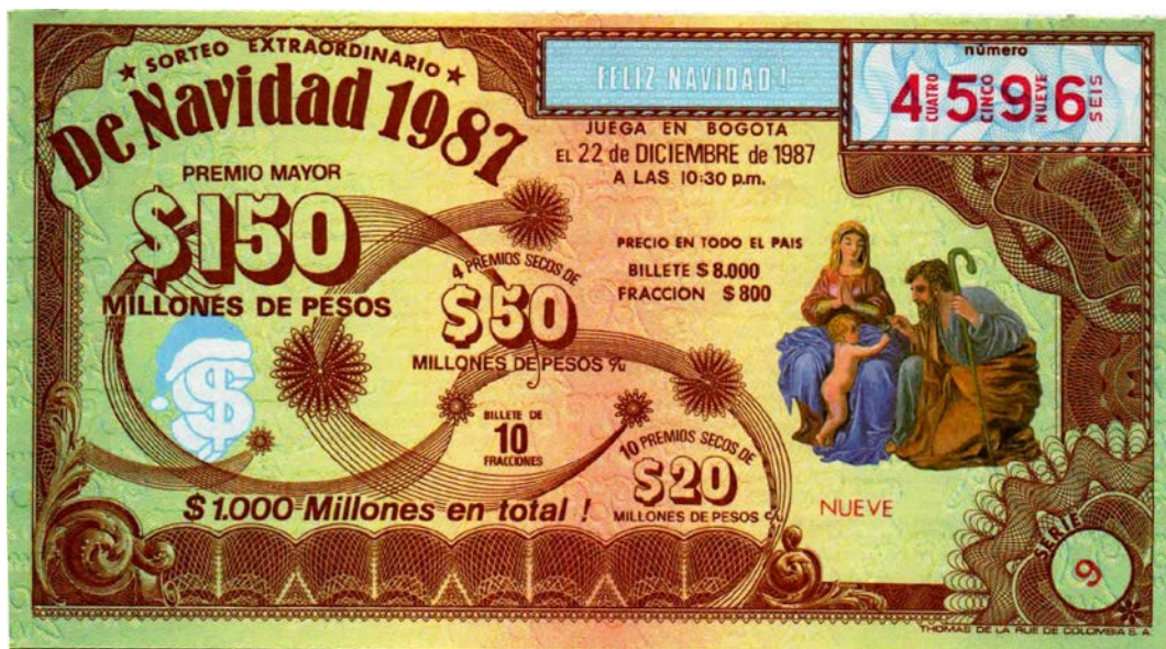
Fracción Lotería Sorteo Extraordinario de Navidad, 1987

Avanzando en el tiempo, llegamos al año de 1987 con el Sorteo Extraordinario de Navidad, cuyo premio mayor era de $150.000.000. el billete costaba $8.000 y la fracción $800,00. Serie 9.