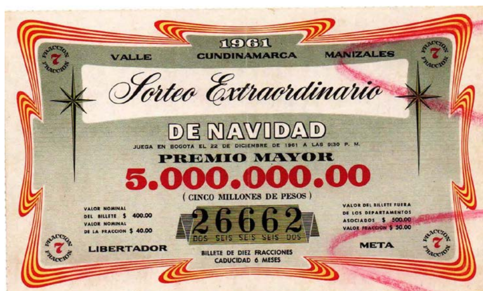
Fracción Lotería Sorteo Extraordinario de Navidad, 1961

En 1961 el Sorteo Extraordinario de Navidad estuvo asociado con las loterías del Valle, Cundinamarca, Manizales, Libertador y Meta. El premio mayor era de $5.000.000. El valor nominal del billete era de $400,00 y el de la fracción $40,00. Fuera de los departamentos asociados, el billete y la fracción costaban $500,00 y $50,00, respectivamente. Jugó el 22 de diciembre en Bogotá, a las 9:30 p.m.