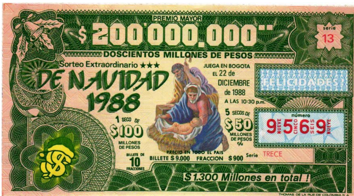
Fracción Lotería Sorteo Extraordinario de Navidad, 1988

En 1988, el premio mayor alcanzó la suma de $200.000.000. El billete tuvo un valor de $9.000 y la fracción de $900,00. Jugaba con serie. El plan de premios adicional estaba en el reverso.