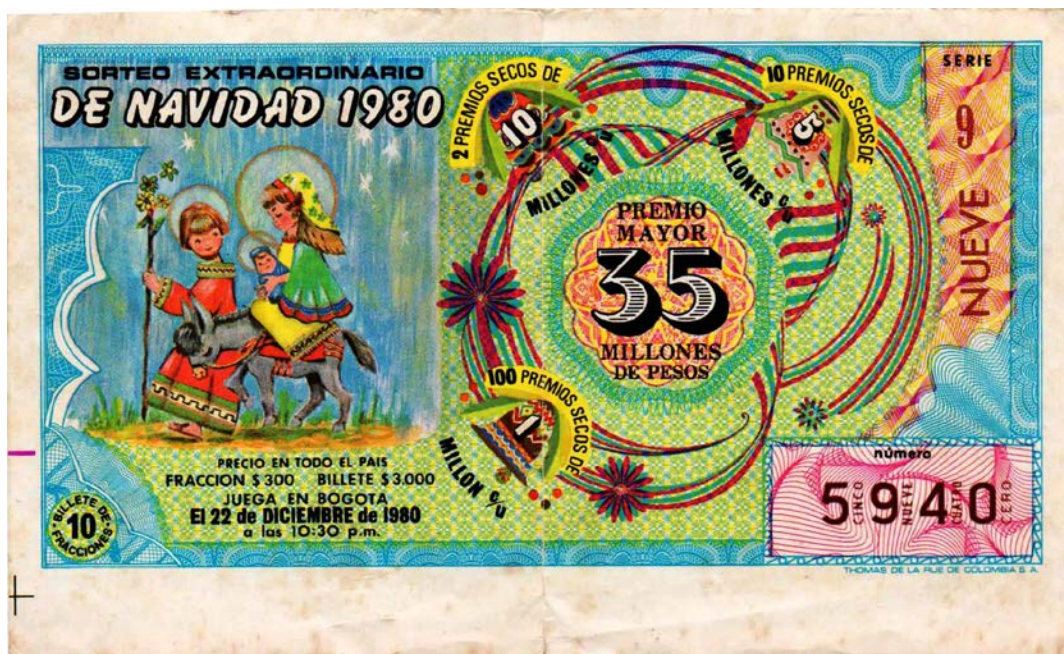
Fracción Lotería Sorteo Extraordinario de Navidad, 1980

El Sorteo Extraordinario de Navidad de 1980 tuvo un premio mayor de de $35.000.000. El billete costaba en todo el país, $3.000 y la fracción $300,00. Serie 9. Jugaba en Bogotá el 22 de diciembre a las 10:30 p.m.