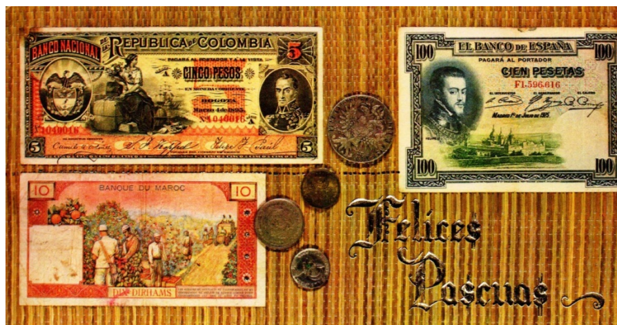
Tarjeta navideña de 1975

En el año de 1975, una de las varias tarjetas que salieron al mercado colombiano con motivos numismáticos, es la que enseguida les presentamos; ilustrada bellamente con algunas monedas más dos billetes extranjeros (Marruecos y España) y uno de Colombia (cinco pesos del Banco Nacional de marzo 4 de 1893).