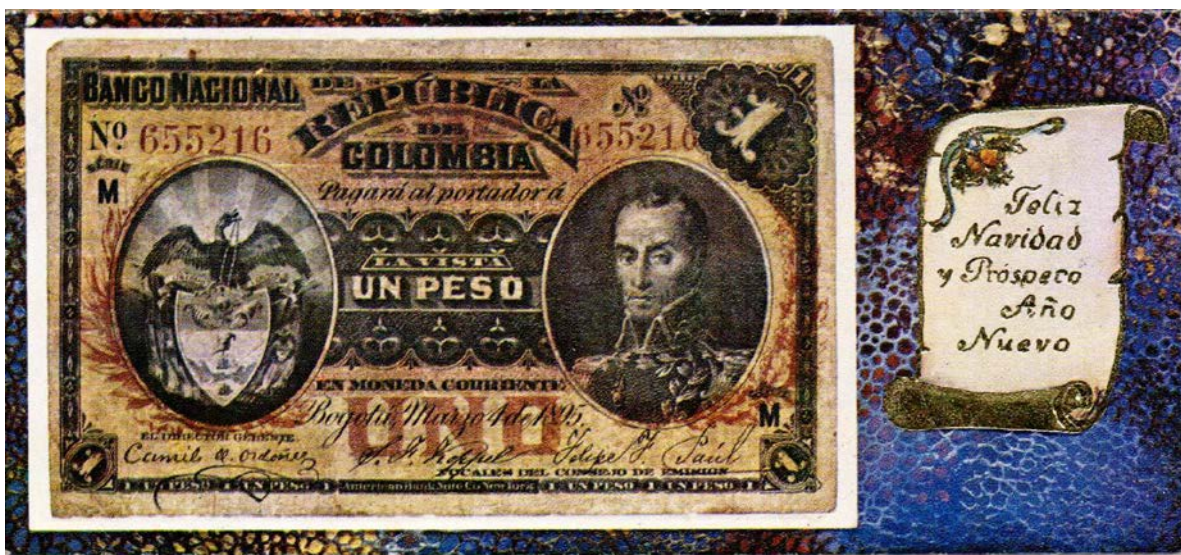
Tarjeta navideña de 1973-74

También encontramos del año 1973, una tarjeta que nos muestra una reproducción del billete de un peso de marzo 4 de 1935 (el llamado "Toche") del Banco Nacional de la República de Colombia.