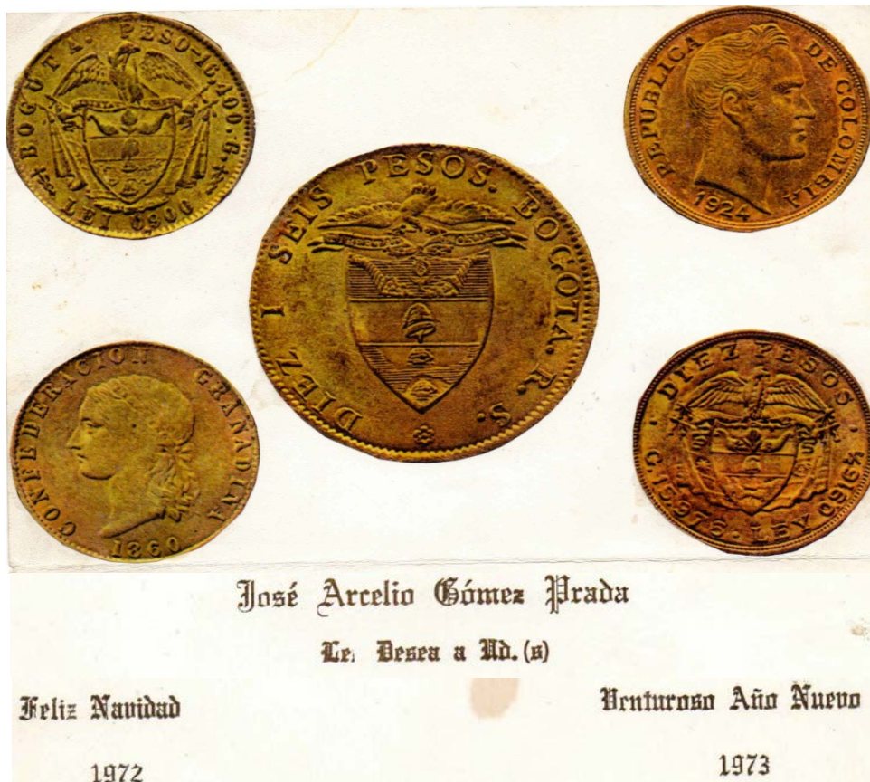
Tarjeta navideña de 1972

También encontramos del año 1973, una tarjeta que nos muestra una reproducción del billete de un peso de marzo 4 de 1935 (el llamado "Toche") del Banco Nacional de la República de Colombia.