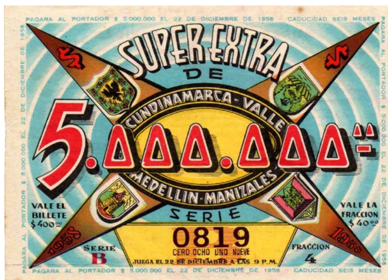
Fracción Lotería Super Extra, 1958

La tercera parte del artículo dedicado a las loterías antiguas de Colombia, lo dedicamos a reseñar el Sorteo Super Extra de Navidad, el cual existe desde 1958. Para tal fin, hacemos una selección de diferentes sorteos. El primer sorteo tuvo lugar el 22 de diciembre de 1958, con las loterías de Cundinamarca, Valle, Medellín y Manizales. El premio mayor era de $5.000.000. El billete completo tenía un costo de $400,00 y la fracción, costaba $40,00. Jugaba con series y el sorteo se realizó en Bogotá a las 9 p.m. El plan de premios adicional está estipulado en el reverso.