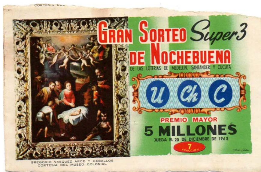
Fracción Gran Sorteo de Nochebuena, 1963

En el año de 1963, también jugó el Gran Sorteo de Nochebuena, con un similar premio de $5.000.000, en asocio con las loterías de Medellín, Santander y Cúcuta. Se sorteó el 20 de diciembre de 1963. Una novedad de este sorteo es que en vez de números, tenía letras. Está ilustrado con la famosa pintura sobre la natividad, de Gregorio Vásquez de Arce y Ceballos, el cual se encuentra en el Museo Nacional de Colombia.