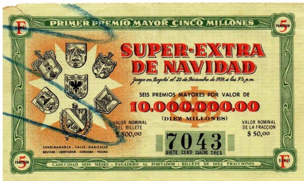
Fracción Lotería Super-Extra de Navidad, 1959

El segundo sorteo del Super Extra de Navidad se realizó en 1959. El premio mayor fue de $10.000.000, en asociación con loterías de Cundinamarca, Valle, Manizales, Bolívar, Libertador, Córdoba y Tolima. Jugaba el 22 de diciembre de 1959 a las 9 p.m. en Bogotá. El billete completo costaba $500,00 y la fracción $50,00.