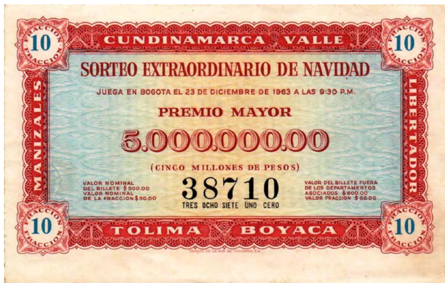
Fracción Lotería Sorteo Extraordinario de Navidad, 1963

Para el año de 1963, el Sorteo Extraordinario de Navidad estaba asociado con las loterías de Cundinamarca, Valle, Manizales, Libertador, Tolima y Boyacá. El premio mayor era de $5.000.000. Valor nominal del billete: $500,00 y de la fracción: $50,00. Jugó en Bogotá el 23 de diciembre de 1963 a las 9 p.m.