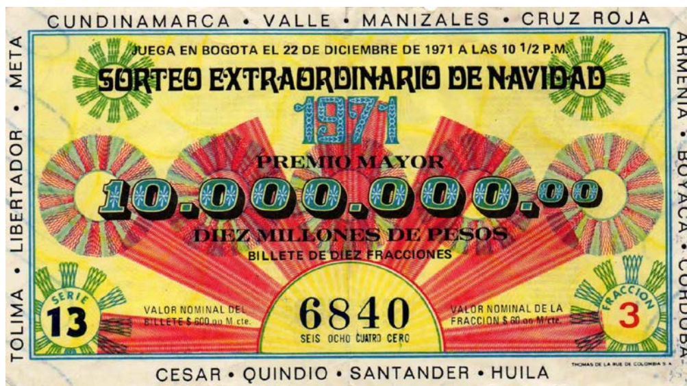
Fracción Lotería Sorteo Extraordinario de Navidad, 1971

En el sorteo Extraordinario de Navidad de 1971, las loterías asociadas fueron: Cundinamarca, Valle, Manizales, Cruz Roja, Tolima, Libertador, Meta, Armenia, Boyacá, Córdoba, Cesar, Quindío, Santander y Huila. El premio mayor fue de $10.000.000. Valor nominal del billete: $600,00, de la lotería: $60,00. Jugaba con serie en Bogotá el 22 de diciembre a las 10:30 p.m.