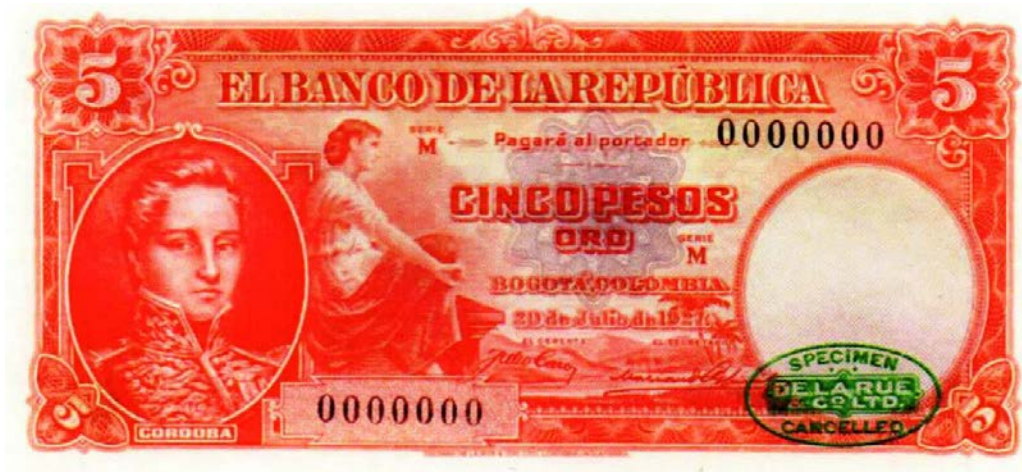
Banco de la República, 5 pesos, 1927 (Prueba)