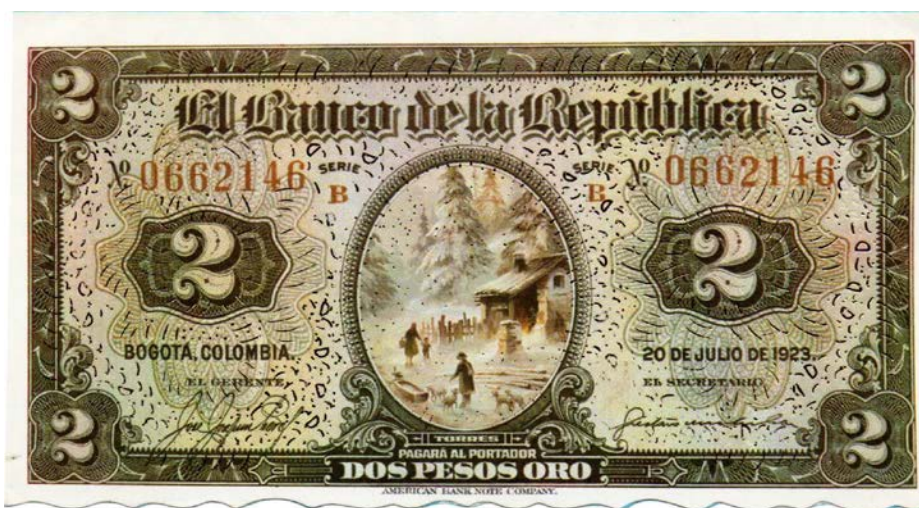
Tarjeta navideña de 1990-91

En el año de 1990, los diseñadores de tarjetas navideñas escogieron, entre otros motivos numismáticos, el billete del Banco de la República de dos pesos del 20 de julio de 1923, el cual fue intervenido minuciosamente para darle un aire navideño y remontarnos a otras latitudes.