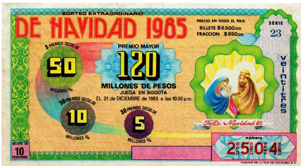
Fracción Lotería Sorteo Extraordinario de Navidad, 1985

A medida que ha avanzado el tiempo y por cuestiones de devaluación, el premio mayor del Sorteo extraordinario de Navidad ha aumentado de manera notable; para 1985, el premio era de $120.000.000. Los valores para todo el país fueron: Billete $6.500 y fracción $650,00. Serie 23.