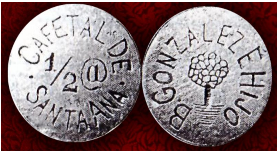
Ficha por 1/2 arroba, Cafetal de Santa Ana

Cafetal de Santa Ana , de B. González e Hijo, posiblemente de la región de Viotá (Cundinamarca). Anverso: Cafetal de Santa Ana 1/2 @. Reverso: B. González e Hijo. Árbol. Canto liso, cuproníquel. Incusa. También hubo valores de 1 y 2 arrobas.