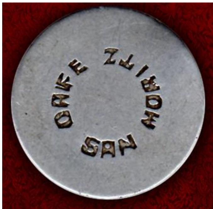
Ficha del Café San Moritz. Bogotá

Es una ficha en aluminio que tiene alrededor el nombre del lugar. Por el reverso tiene la cifra "50".