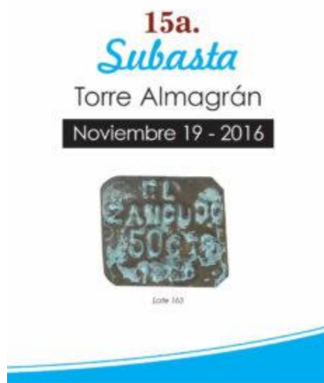
Carátula de la 15ª subasta Torre Almagrán