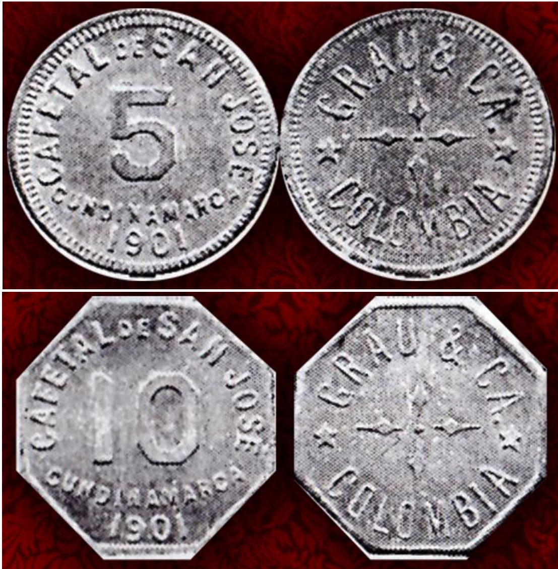
Fichas por valores de 5 y 10, Cafetal de San José

Hacienda de Montebello. Esta gran hacienda estuvo situada en Betulia (Santander) y fue fundada por el alemán residenciado en Santander desde muy joven, Geo Von Lengerke. Esta hacienda cafetera junto con la del "Florito", fueron las estancias cafeteras más grandes de la región oriental del país. El señor Lengerke construyó una red de caminos en la región y llegó hasta el río Magdalena para de ahí llevar el café en embarcaciones hasta la Costa Atlántica, desde donde se exportaría a Europa junto con la quina, el otro gran producto de exportación colombiana hacia el Viejo Continente en esos momentos.