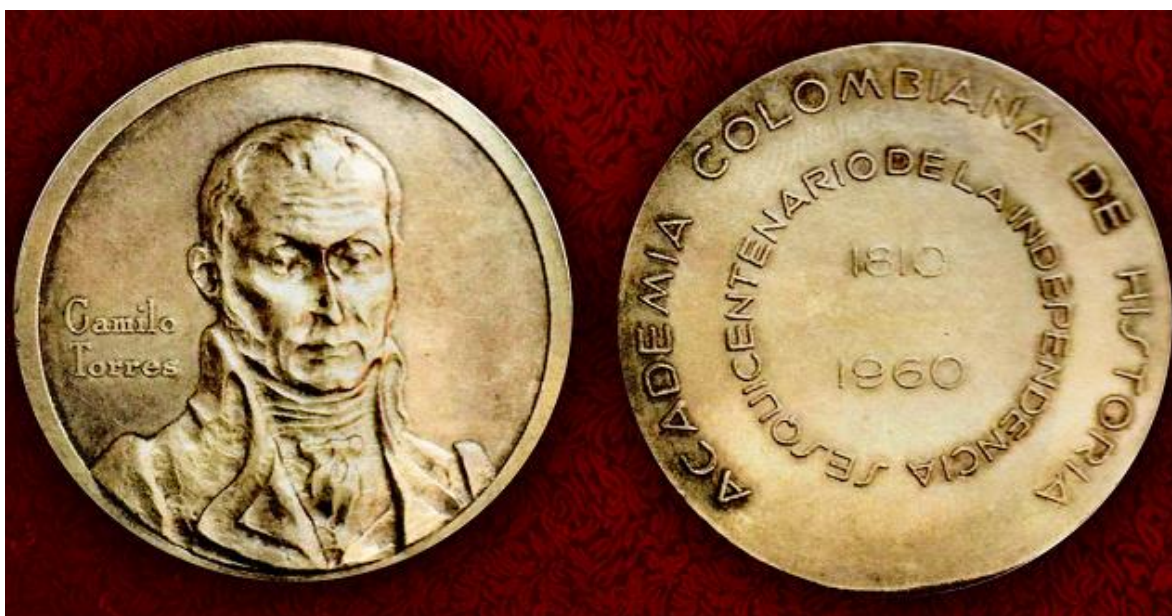
Medalla de la Academia Colombiana de Historia, Camilo Torres, 1960