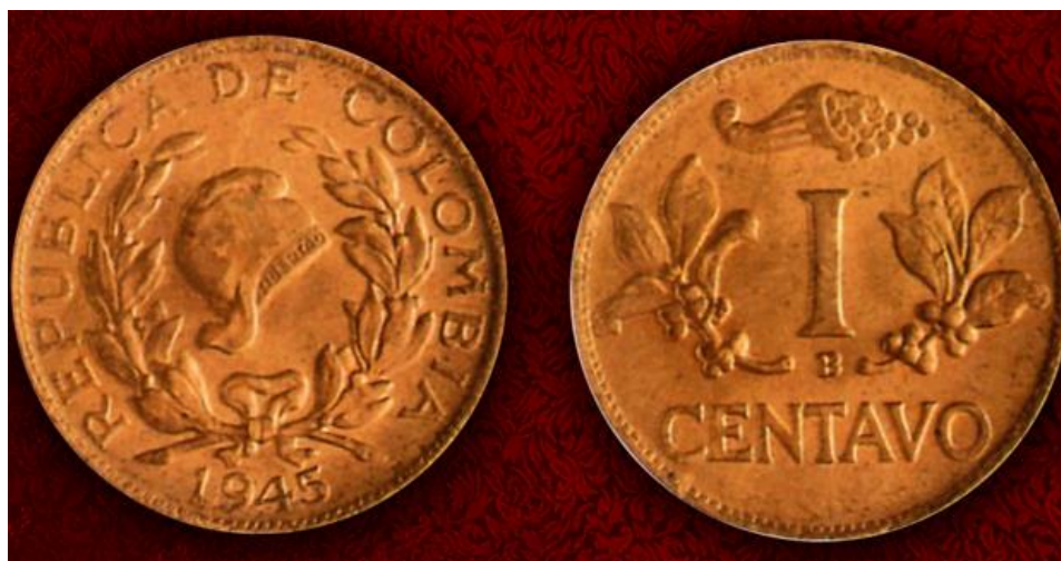
1 centavo, Banco de la República, 1945

Nota: Es importante tener en cuenta que el valor de 2 centavos de este tipo no salió a circulación. De estas sólo se conocen pruebas.