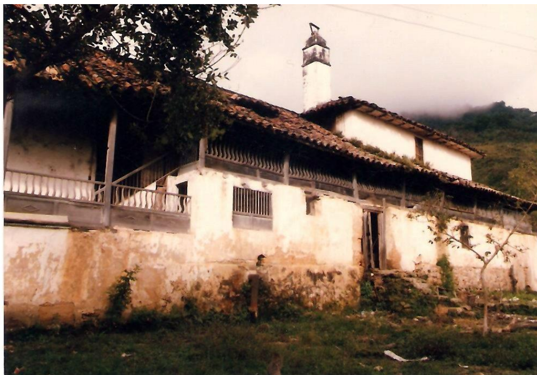
Vista posterior de la hacienda El Florito, de Geo Von Lengerke. Betulia - Santander