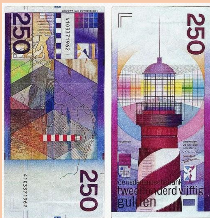
250 florines neerlandeses, 1985

Aunque son varios los billetes que han tenido derroche de colores en su diseño, se considera que el que tiene una gama más intensa de colores es el de 250 florines neerlandeses, emitido en 1985. Fue diseñado por Ootje Oxenaar y tiene como curiosidad adicional el hecho de que se encuentran escondidos los nombres de tres mujeres importantes en la vida del diseñador: su abuela, su mujer y su amante.