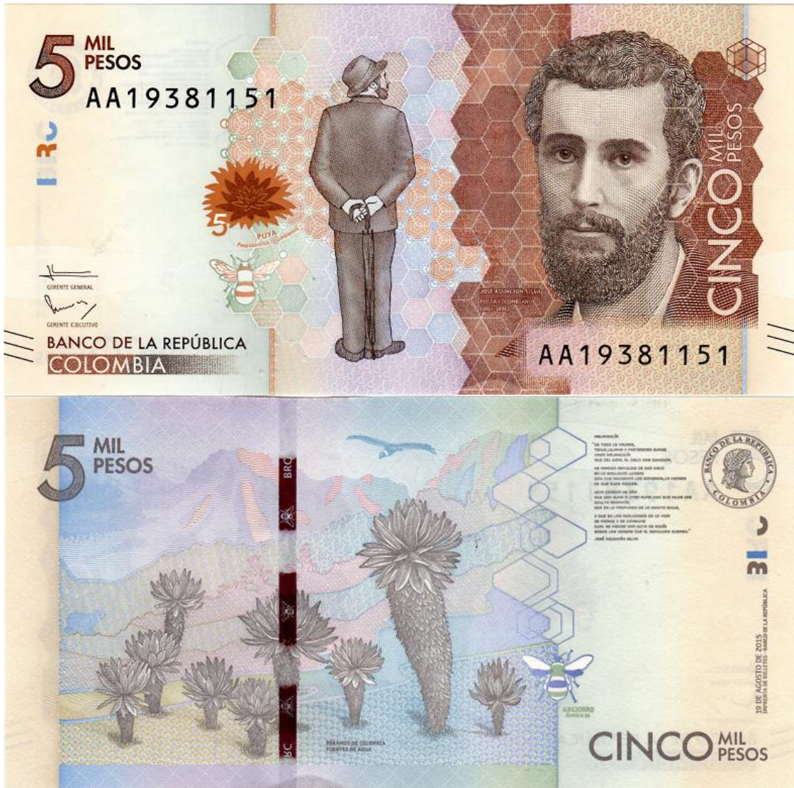
Nuevo billete colombiano de cinco mil pesos, 2016 (anverso y reverso)

cultura, la ciencia y la política del país, y refuerza el reconocimiento del papel protagónico de la mujer en la sociedad colombiana.