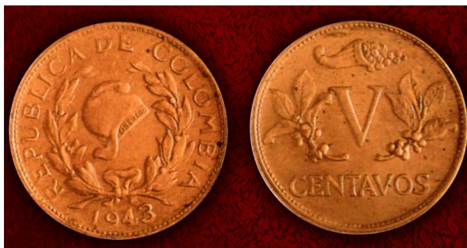
5 centavos, Banco de la República, 1943