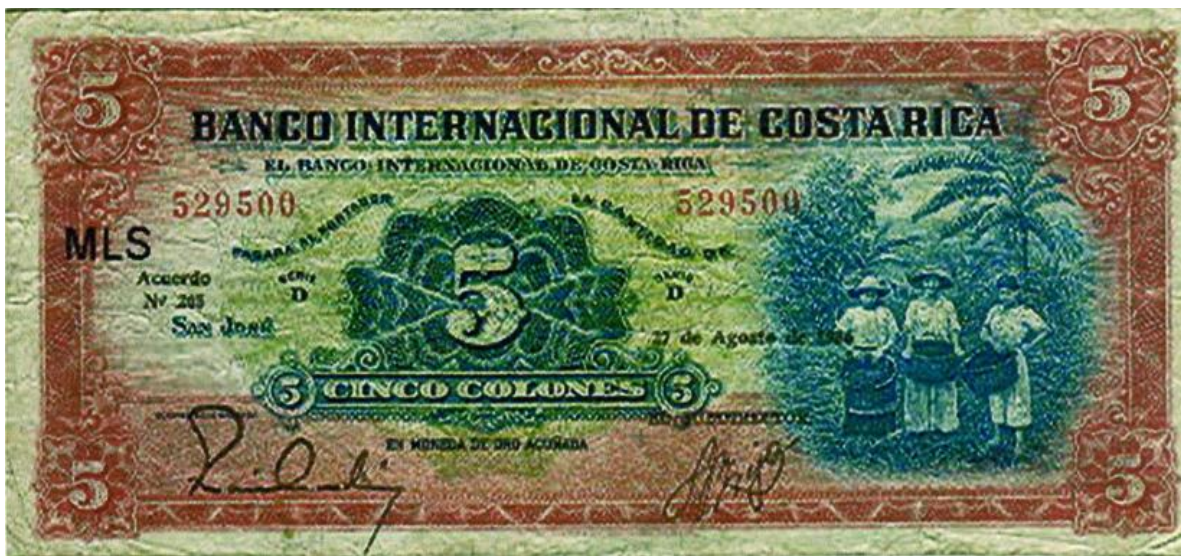
Banco Internacional de Costa Rica. Cinco colones, 1926

Cinco colones. El Banco Internacional de Costa Rica en el valor de cinco colones (Pick.180), tiene al lado derecho del anverso, una viñeta en la que aparecen tres mujeres recolectoras de café con el fondo de una plantación en la que también se destaca el plátano, especie que usualmente se intercala en los plantíos de café.