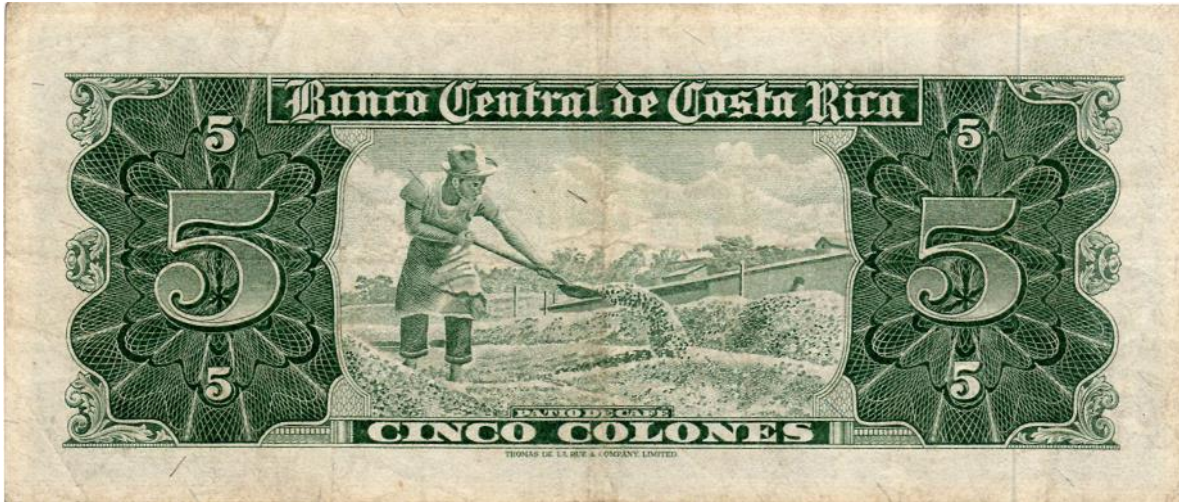
Banco central de Costa Rica. Cinco colones, 1964

Cinco colones. El Banco Central de Costa Rica en su emisión del 9 de septiembre de 1964 (hay varias fechas) tiene por el reverso una imagen en la que aparece un obrero en la labor de secado del café. Usualmente, esta actividad se realiza al aire libre en patios o secaderos hasta que el café llegue al punto de trilla.