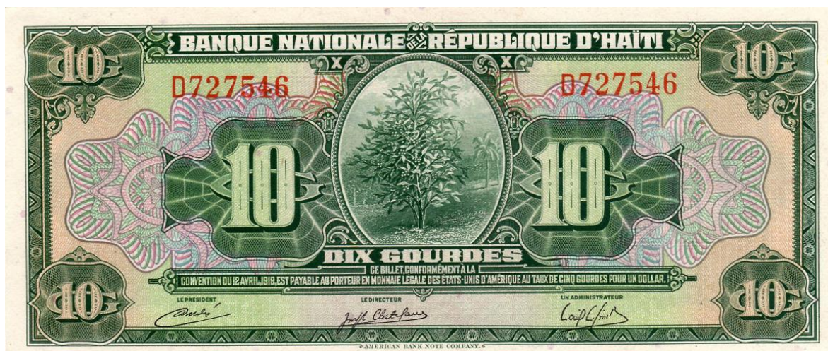
Banco Nacional de la República de Haití, cinco gourdes

Diez gourdes. También en el billete de 10 gourdes (Pick, 181), el Banco Nacional de la República de Haití le rinde homenaje al café: en esta ocasión, con una viñeta en la parte central del anverso, en la que se destaca un árbol de café. De esta emisión hay varias fechas.