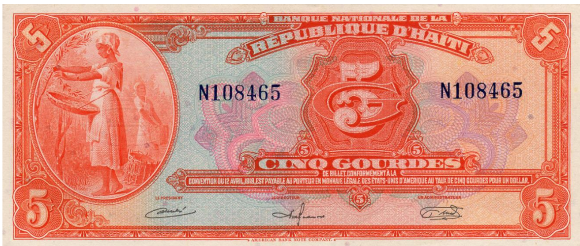
Banco Nacional de la República de Haití, cinco gourdes

Cinco gourdes. Banco Nacional de la República de Haití, cinco gourdes (Pick.187). Tiene varias fechas. En el anverso, al lado izquierdo, se pueden apreciar dos mujeres que se dedican a la labor de recolección de café.