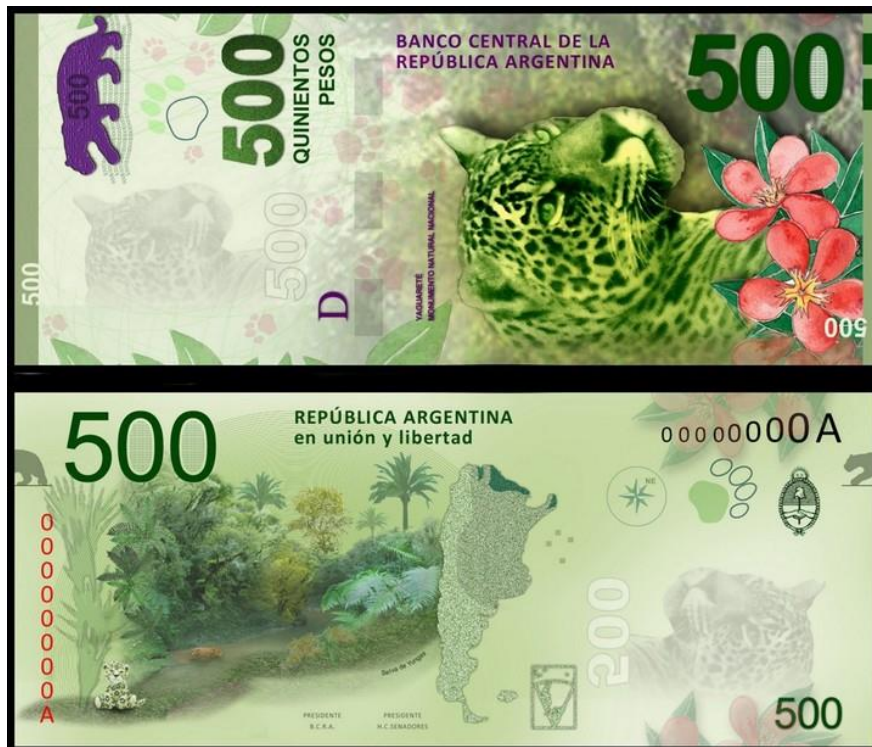
500 pesos argentinos (2016)