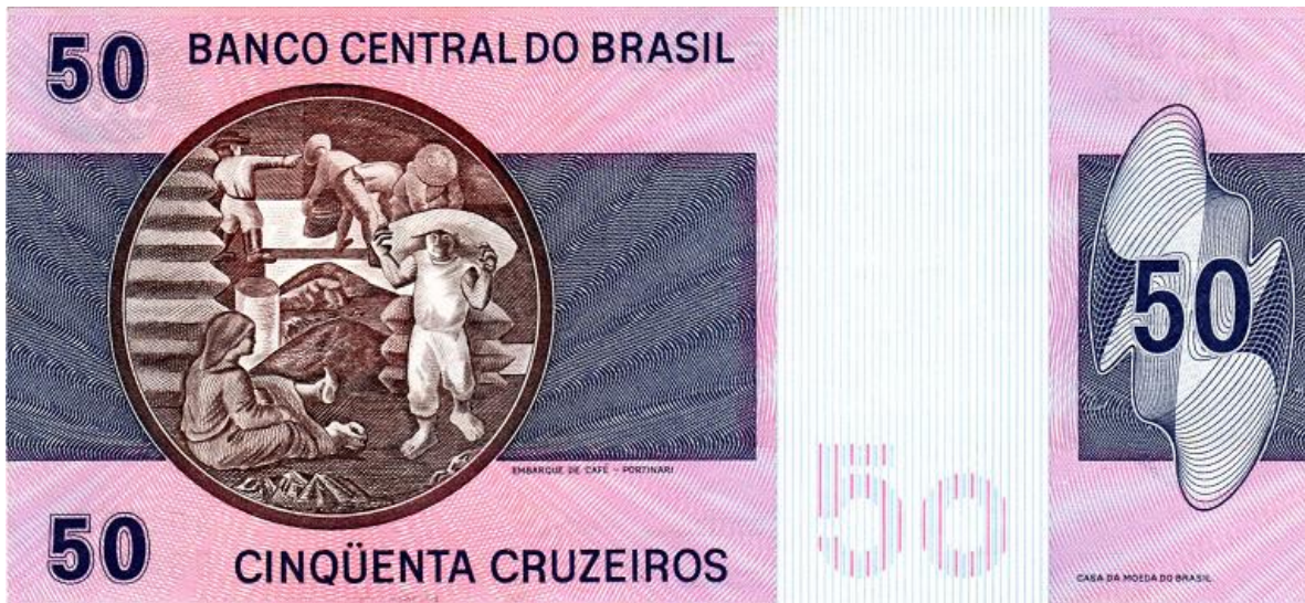
Banco Central Do Brasil, cincuenta cruzeiros

Llegando a Centroamérica nos detenemos en Costa Rica, otro de los países de alta tradición cafetera. En este país, tanto bancos privados como el oficial, han realizado emisiones en las que se destaca su economía cafetera.