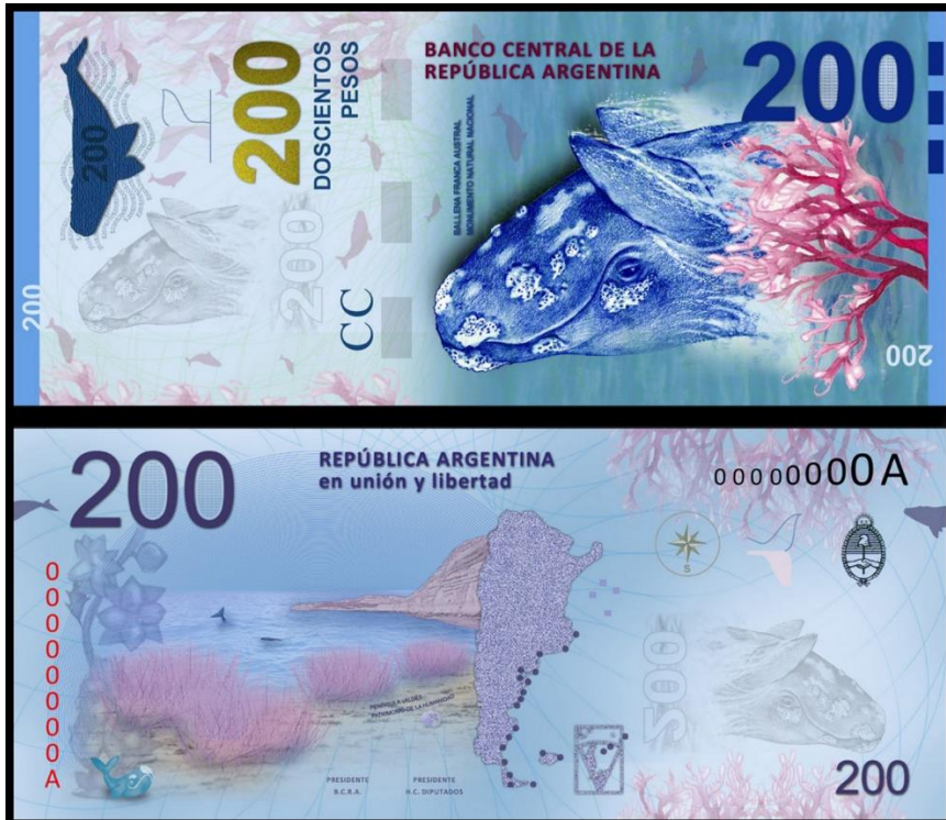
200 pesos argentinos (2016)

moneda papel en el billete de $500 y fue seguido por la ballena franca en el de $200.