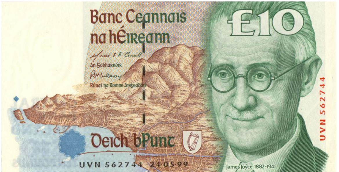
Billete de 10 libras de Irlanda, 1999 (James Joyce)