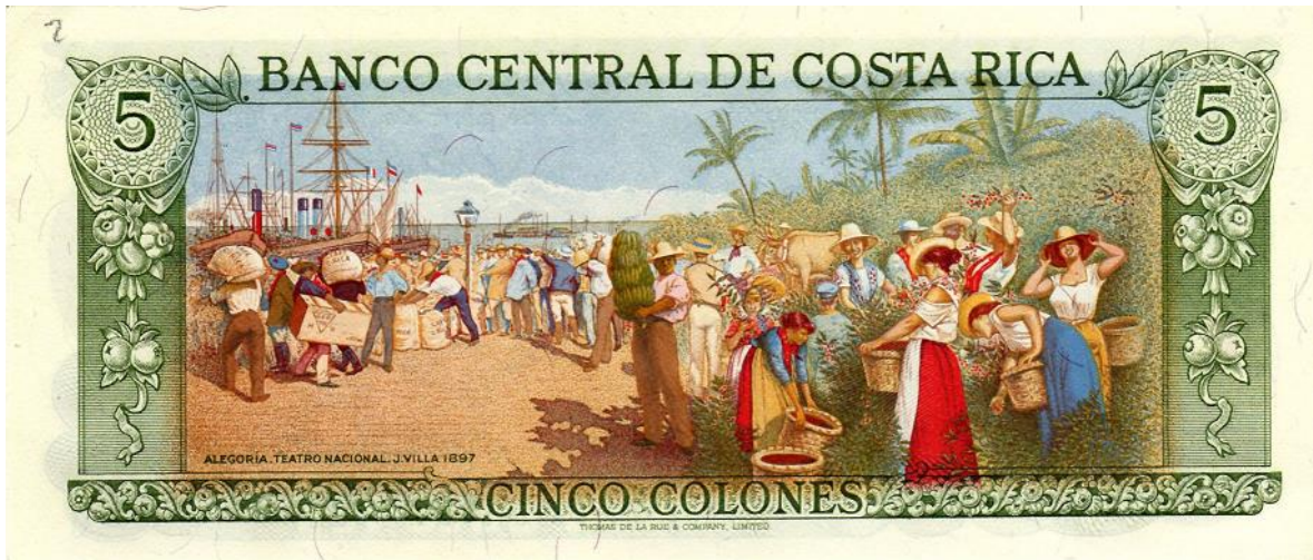
Banco central de Costa Rica. Cinco colones, 1990 (reverso)

También en las islas del Caribe, el café ha sido cultivado con tesón y mucho cuidado. En la República de Haití (la que comparte su territorio con la República Dominicana, en la isla bautizada por Cristóbal Colón como "La Española", y a la que según algunos historiadores, fue donde por primera vez llegó el café al "nuevo mundo") varias de las emisiones de billetes han sido ilustradas con el tema del café, uno de los principales productos de consumo y exportación en este país.