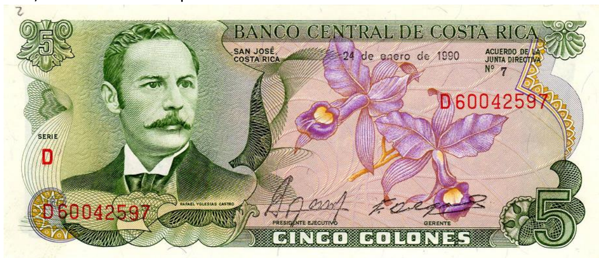
Banco central de Costa Rica. Cinco colones, 1990 (anverso)

Cinco colones. El Banco Central de Costa Rica también emitió un billete de cinco colones, en el que el reverso está ilustrado con una pintura que exalta la producción industrial del café. Esta alegoría se encuentra en el Teatro Nacional como telón de fondo, cuyo autor es J. Villa, 1897. Sin duda, es uno de los billetes más hermosos emitidos por este banco. Del mismo, existen varias fechas (Pick.239). El anverso (que también les compartimos) con imágenes de la rica flora costarricense, en este caso, con la hermosa orquídea.