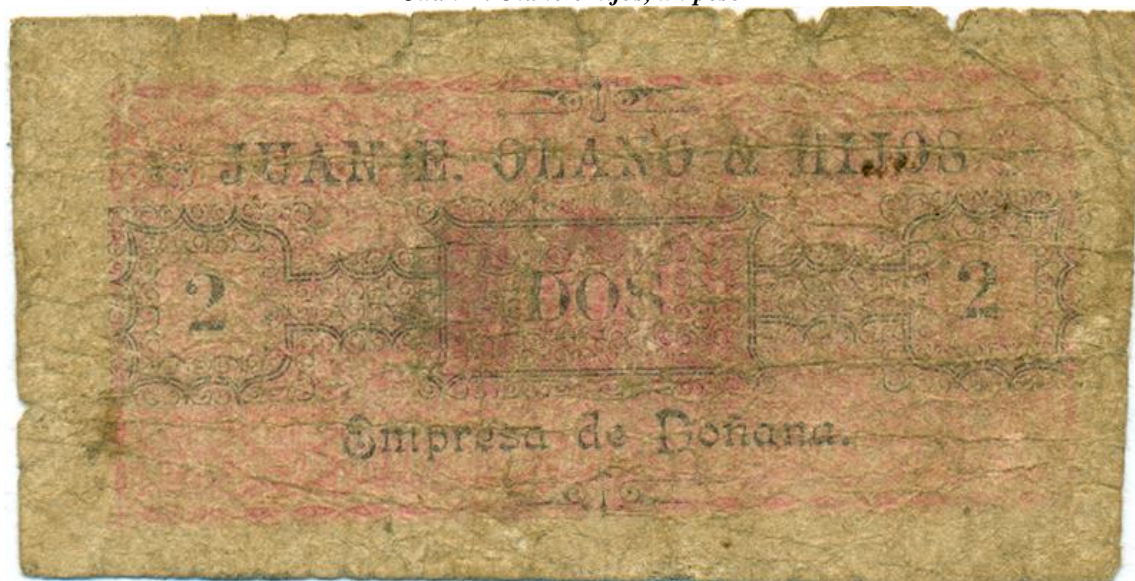
Juan E. Olano e hijos, dos pesos (anverso)