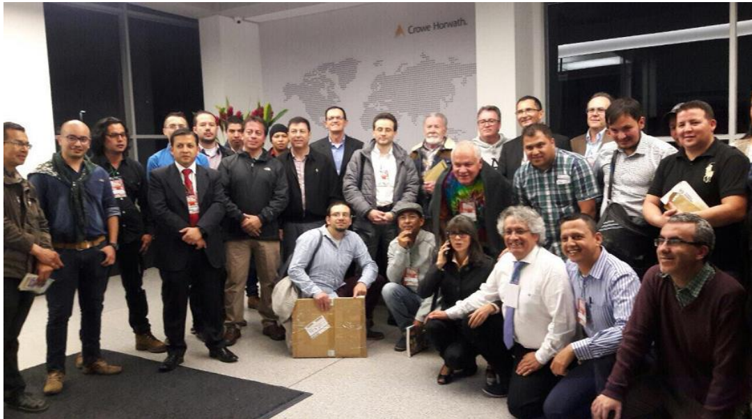
Algunos de los asistentes al evento

Le deseamos a esta nueva organización un exitoso recorrido y esperamos que siga promoviendo el coleccionismo como un arte que fortalece el patrimonio cultural de nuestra capital y departamento.