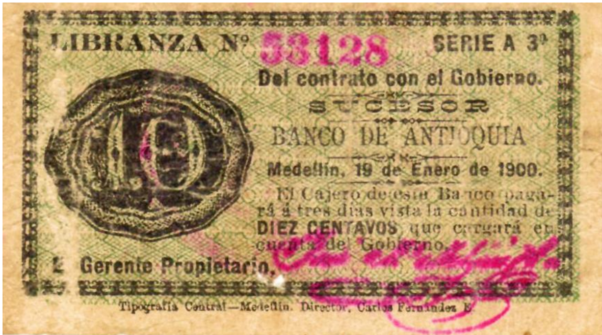
Banco de Antioquia, Libranza por 10 centavos, 1900