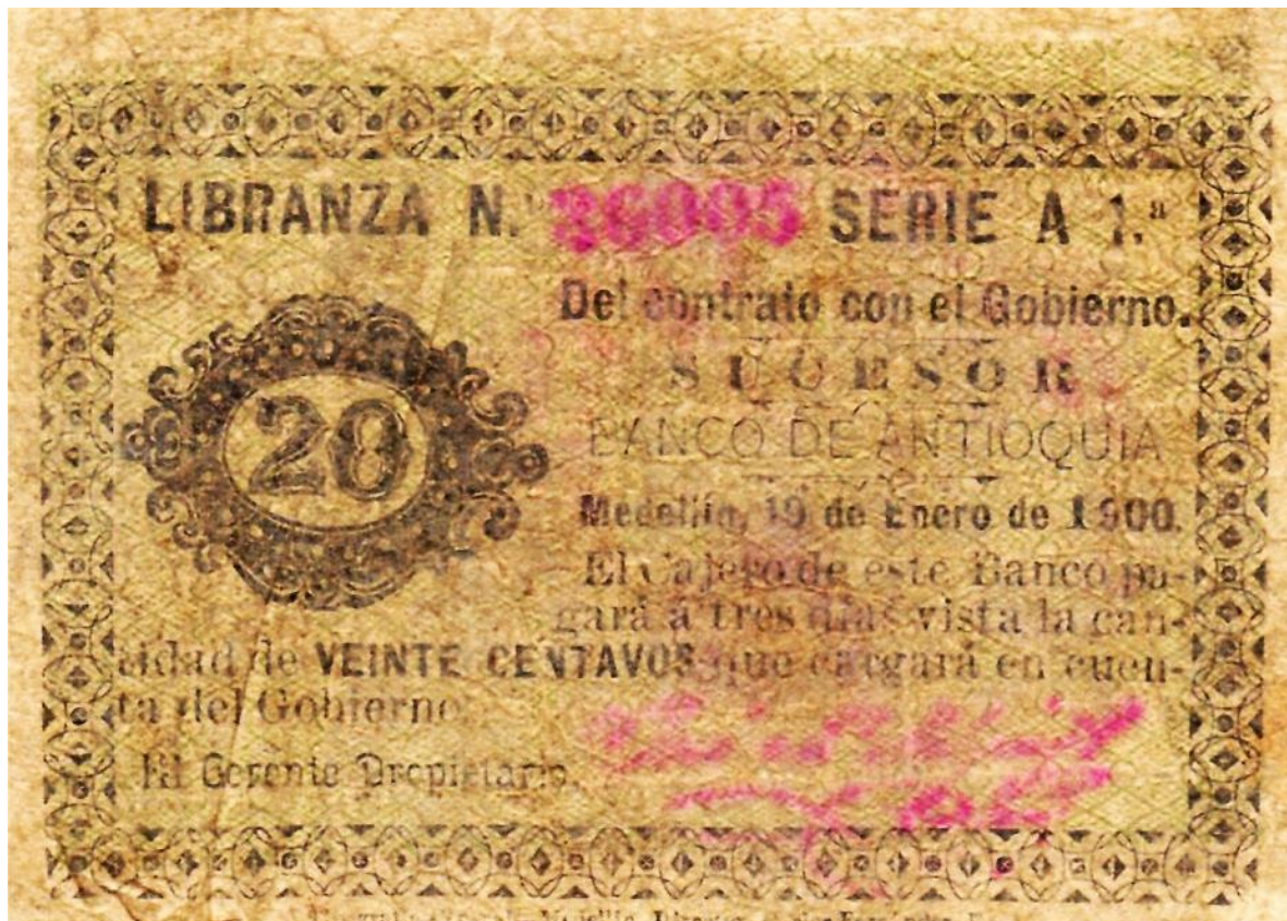
Banco de Antioquia, Libranza por 20 centavos, 1900