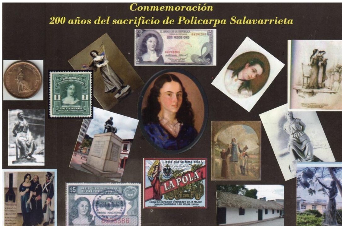
Postal conmemorativa de los 200 años del sacrificio de Policarpa Salavarrieta