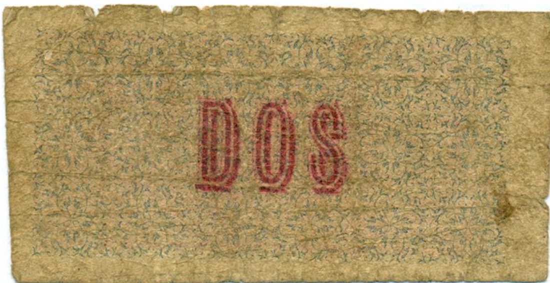
Juan E. Olano e hijos, dos pesos (reverso)