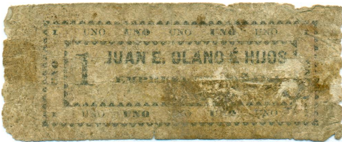
Juan E. Olano e hijos, un peso

Esta importante casa comercial emitió dos sencillos billetes por valor de uno y dos pesos. La impresión se hizo en papel común, de baja calidad, lo que no ha permitido una buena conservación, como podrán apreciarlo.