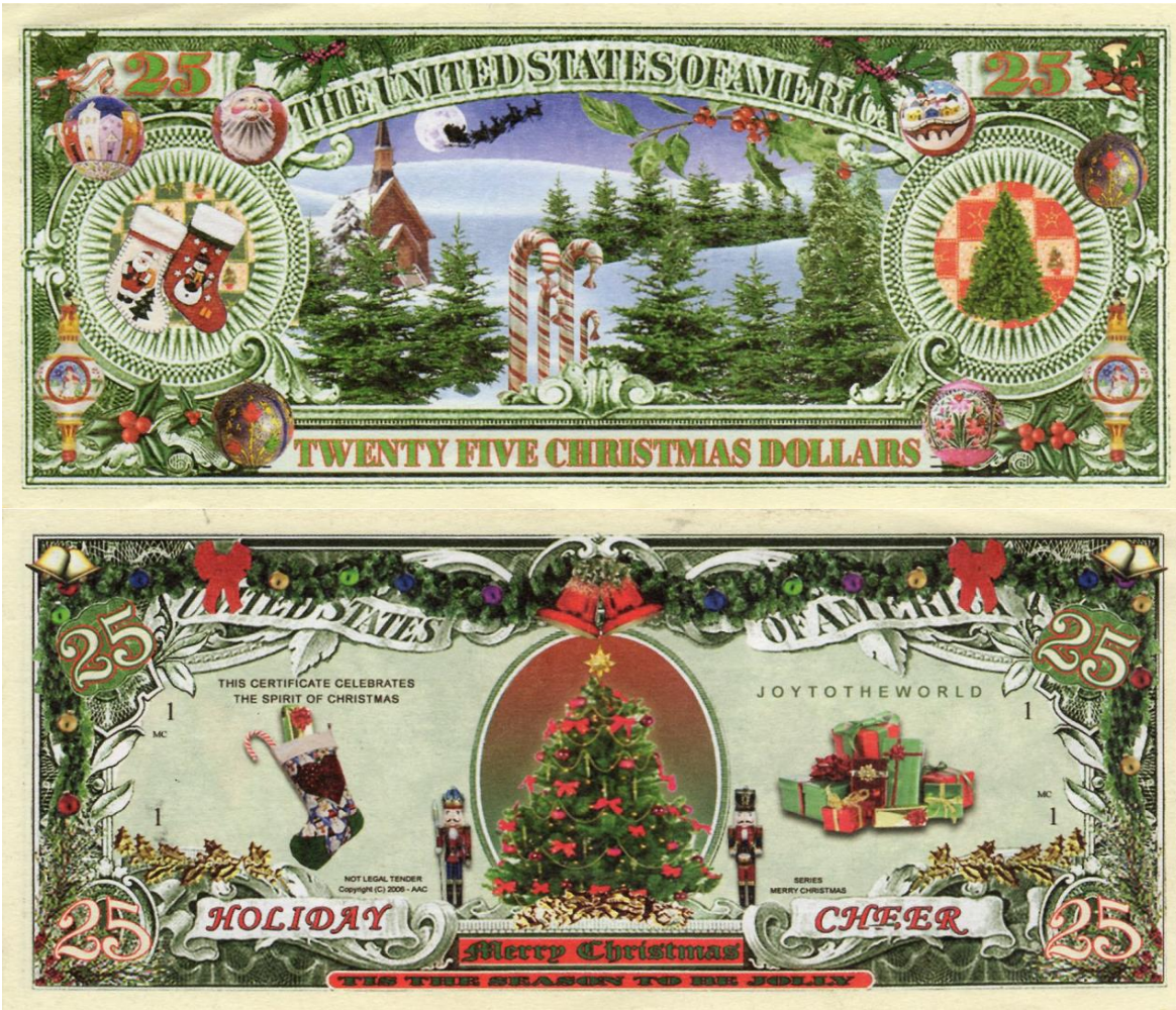
Billete fantasía de Estados Unidos con motivo navideño, 25 dólares navideños (anverso y reverso)