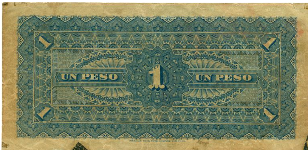
Vicente B. Villa, un peso, 1888 (reverso)

Cinco pesos: fueron fechados el 1 de enero de 1895 y corresponden a la serie B.