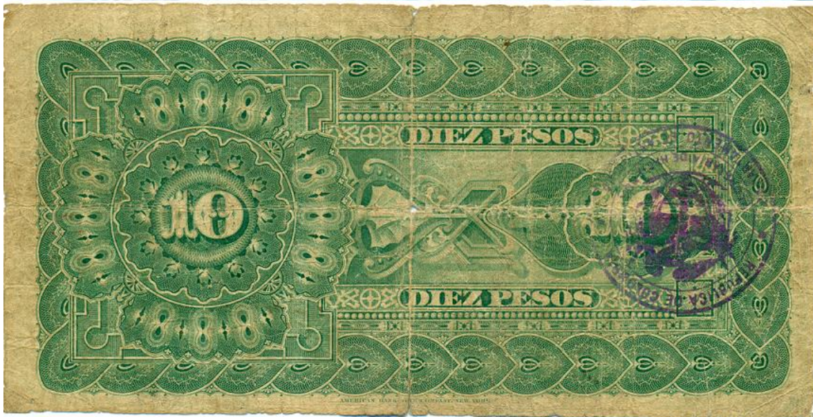
Vicente B. Villa, diez pesos, 1895 (anverso y reverso)