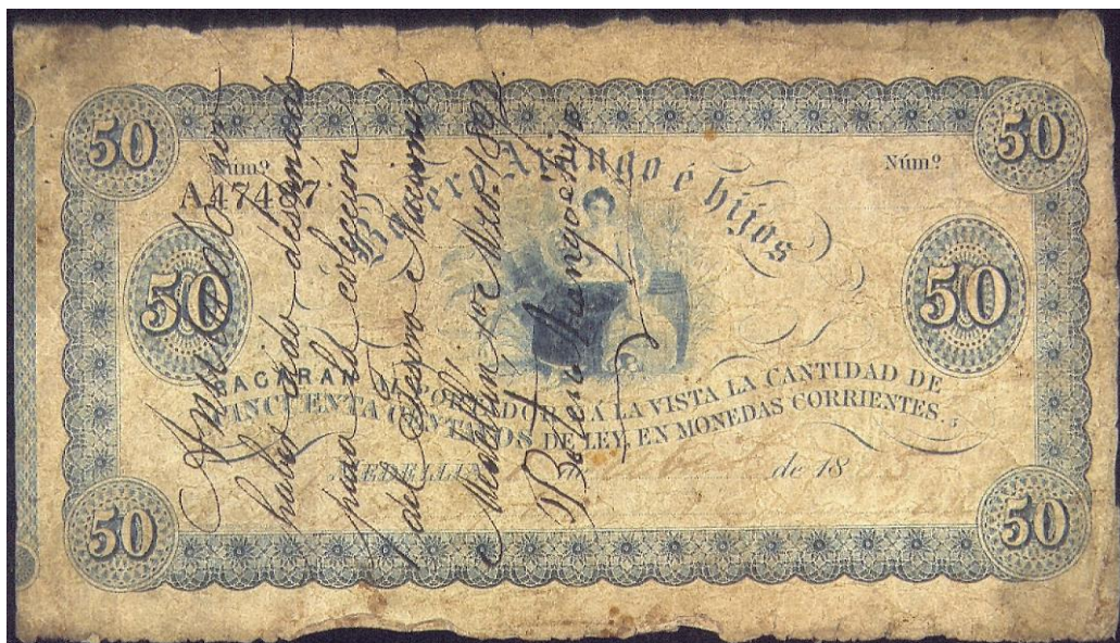
Botero Arango e Hijos, cincuenta centavos, 1885

Cincuenta centavos: Botero Arango e Hijos pagará al portador a la vista la cantidad de cincuenta centavos de ley en monedas corrientes, serie A.