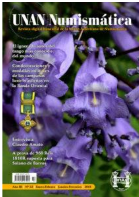
Carátula Revista UNAN Numismática No. 22