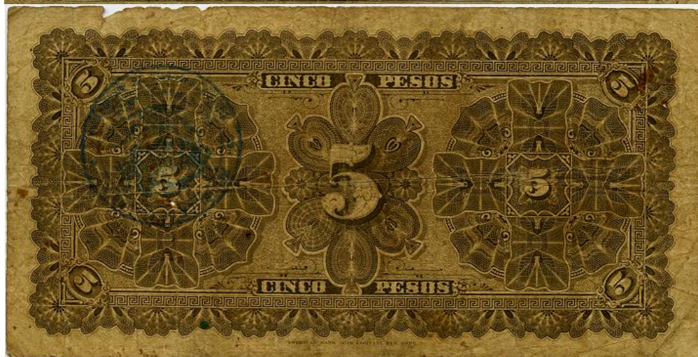
Vicente B. Villa, cinco pesos, 1895 (anverso y reverso)