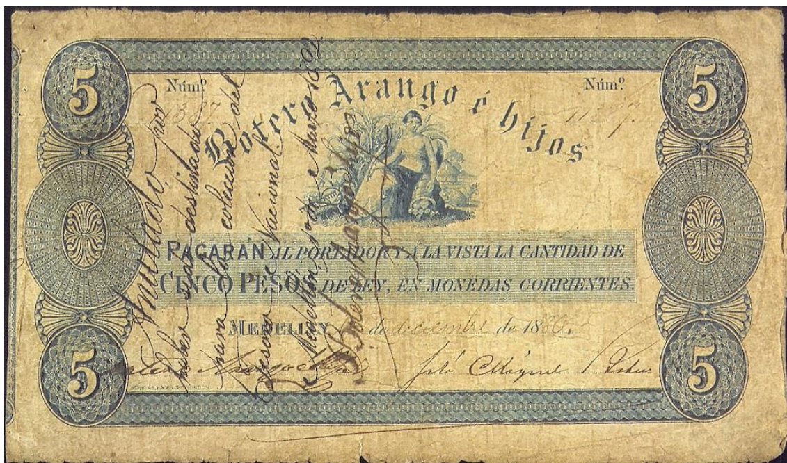
Botero Arango e Hijos, cinco pesos, 1880

Cinco pesos: igual leyenda que los anteriores. Sin serie. Fechado el 1 de diciembre de 1880, dos firmas, numerado a mano.