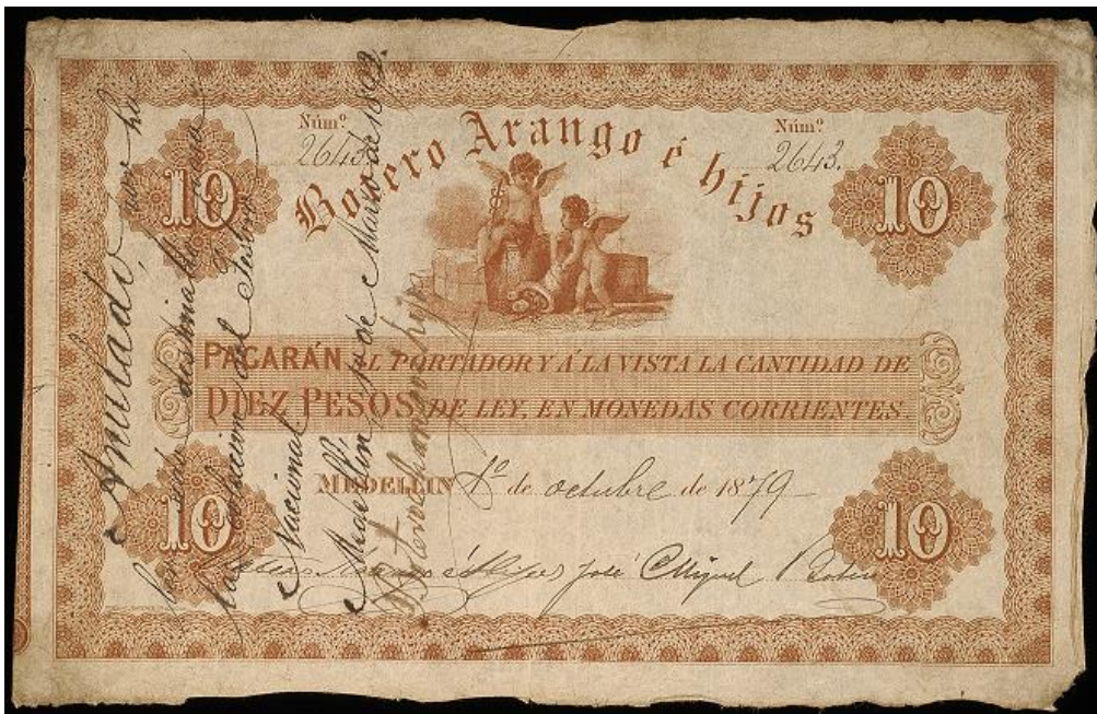
Botero Arango e Hijos, diez pesos, 1879

Diez pesos: igual leyenda que los anteriores. Sin serie. Fechado el 1 de octubre de 1879. Numerado a mano. Tiene dos firmas. A diferencia de los otros, este no tiene en el reverso la cifra, trae únicamente un sello de la casa comercial.