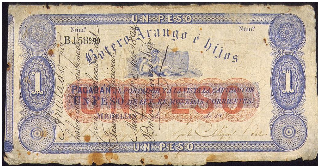
Botero Arango e Hijos, un peso, 1885

Un peso: igual texto que el anterior. Serie B, cinco dígitos, dos firmas. Fechado en Medellín, en 1885. El reverso es muy sencillo, sólo aparece dentro de una viñeta la cifra "un peso" en letras. Esta característica se conserva en las otras piezas de la serie.