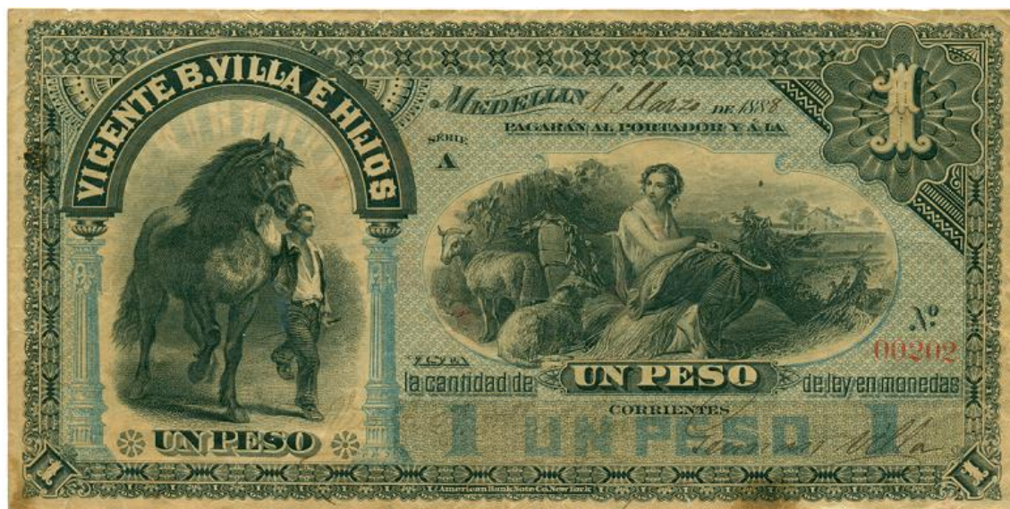
Vicente B. Villa, un peso, 1888 (anverso)

Un peso: los billetes de este valor fueron fechados en Medellín el 1 de marzo de 1888, corresponden a la serie A.