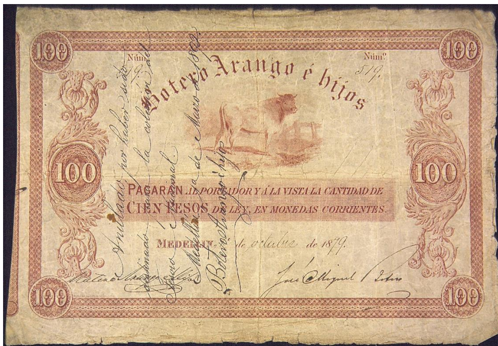
Botero Arango e Hijos, cien pesos, 1879

Cien pesos: igual leyenda que los anteriores. Sin serie. Fechado el 1 de octubre de 1879. Numerado a mano. Tiene dos firmas.