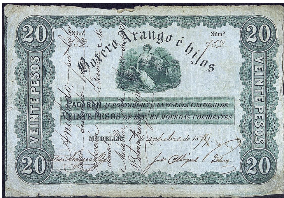
Botero Arango e Hijos, veinte pesos, 1879

Veinte pesos: igual leyenda que los anteriores. Sin serie. Fechado el 1 de octubre de 1879. Numerado a mano. Tiene dos firmas. En el reverso (y en los siguientes) vuelve a aparecer la cifra en letras.