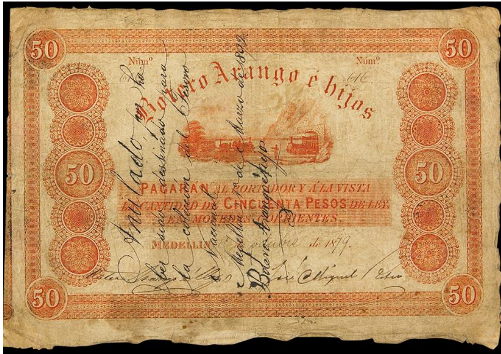
Botero Arango e Hijos, cincuenta pesos, 1879

Cincuenta pesos: igual leyenda que los anteriores. Sin serie. Fechado el 1 de octubre de 1879. Numerado a mano. Tiene dos firmas.