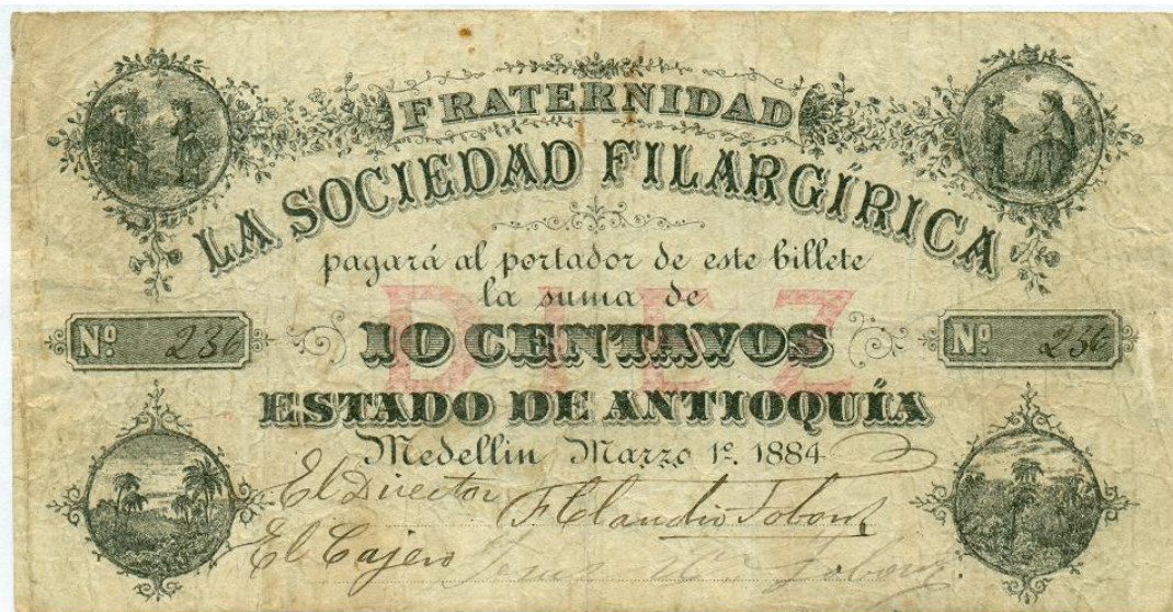
Sociedad Filargírica, 10 centavos, 1884.

10 centavos: "Fraternidad La Sociedad Filargírica pagará al portador de este billete la suma de 10 centavos / Estado de Antioquia / Medellín, Marzo 1º 1884". No. 236. Firma del director y del cajero.