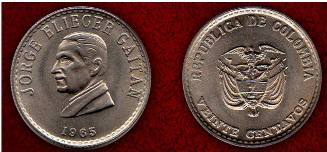
Veinte centavos, 1965

El doctor Gaitán ha sido objeto de homenaje numismático en dos ocasiones por parte de la Casa de Moneda de Bogotá y el Banco de la República de Colombia. En el año de 1965, la Casa de Moneda acuñó dos monedas de curso legal en cuproníquel por valores de veinte y cincuenta centavos. Por su parte, el Banco de la República emitió un billete por valor de mil pesos en el año 2001 (hay varias fechas), el cual todavía se encuentra en circulación. Les compartimos las dos monedas de 1965.