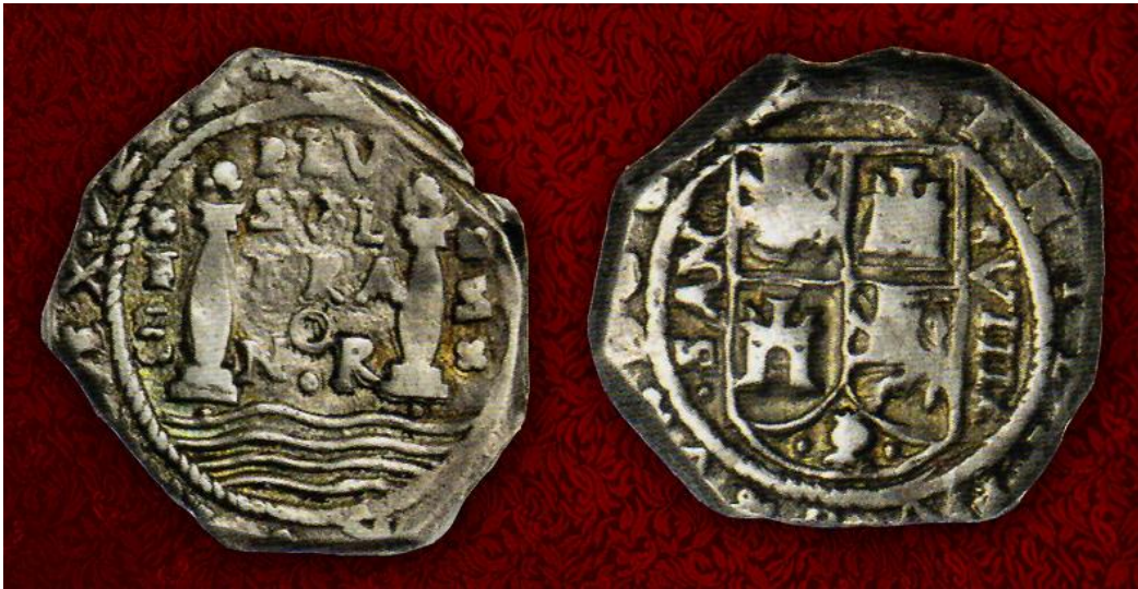
Nuevo Reino, ocho reales plata, 1722

El otro lote destacado fue el número 11004 (dos escudos oro Cartagena 1622) de un precio base de US$ 15.000 pasó a US$ 66.000.