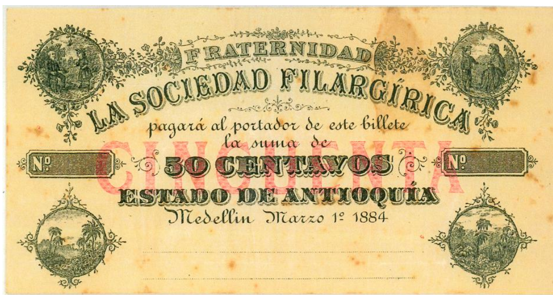
Sociedad Filargírica, 50 centavos, 1884.

50 centavos: texto igual al anterior, sin numeración y sin firmas.