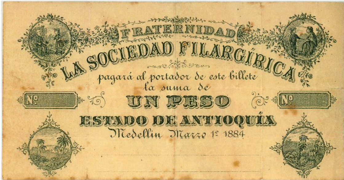
Sociedad Filargírica, un peso, 1884.

Un peso: texto igual a los anteriores, sin numeración y sin firmas.