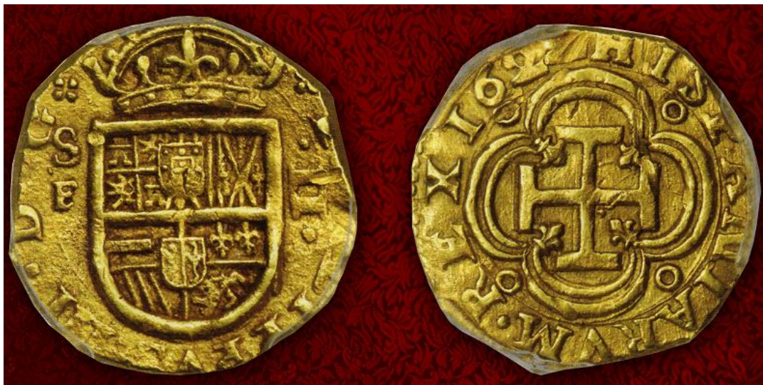
Cartagena, dos escudos oro, 1622

El otro lote destacado fue el número 11004 (dos escudos oro Cartagena 1622) de un precio base de US$ 15.000 pasó a US$ 66.000.