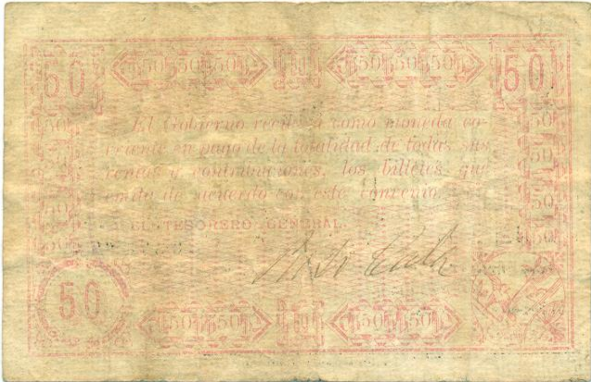
Compañía Empresaria del camino de Herradura de Bucaramanga a Sabana de Torres, cincuenta centavos, 1886 (reverso)

Un peso: Anverso: elaborado en papel común por la Tipografía Mercantil de Bucaramanga. Serie A, No. 37644. Papel blanco, fondo verde, letras y viñetas en negro. El texto es similar al del anterior billete, solo cambia la fecha (primero de febrero de 1887). Sin firmar.