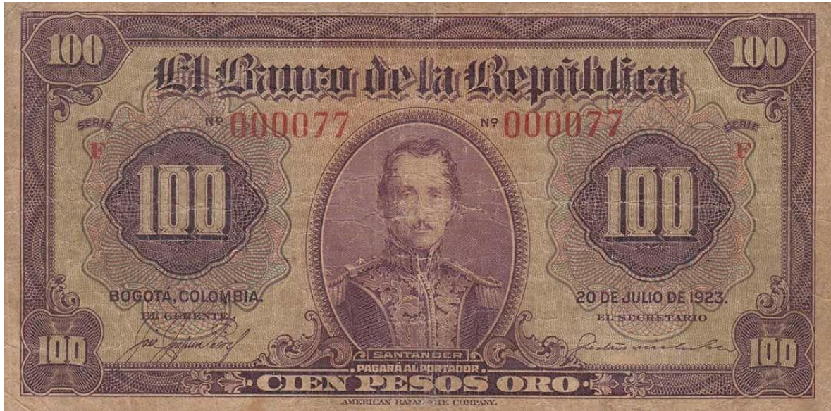
Banco de la República, cien pesos, 1923