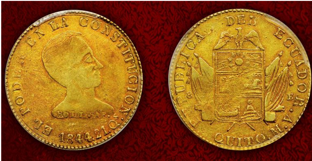
Quito, ocho escudos, 1844

JOSÉ A. GÓMEZ. E-MAIL: JOARGOPRA@YAHOO.COM