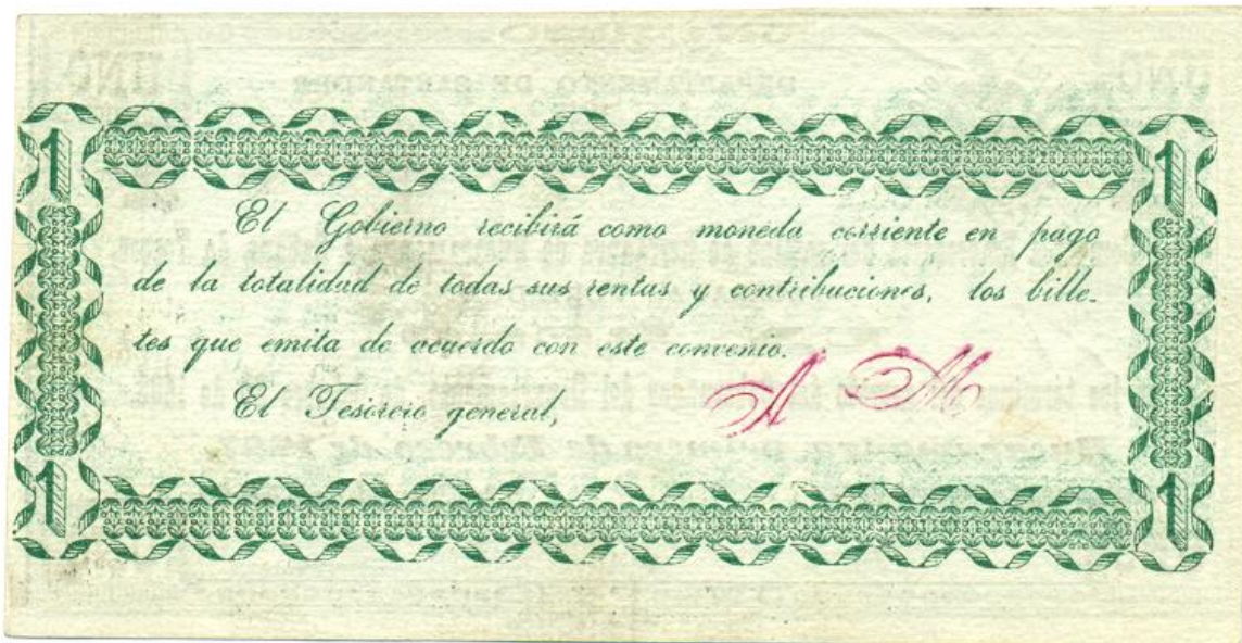
Compañía Empresaria del camino de Herradura de Bucaramanga a Sabana de Torres, un peso, 1887 (reverso)

Reverso: texto igual al del anterior dentro de un marco que posee la cifra "1" en las cuatro esquinas. Tiene la firma en rojo del Tesorero General.