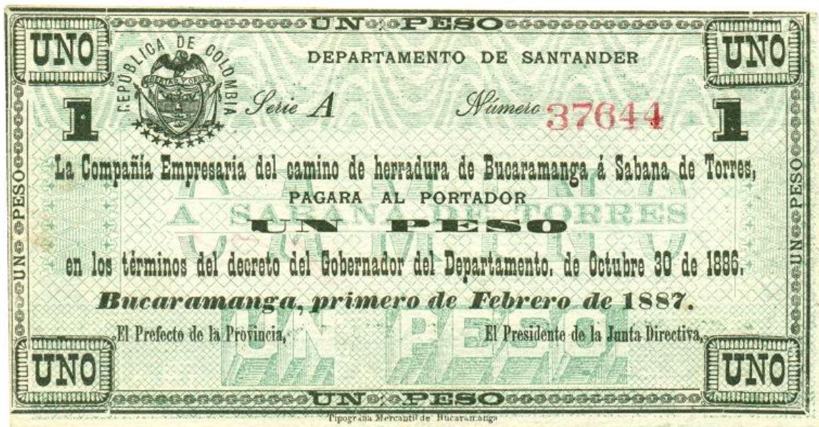
Compañía Empresaria del camino de Herradura de Bucaramanga a Sabana de Torres, un peso, 1887 (anverso)

Un peso: Anverso: elaborado en papel común por la Tipografía Mercantil de Bucaramanga. Serie A, No. 37644. Papel blanco, fondo verde, letras y viñetas en negro. El texto es similar al del anterior billete, solo cambia la fecha (primero de febrero de 1887). Sin firmar.