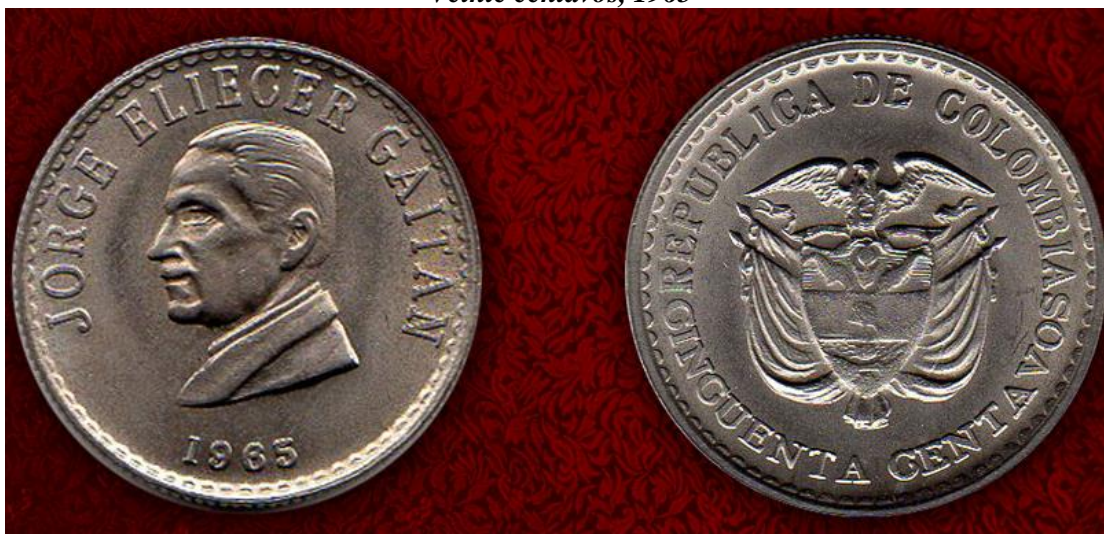
Cincuenta centavos, 1965