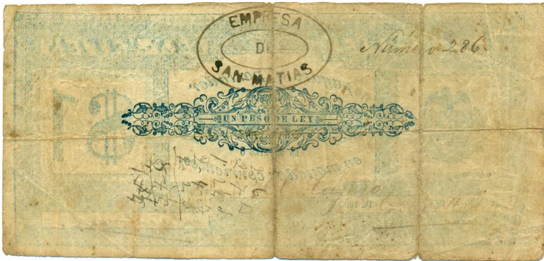
La Empresa de San Matías, un peso, 1890 (reverso)

Reverso: tiene una viñeta central sobre la que puede leerse: "Un peso de ley". En la parte superior tiene un sello que dice "Empresa de San Matías". En la parte superior derecha tiene la numeración manuscrita No. 286.