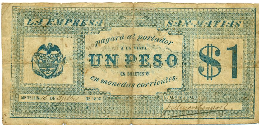
La Empresa de San Matías, un peso, 1890 (anverso)

Anverso: "La Empresa de San Matías pagará al portador a la vista UN PESO en billetes o en monedas corrientes. Medellín 15 de septiembre de 1890". Firma del administrador. A la izquierda escudo nacional, a la derecha la cifra: "$1".