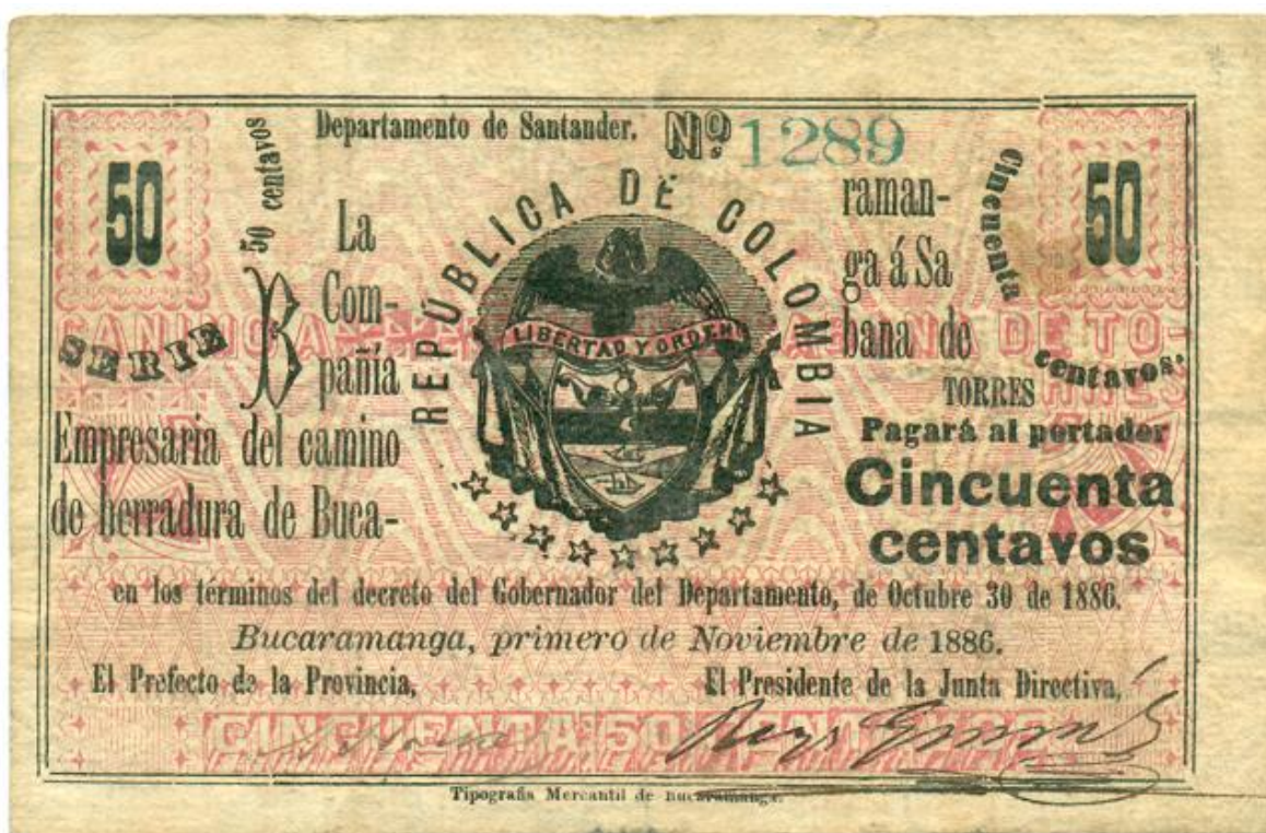
Compañía Empresarial del camino de Herradura de Bucaramanga a Sabana de Torres, cincuenta centavos, 1886 (anverso)

Anverso. Papel blanco, fondo rojo. Letras y viñeta (escudo) en negro. Serie B, No. 1289. "La Compañía Empresarial del Camino de Herradura de Bucaramanga a Sabana de Torres pagará al portador cincuenta centavos en los términos del decreto del Gobernador del Departamento, de Octubre 30 de 1886. Bucaramanga, primero de noviembre de 1886". Firmas del Prefecto de la Provincia y del Presidente de la Junta Directiva.