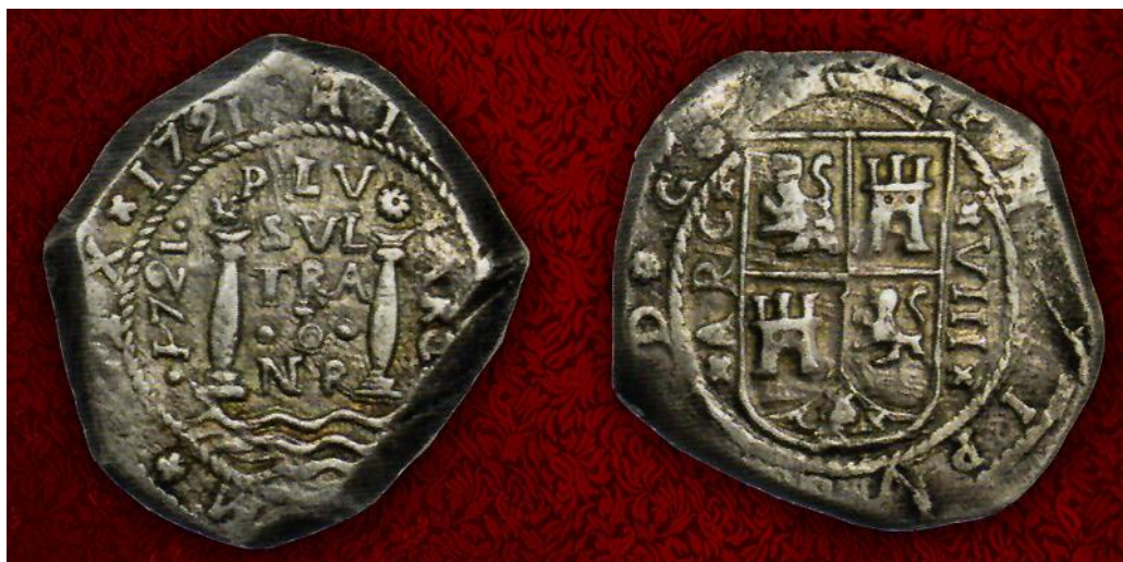
Nuevo Reino, ocho reales plata, 1721

Nos ha llamado la atención que varios lotes superaron considerablemente el precio base que se tenía estimado para ellos; por esta razón (a más de su rareza) los referenciamos como verdaderas curiosidades. Los dos primeros lotes fueron los No. 11050 y 11051 (ocho reales de plata, del Nuevo Reino de los años 1721 y 1722) que de un precio base de US$ 5.000 alcanzó la cifra de US$ 60.000.