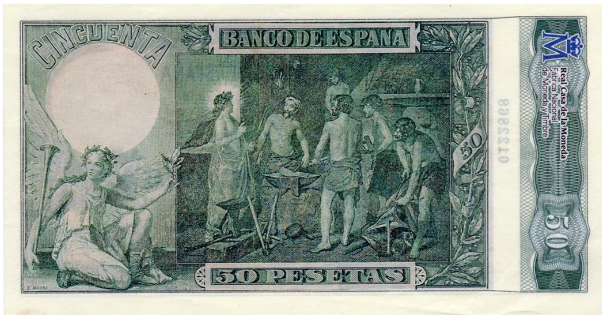
Banco de España, cincuenta pesetas, 1902 (reverso)

La segunda emisión está fechada en Madrid el 15 de agosto de 1928. Por el anverso tiene el retrato de Velázquez a la derecha. Por el reverso tiene la imagen de la pintura "La rendición de Breda".