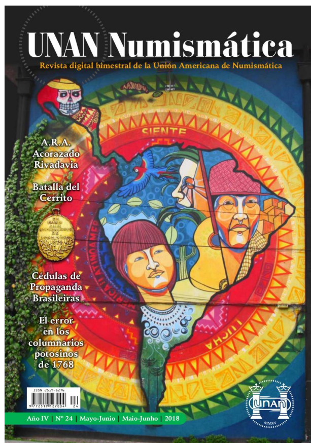
Carátula de UNAN Numismática No. 24, mayo-junio de 2018

Tanto éste número como los anteriores pueden consultarse en: https://issuu.com/unannumismatica o descargarse en formato pdf en: https://plus.google.com/u/0/+UNANNumismática .