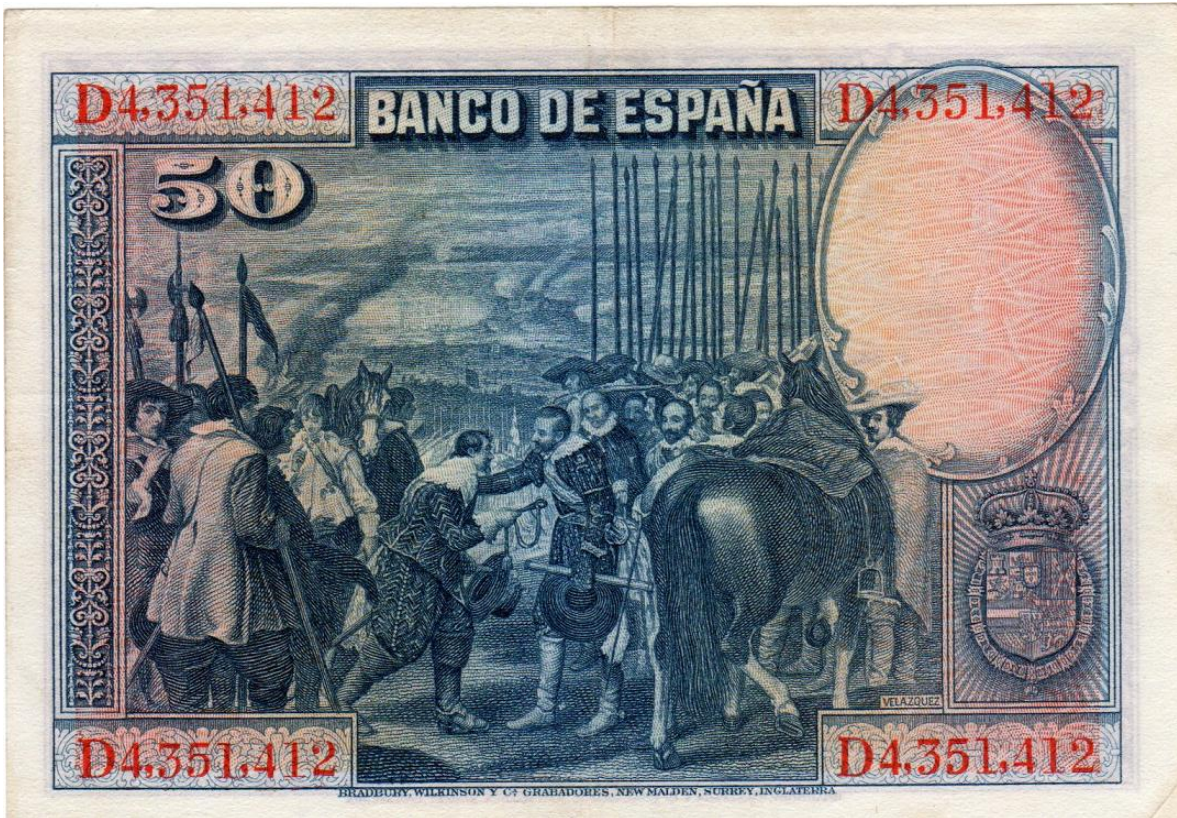
Banco de España, cincuenta pesetas, 1928 (reverso)

JOSÉ A. GÓMEZ. E-MAIL: JOARGOPRA@YAHOO.COM