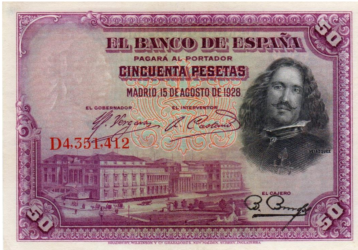
Banco de España, cincuenta pesetas, 1928 (anverso)

La segunda emisión está fechada en Madrid el 15 de agosto de 1928. Por el anverso tiene el retrato de Velázquez a la derecha. Por el reverso tiene la imagen de la pintura "La rendición de Breda".