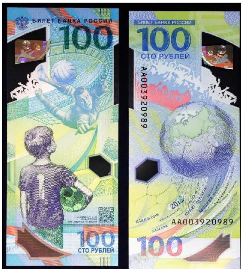
Billete conmemorativo Rusia 2018 (anverso y reverso)