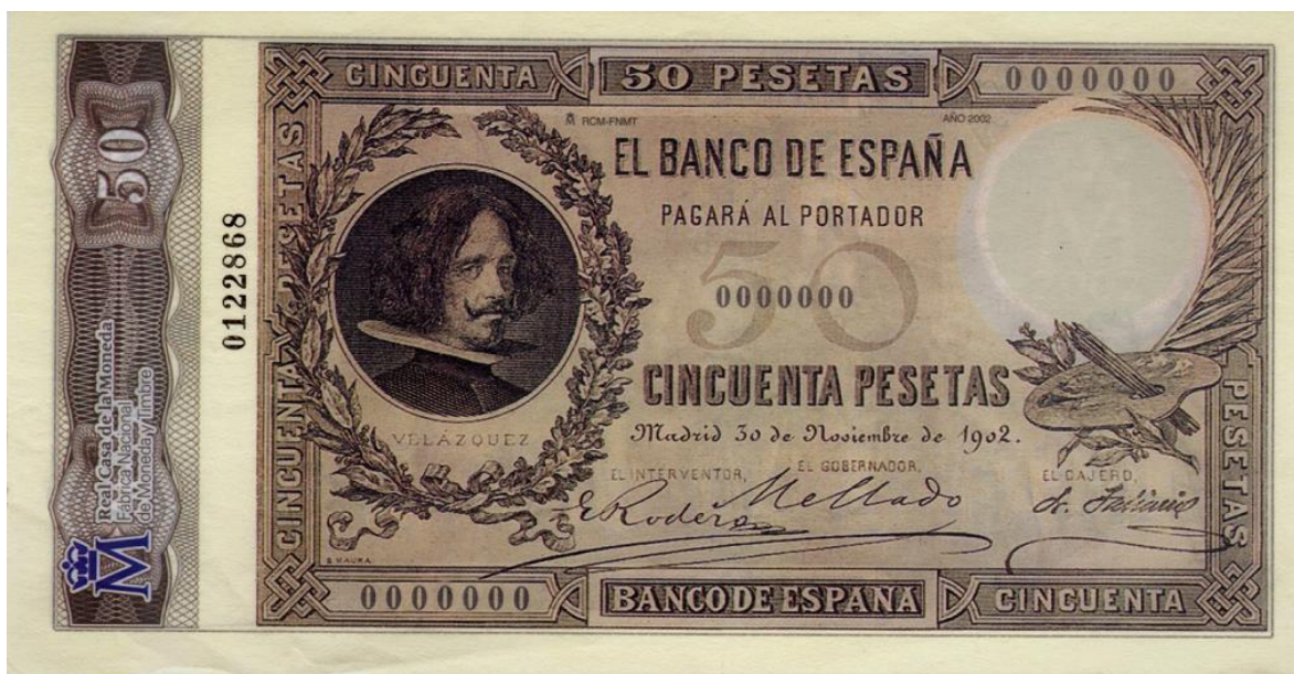
Banco de España, cincuenta pesetas, 1902 (anverso)

En lo referente a la numismática, el Banco de Emisión de España le ha rendido un merecido reconocimiento al gran pintor en dos emisiones de billetes al portador. La primera emisión fue un billete de cincuenta pesetas fechado en Madrid a 30 de noviembre de 1902, con el retrato del pintor. El reverso está ilustrado con una de sus pinturas, La fragua de Vulcano. Este billete pertenece a una emisión en facsímil de la Real Casa de Moneda. Fábrica Nacional de Moneda y Timbre.