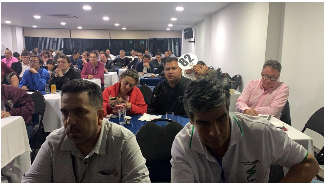
Vista general de la Dispersión No. 7