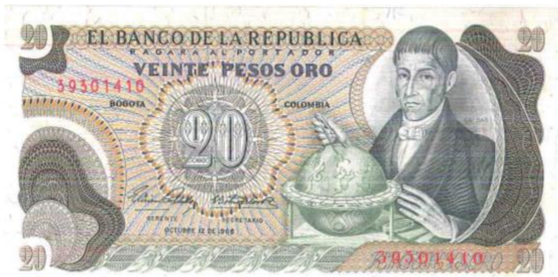
Banco de la República, veinte pesos, 1966

diseño totalmente diferente a los anteriores. No tiene pie de imprenta pero fue realizado en la para esa época, recién creada imprenta de billetes del Banco de la República. Sin duda, es un diseño moderno, en el que Caldas aparece a la derecha con un mapamundi y un compás. El reverso está ilustrado con un conjunto de piezas de oro precolombino pertenecientes al Museo del Oro del Banco de la República. Tiene por fecha el 12 de octubre de 1966