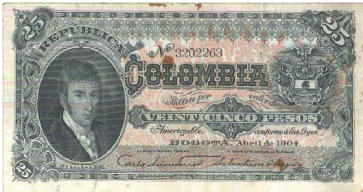
Junta Nacional de Amortización, 25 pesos, 1904

En la emisión patriótica de La Junta Nacional de Amortización, realizada en 1904, aparece Caldas al lado izquierdo del anverso en el billete de 25 pesos . Fue elaborado por la Lit. Waterlow & Sons de Londres. Bogotá, abril de 1904. El reverso está ilustrado con una imagen del Observatorio Nacional, del que fuera su primer director el sabio payanés.