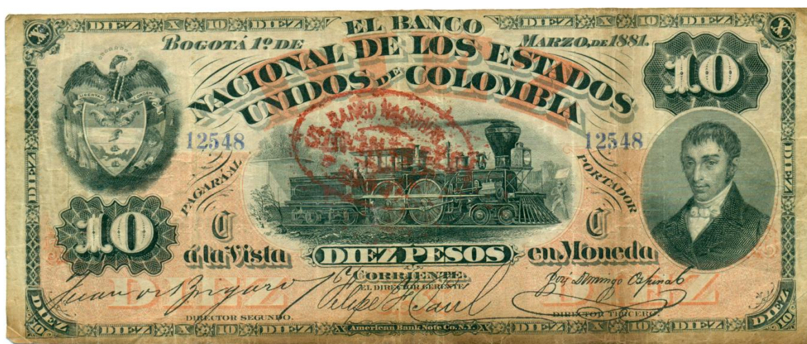
Banco Nacional de los Estados Unidos de Colombia, 10 pesos, 1881

La primera ocasión en que Caldas aparece en un billete fue en el de 10 pesos de la primera serie del Banco Nacional de los Estados Unidos de Colombia realizada en 1881. En el anverso aparece una imagen del prócer. Fechado en Bogotá el 1 de marzo de 1881. Fue impreso por el American Bank Note.