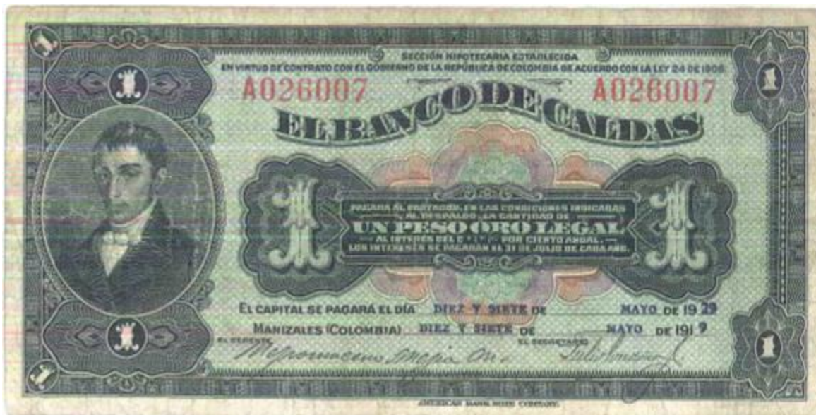
Banco de la Caldas, un peso, 1919

El Banco de Caldas, fundado en 1910 en la ciudad de Manizález, realizó para su primera emisión (respaldada en oro legal, según reza en las piezas) un resello sobre los billetes que había encargado a la American Bank Note. Dicha emisión tuvo los valores de cincuenta centavos, uno, dos, cinco, diez y veinte pesos. Los diseños son muy parecidos entre sí; todos llevan el retrato del prócer Francisco José de Caldas y se destacan por el atractivo de sus diseños y colores. Los valores que se resellaron como cédulas hipotecarias fueron uno, dos y cinco pesos, con fecha de 1919 y para ser pagados en 1929.