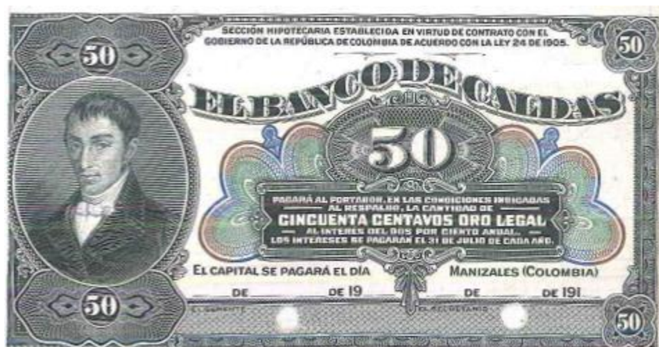
Banco de Caldas, 50 centavos, Especimen