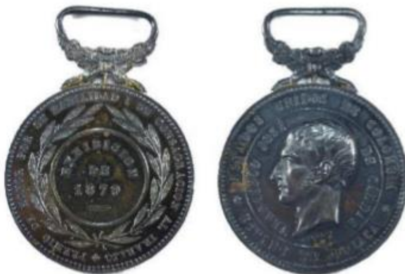
Medalla Francisco José de Caldas, 1879

En cuanto a medallas, también se han acuñado varias en homenaje al sabio payanés, una de ellas es la realizada por el Estado Soberano de Boyacá para la exposición de 1879, otorgada como “Premio de honor por la amabilidad y la consagración al trabajo”.