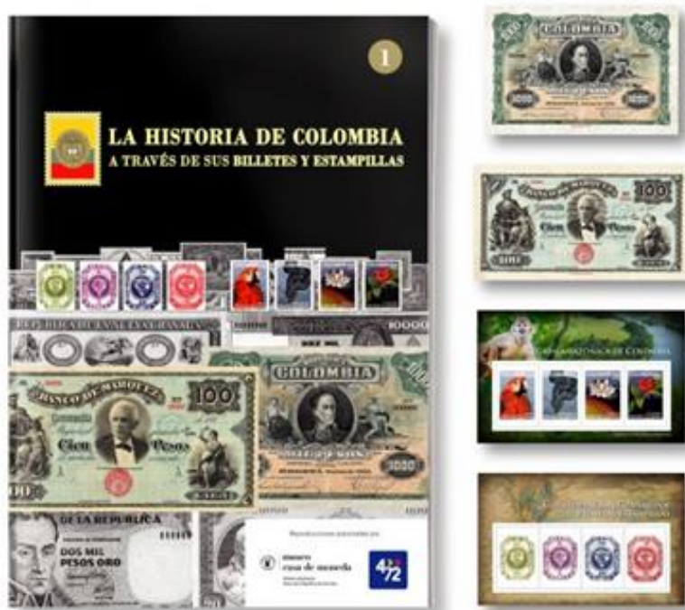
Carátula de la colección