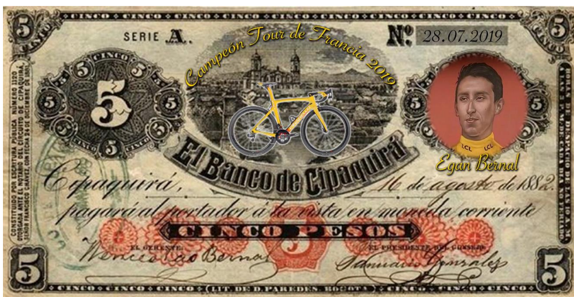
Montaje sobre un billete de cinco pesos de Cipaquirá para homenajear a Egan Bernal