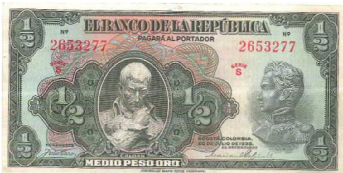
Banco de la República, medio peso, 1935

Para el año de 1935 el Banco de la República emitió el valor de \frac{1}{2} peso con la imagen de un busto de Caldas y la de un busto de Bolívar. Fechado en Bogotá el 20 de julio de 1935. Por el anverso tiene múltiples colores y por el reverso es de color café. A nuestro parecer es uno de los más bellos billetes de la serie.