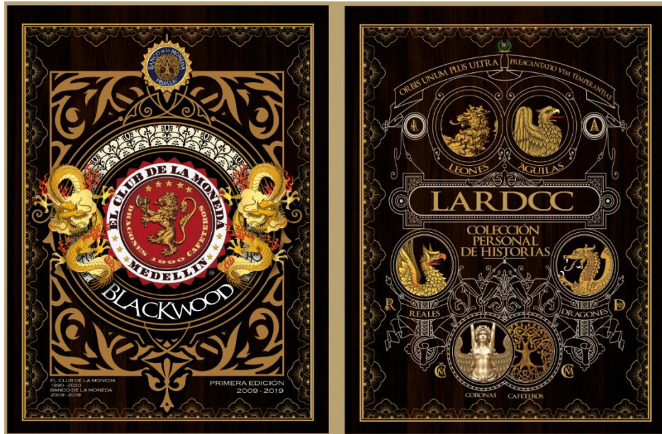
Carátula libro del Club de la Moneda