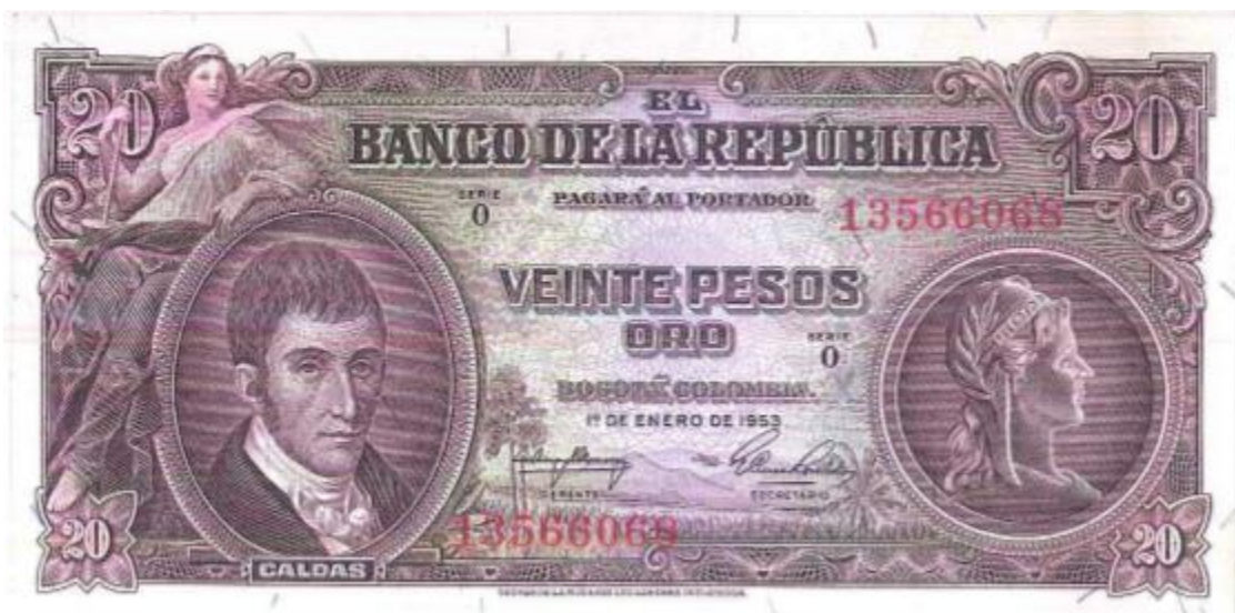
Banco de la República, veinte pesos, 1953

Ya en 1953, se emitió un billete de 20 pesos pero con diferente diseño. A la izquierda vemos la imagen del prócer y a la derecha una viñeta ilustrativa del Banco de la República. La fecha es 1 de enero de 1953. Fue impreso por la firma Thomas de la Rue de Londres. Hubo varias fechas.