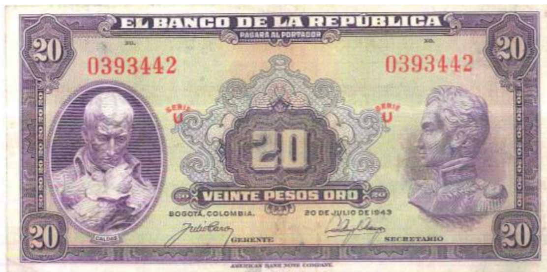
República de Colombia, veinte pesos, 1943

En el año de 1943 el Banco de la República puso en circulación un nuevo billete de 20 pesos oro , en el que el prócer Caldas aparece al costado izquierdo. Bogotá 20 de julio de 1943. Este diseño salió en varias fechas.