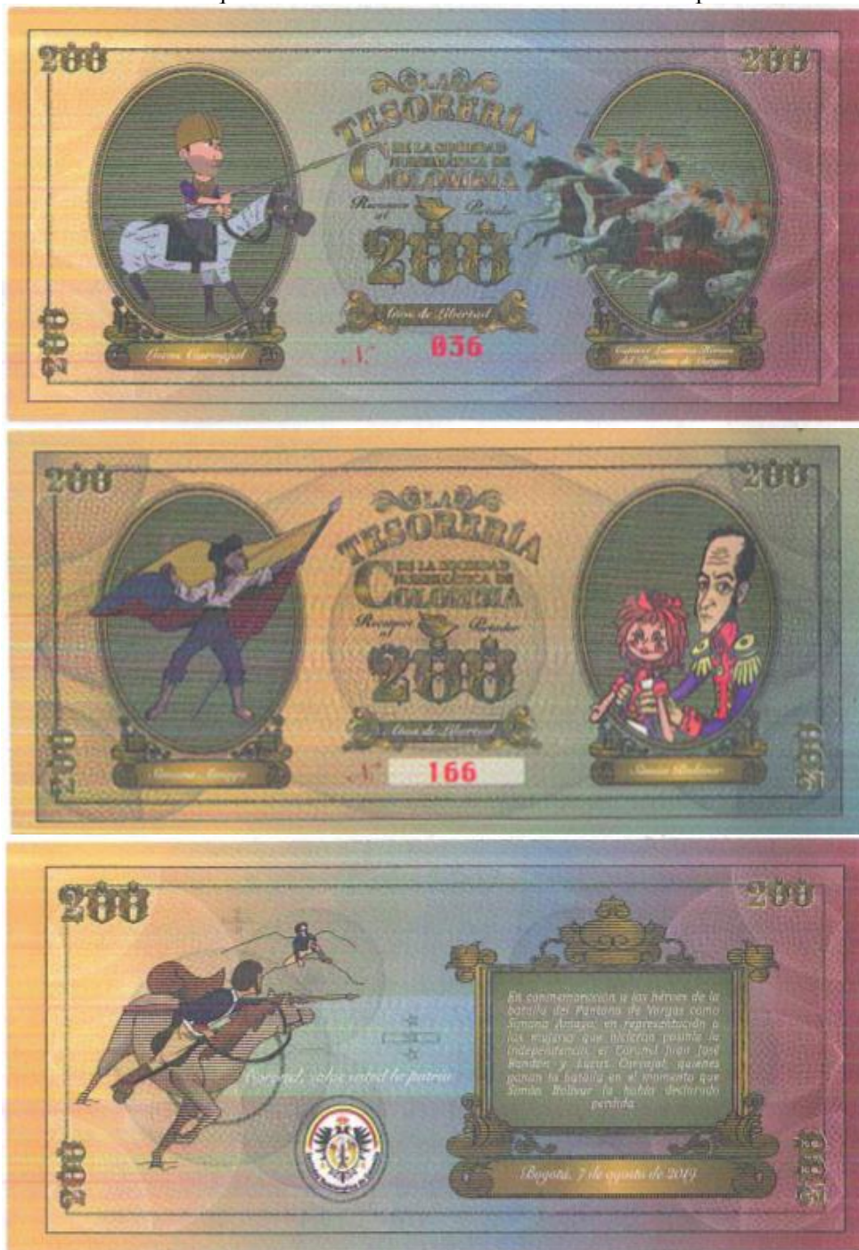
Sociedad Numismática de Colombia, 200 años de libertad, 2019

portador 200 años de Libertad”. En el primero, se le rinde un homenaje a Lucas Carvajal y en el segundo a Simona Amaya. El reverso es igual para los dos y tiene el siguiente texto: “En conmemoración a los héroes de la Batalla del Pantano de Vargas como Simona Amaya: en representación a las mujeres que hicieron posible la Independencia; el coronel Juan José Rondón y Lucas Carvajal, quienes ganan la Batalla en el momento que Simón Bolívar la había declarado perdida”.