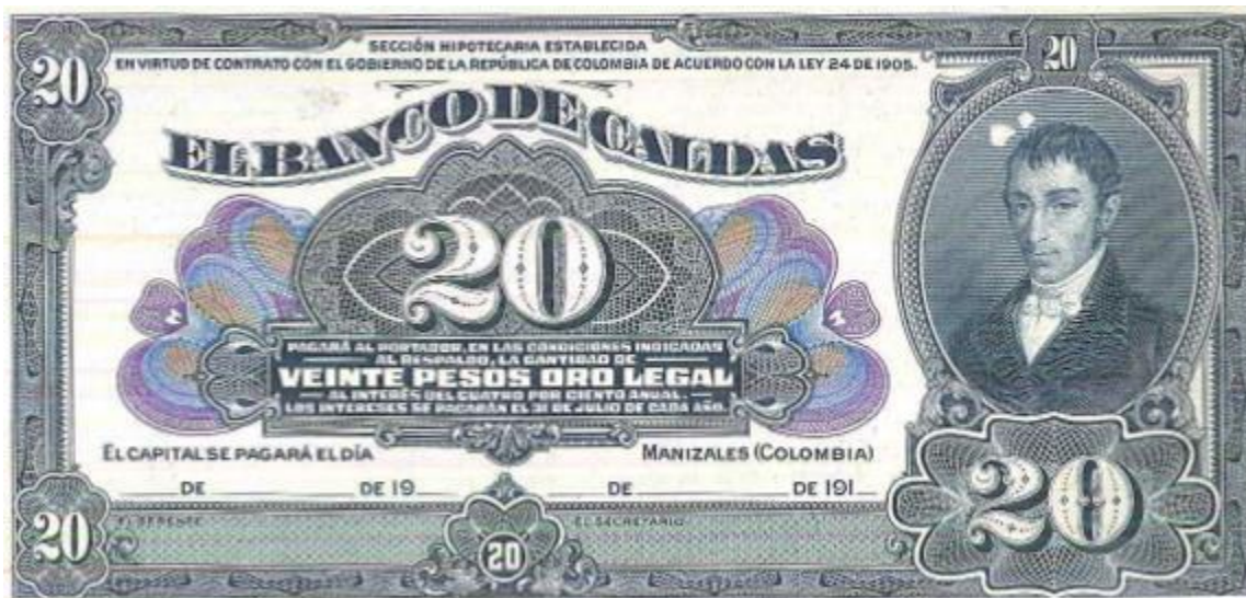
Banco de Caldas, 20 pesos, Especimen

El Banco de la República ha homenajeado en diversas ocasiones al sabio Caldas, consagrándolo en varios billetes desde su primera emisión fechada el 20 de julio de 1923. En el valor de 1 peso se aprecia la imagen del prócer en todo el centro de la pieza. El color es azul por el anverso y marrón por el reverso. Elaborado por American Bank Note.