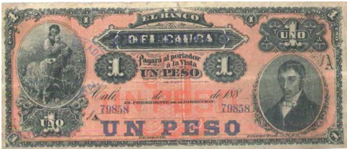
Banco del Cauca, un peso, 1881

de 1881. Cuando este banco se fusionó con el Banco del Estado de Popayán fue resellado para este banco. El prócer aparece en el costado derecho.