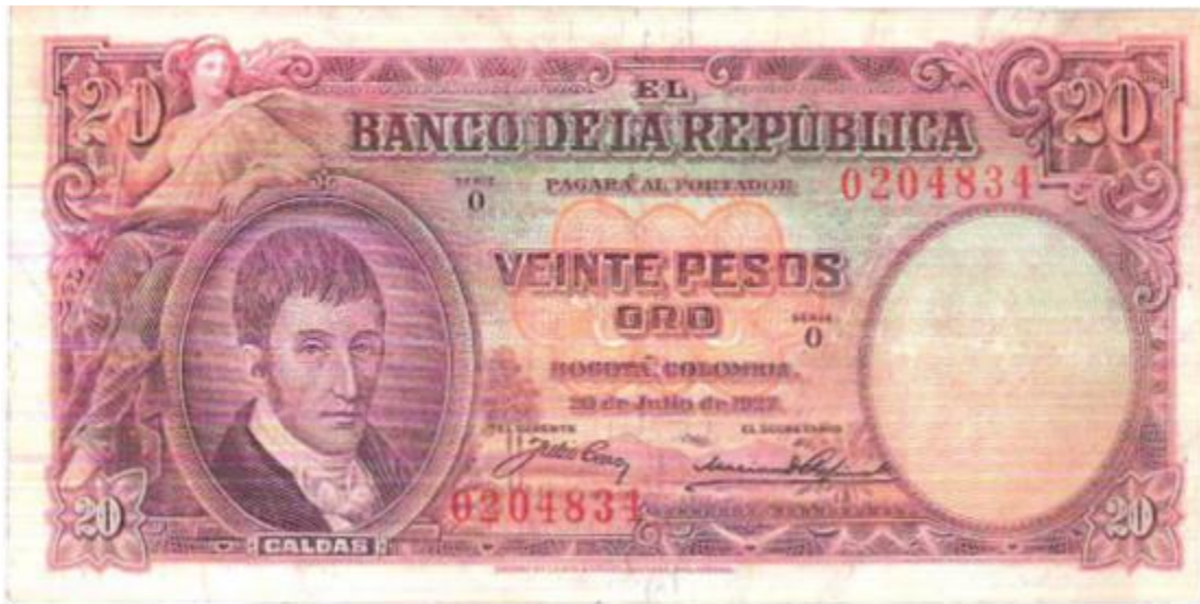
Banco de la República, veinte pesos, 1927

del edificio del Banco de la República en Barranquilla. Solamente salió en esta fecha.