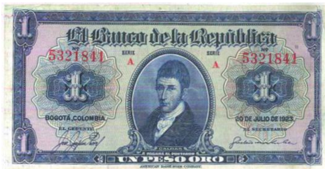
Banco de la República, un peso, 1923

El Banco de la República ha homenajeado en diversas ocasiones al sabio Caldas, consagrándolo en varios billetes desde su primera emisión fechada el 20 de julio de 1923. En el valor de 1 peso se aprecia la imagen del prócer en todo el centro de la pieza. El color es azul por el anverso y marrón por el reverso. Elaborado por American Bank Note.