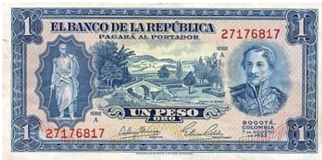
Banco de la República, 1 peso, 1953

En el centro del billete se puede apreciar el simbólico Puente de Boyacá y a los costados las imágenes de los dos más importantes gestores de la Independencia: Simón Bolívar a la izquierda y Francisco de Paula Santander a la derecha.