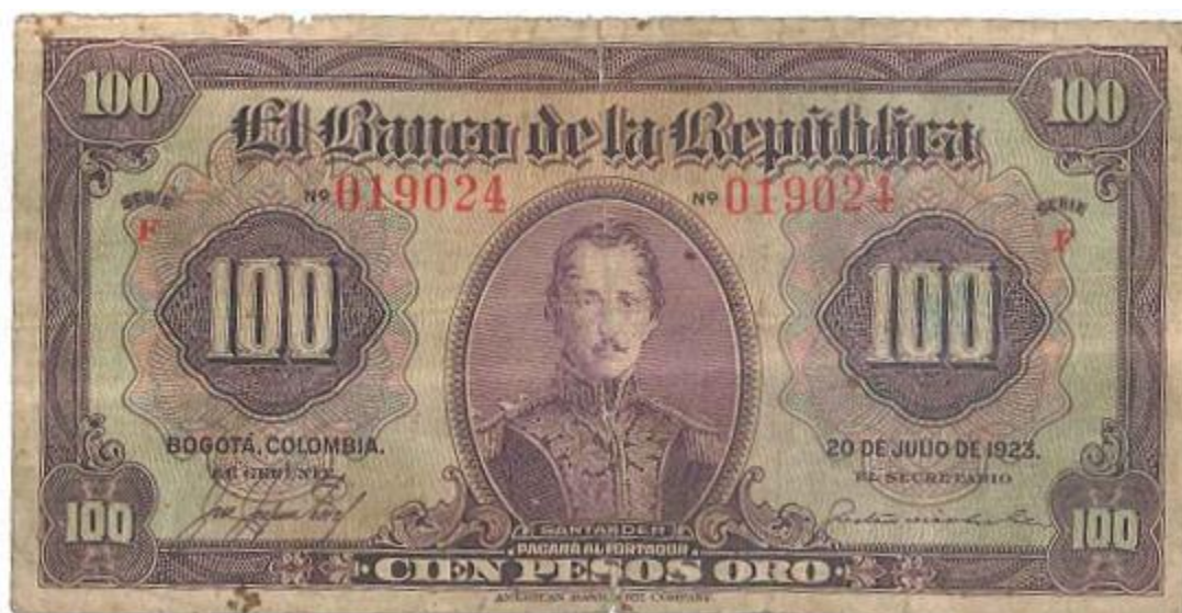
Banco de la República, 100 pesos, 1923

En la primera emisión del Banco de la República de 1923, en el valor de 100 pesos oro se exalta a Santander en todo el centro del billete. Fue elaborado por la American Bank Note Company. El color es vinotinto por anverso y reverso. Este diseño con pequeñas modificaciones salió hasta el año de 1957. (PPH, 279).