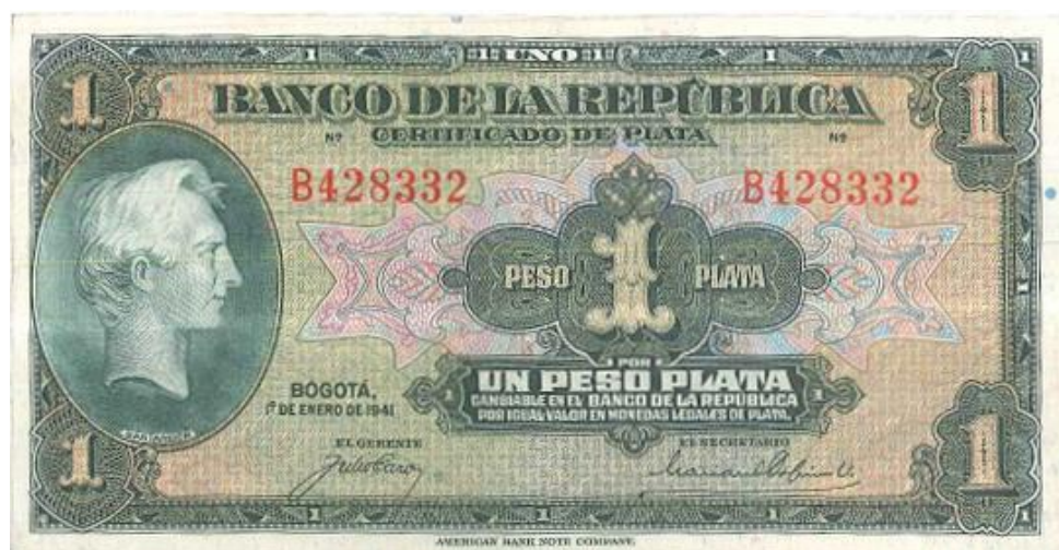
Banco de la República, un peso, 1941

En el año de 1941 el Banco de la República emitió un nuevo billete de un peso parecido al del año 1932 en cuanto al color y la imagen del prócer. Bogotá 1 de enero de 1941. Formato pequeño. Elaborado por la American Bank Note. Se conocen de 6 y 7 dígitos. Única fecha. (PPH, 42).