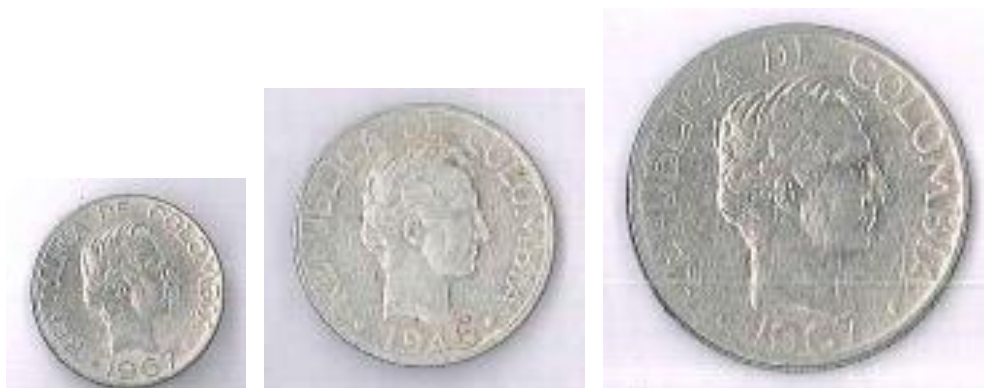
Monedas de 10, 20 y 50 centavos, 1946, 1967

En monedas de circulación masiva el general Santander está presente en monedas de diez, veinte y cincuenta centavos. Durante los años de 1945, 1946, 1947, 1948, 1949, 1950 y 1951 salieron monedas en plata con el busto del prócer. Posteriormente, este mismo diseño salió en los años 1967, 1968, 1969. La última fecha salió en 1979. En el año de 1970 salió nuevamente la moneda de 50 centavos en un tamaño mucho más pequeño que el anterior y en forma decagonal. El último año de acuñación de este valor fue 1980.