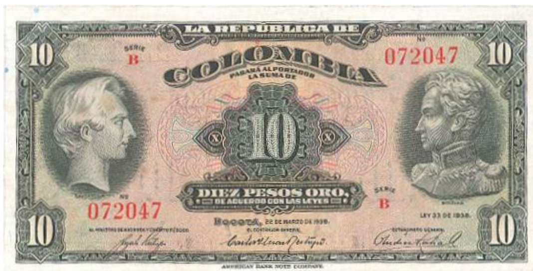
Banco de la República, 10 pesos, 1938

En 1938 el Banco de la República le encargó a la American Bank Note la elaboración de un billete de diez pesos oro con las efigies de Santander y Bolívar. Este billete fue respaldado por la República de Colombia según la Ley 33 de 1938. Lleva la firma de Carlos Lleras Restrepo como Contralor General. El reverso tiene el escudo de armas del país. Única fecha. (PPH, 163).