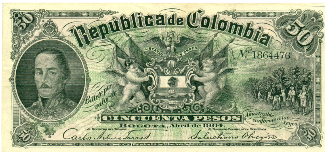
Junta Nacional de Amortización, 50 pesos, 1904

La Ley 7 de 1913 autorizó a la Junta de Conversión para emitir billetes de 1, 2, 5 y 10 pesos. El valor de 10 pesos fue reservado para que apareciera la imagen de Santander en el costado izquierdo; en el centro está el signo pesos y a la derecha el escudo de armas de Colombia. Fue elaborado por la American Bank Note Co. Se conocen varias series en colores múltiples. Bogotá 20 de julio de 1915. El reverso está ilustrado con una imagen del Capitolio Nacional. Color amarillo. (DP, 2665).