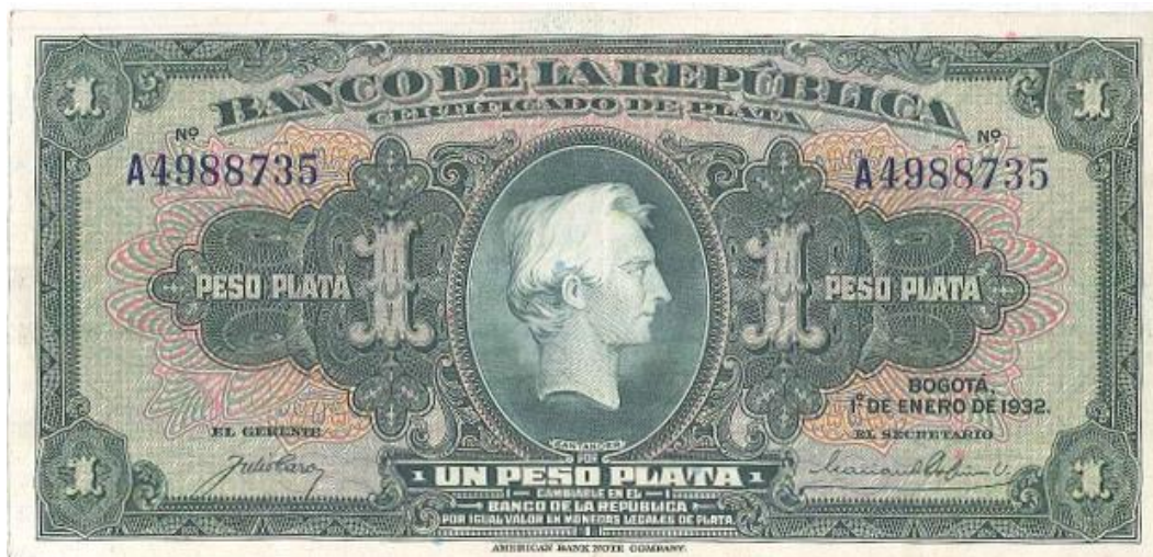
Banco de la República, un peso plata, 1932

Para 1932 el respaldo de las emisiones del Banco de la República era en plata. Dicho banco emitió un hermoso billete de un peso plata en el que Santander aparece en el centro del anverso. El color es verde. Bogotá 1 de enero de 1932. Elaborado en American Bank Note Company. (PPH, 39). Está fue la única fecha.