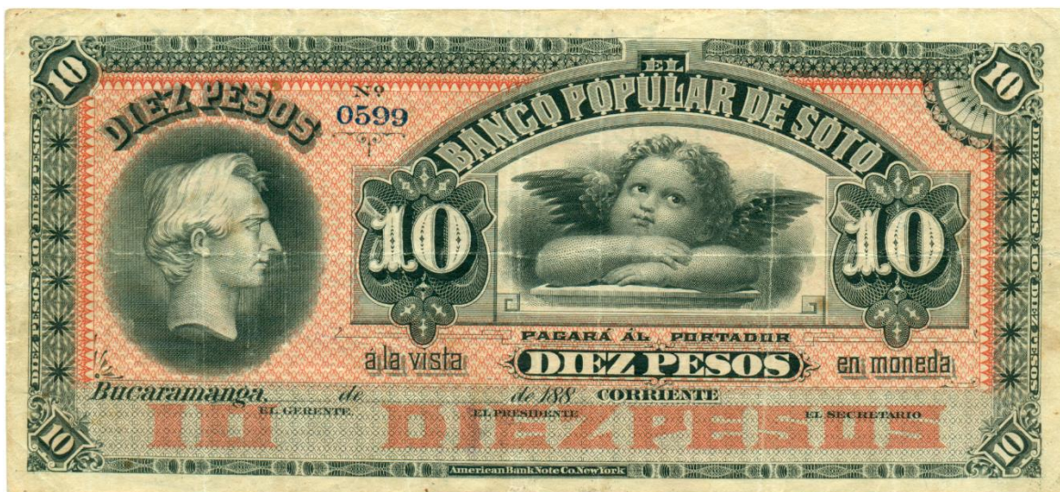
Banco Popular de Soto, diez pesos, 188.

Por su parte el Banco Popular de Soto , fundado en la década de 1880 en la ciudad de Bucaramanga, realizó una emisión en valores de uno, cinco y diez pesos. En el más alto valor aparece a la izquierda el prócer santandereano. Carece de firmas. Elaborado por American Bank Note. (DP, 9234).