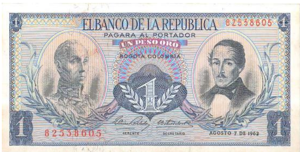
Banco de la República, un peso, 1959

Posteriormente, la recién creada fábrica de billetes del Banco de la República fue la encargada de realizar un bonito billete de un peso oro en el año de 1959. El general Santander (en traje de civil) comparte espacio con Bolívar por el anverso. La primera fecha fue octubre 12 de 1959 y la última, agosto 7 de 1974. El reverso está ilustrado con un bello paisaje de nevados, ríos, cascadas y un cóndor con las alas desplegadas en primer plano.