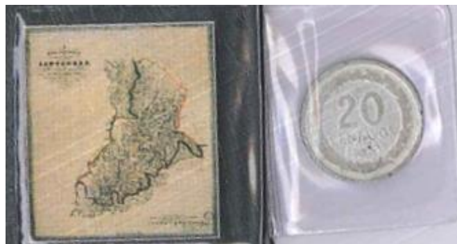
Moneda resellada por ANSA

El presidente de la Asociación Numismática de Santander nos hizo entrega de una moneda de plata de 20 Centavos de 1946 con la imagen del general Francisco de Paula Santander, la cual tiene un resello de ANSA.