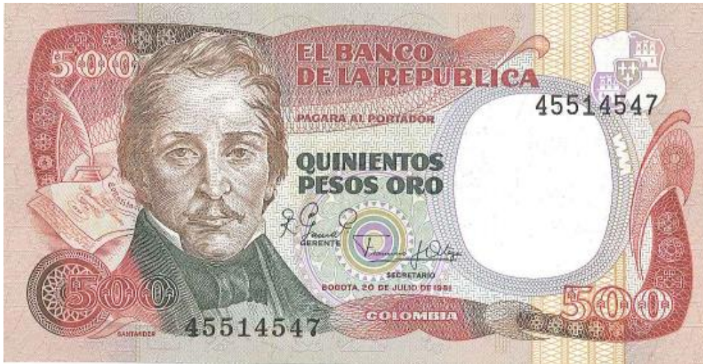
Banco de la República, 500 pesos, 1981

El último billete de 500 pesos oro de la serie empezó a circular en el año de 1981. Salieron durante varias fechas, la última en 1985. Santander al costado izquierdo en traje de civil. El reverso tiene una foto del interior de la Casa de Moneda de Bogotá. Colores múltiples. Elaborado por Thomas de la Rue and Company Limited. (PPH, 389).