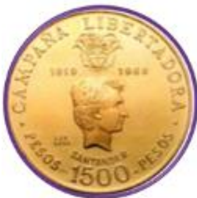
Moneda conmemorativa sesquicentenario Campaña Libertadora, 1969

En cuanto a monedas también ha estado presente la imagen de Santander en ellas. Ha estado en monedas conmemorativas y en otras de circulación corriente. En la emisión de oro que realizó la Casa de Moneda de Bogotá para conmemorar el sesquicentenario de la Campaña Libertadora en 1969, en el valor de 1500 pesos aparece por el reverso. Recordemos que la emisión estuvo compuesta por cinco monedas en las que el anverso de todas corresponde a la imagen de Simón Bolívar.