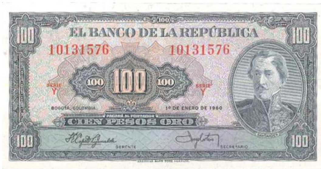
Banco de la República, 100 pesos, 1958

Para el año de 1958 el banco emisor cambió el diseño de su billete de cien pesos. Ahora Santander aparece al lado derecho. El color es gris verdoso y la fecha: Bogotá 7 de agosto de 1958. Este diseño salió hasta el año de 1967.