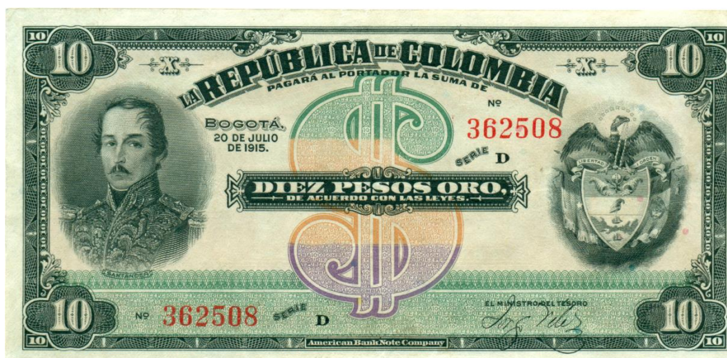
República de Colombia, Junta de Conversión, diez pesos, 1915

La Ley 7 de 1913 autorizó a la Junta de Conversión para emitir billetes de 1, 2, 5 y 10 pesos. El valor de 10 pesos fue reservado para que apareciera la imagen de Santander en el costado izquierdo; en el centro está el signo pesos y a la derecha el escudo de armas de Colombia. Fue elaborado por la American Bank Note Co. Se conocen varias series en colores múltiples. Bogotá 20 de julio de 1915. El reverso está ilustrado con una imagen del Capitolio Nacional. Color amarillo. (DP, 2665).