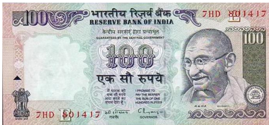
Banco de Reserva de India, 100 rupias