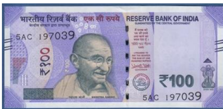
Banco de Reserva de India, 100 rupias, 2018