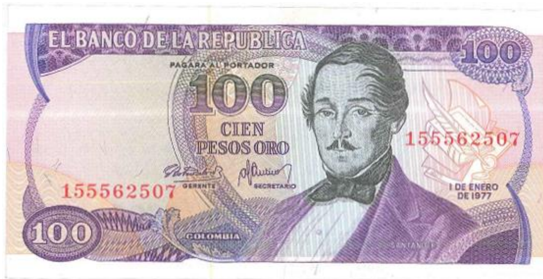
Banco de la República, 100 pesos oro, 1977

Llegamos al año de 1977 cuando aparece un nuevo diseño por el mismo valor con la imagen del prócer Francisco de Paula Santander. Color lila. Lleva marca de agua. Bogotá 1 de enero de 1977. Este fue el último billete de cien pesos de la serie. (PPH, 304).