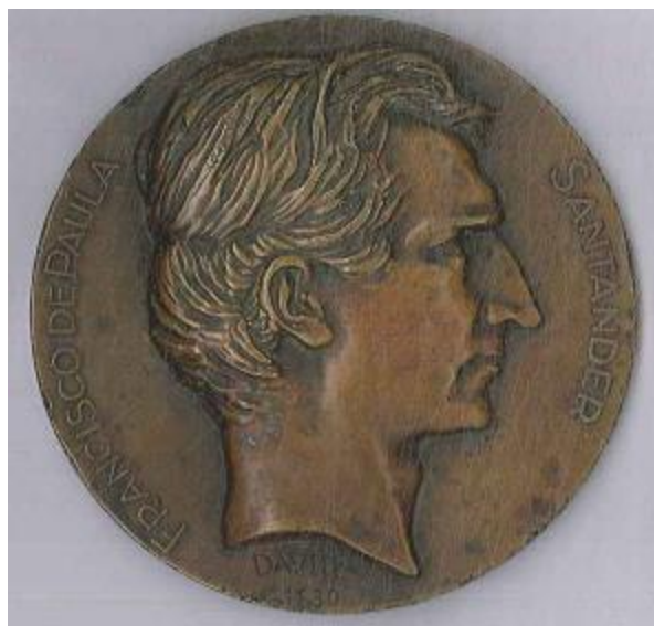
Medalla conmemorativa centenario de la muerte de Santander, 1840-1940

También en varias medallas podemos ver la imagen de Francisco de Paula Santander. Una de ellas es la realizada por la República de Colombia con motivo del primer centenario de su muerte 1840-1940. Anverso: esfinge de Santander por David en 1830. Alrededor: Francisco de Paula Santander. Reverso: escudo de armas 1840-1940. Colombia al Hombre de las Leyes. Metal bronce.