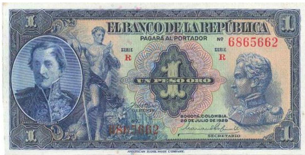
Banco de la República, un peso oro, 1929

En 1929 el Banco de la República dio a circulación un billete por valor de un peso, en el cual el general Santander comparte espacio con Simón Bolívar. Bogotá, 7 de agosto de 1929. Color azul. (PPH, 16). Elaborado en la American Bank Note de Nueva York. Este diseño salió en varias fechas hasta el años de 1954. El respaldo era en oro.