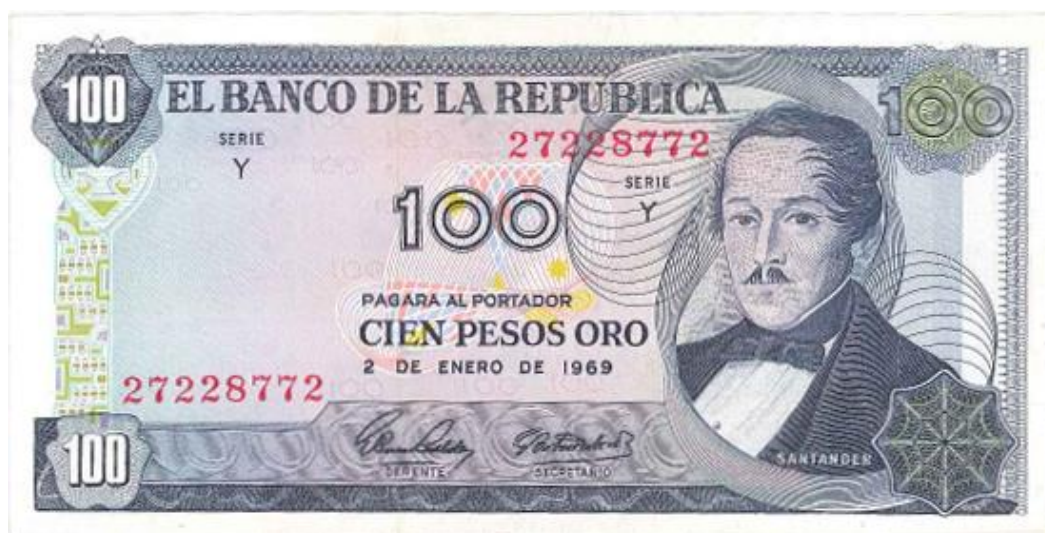
Banco de la República, 100 pesos oro, 1968

En el año de 1968 apareció en circulación un nuevo diseño de cien pesos oro. Santander aparece en el anverso al lado derecho en traje de civil. El reverso está ilustrado con la imagen del edificio del Capitolio Nacional. Bogotá 1 de enero de 1968. Se conocen con la letra R de reposición. Fueron elaborados por Thomas de la Rue & Company Ltda. Tiene marca de agua. La última emisión fue en el año 1974. (PPH, 295).