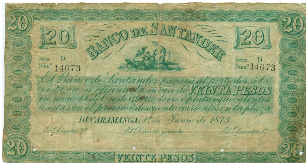
Banco de Santander, 20 pesos, 1873

Por último, queremos destacar que aunque este banco no utilizó la imagen de Santander, si le hizo honor a su nombre tomándolo para nombrar a su entidad, nos referimos al Banco de Santander, fundado en Bucaramanga en 1873, el cual realizó una emisión por valores de uno, cinco, diez, veinte, cincuenta y cien pesos. La mayoría de estos ejemplares fueron resellados por el reverso durante la guerra de los Mil Días. Les compartimos el de 20 pesos.