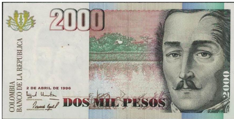
Banco de la República, 2000 pesos, 1996

Por último, en el año de 1996 apareció un billete por valor facial de dos mil pesos (no está respaldado en oro) en el que el general Santander aparece por el anverso al costado derecho, cubriendo buena parte del espacio. El reverso tiene un dibujo de la Casa de Moneda en el que se destaca el portón principal. Salieron varias fechas hasta la última del año 2014. Las primeras fechas se encuentran con asteriscos (reposición). (PPH, 485).