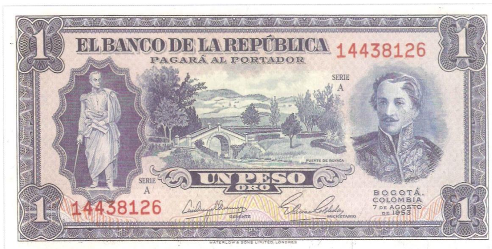
Banco de la República, un peso, 1953

homenaje a la Batalla de Boyacá del 7 de agosto de 1819. Aparece en el centro el Puente de Boyacá y a los costados los dos más importantes próceres de la independencia absoluta: Bolívar y Santander (a la derecha en traje militar). Bogotá, 7 de agosto de 1953. Es un billete conmemorativo. Única fecha. Fue elaborado en Waterlow & Sons Limited de Londres.