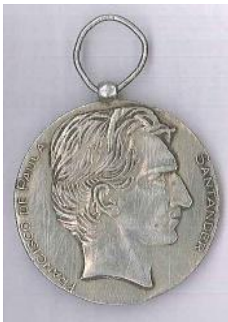
Medalla Cívica Santander, Ley 14 de 1939

Y finalmente queremos reseñar una condecoración otorgada por el gobierno nacional como Ley de la Medalla Cívica Santander a los Servidores Eminentes de la Cultura Nacional. Anverso: la efigie de Santander y alrededor Francisco de Paula Santander. Reverso: República de Colombia. Medalla Cívica Santander. Homenaje a los servidores eminentes de la cultura nacional. Ley 14 de 1939. Metal plata. Tiene argolla.