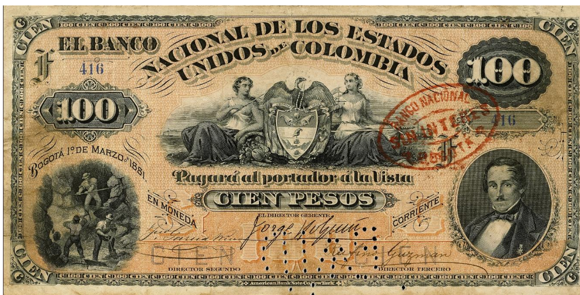
Banco Nacional de los Estados Unidos de Colombia, 100 pesos, 1881

El diseño del billete de 100 pesos es muy elegante. Por el anverso tiene a la derecha el “hombre de las leyes”, en el centro una viñeta del escudo de armas de Colombia y a la izquierda una escena de minería. Bogotá marzo 1 de 1881. Por el reverso lleva la firma del cajero. Este billete es uno de los más raros de la serie. (DP. 401).