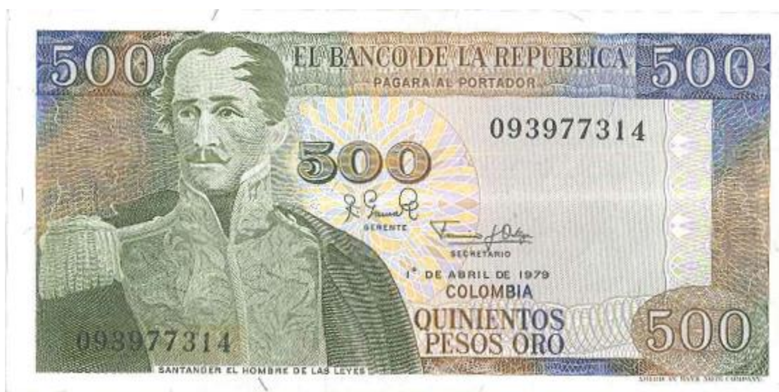
Banco de la República, 500 pesos, 1977/79

En los años de 1977/1979 salió un hermoso billete de quinientos pesos oro en el que la imagen de Santander aparece próximo a la mitad, en traje militar, mirando a la izquierda. El reverso está ilustrado con una imagen del interior de la Catedral de Sal de Zipaquirá. Tuvo dos fechas. Colores múltiples. Tiene marca de agua. (PPH, 386).