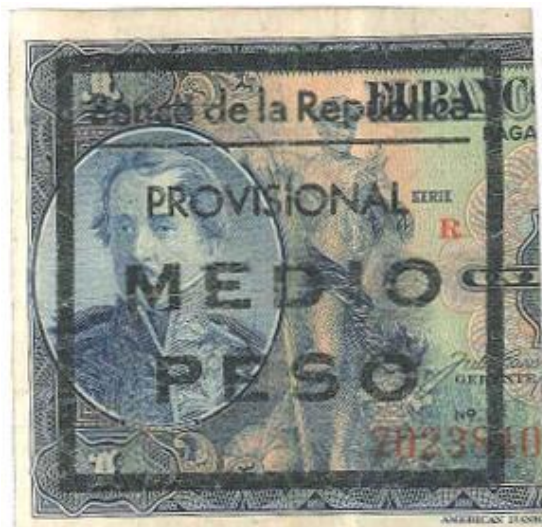
Banco de la República, medio peso, lado izquierdo, 1942

En 1942, debido a la escases de monedas de plata de cincuenta centavos, el Banco de la República tomó billetes de un peso, los partió por la mitad y les puso un resello: Anverso: Banco de la República Provisional medio peso. Reverso: medio peso. Como este billete tiene las efigies de Santander a la izquierda y Bolívar a la derecha, tomamos el medio peso en el que aparece Santander. Igualmente, en el año de 1943, con el billete de un peso de este año se hizo lo mismo. (PPH, 3).