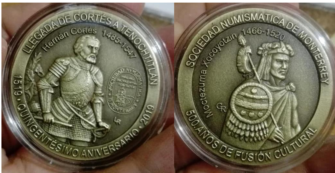
Medalla conmemorativa 500 años de fusión cultural en México, 2019