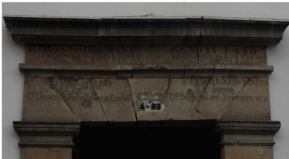
Parte superior del pórtico que da entrada a la Casa de Moneda de Bogotá