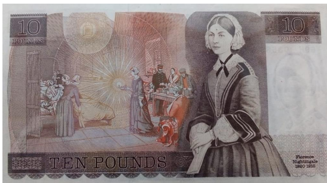
Banco de Inglaterra, 10 libras, 1975

El billete de 10 libras con la imagen de Nightingale entró en circulación el 20 de febrero de 1975 y estuvo hasta el 20 de mayo de 1994.