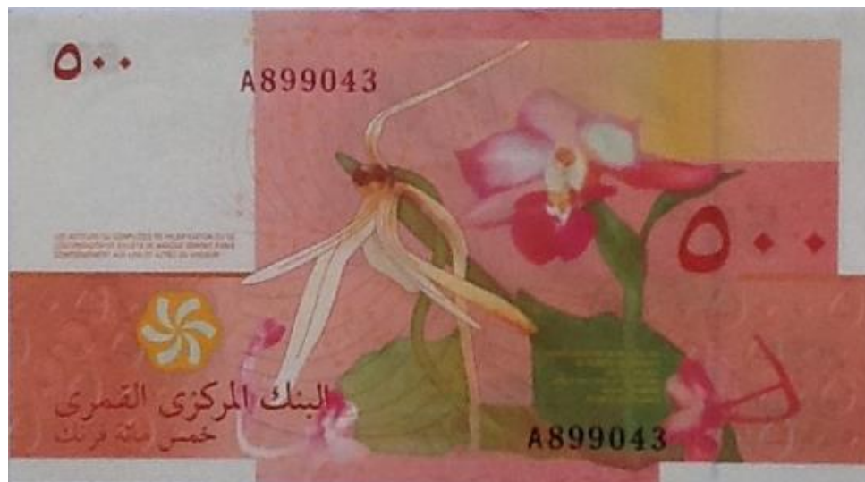
Banco Central de las Comoras, 500 francos, 2006

El Banco Central de las Comoras en el valor de 500 francos, de su emisión de 2006, tiene en el reverso la imagen de una orquídea de la familia Vainilla bourbon , una especie propia de las Islas de las Comoras, la cual es muy distinta de la vainilla proveniente de Madagascar, pues posee vainas anchas y carnosas, con un aroma a flor de naranjo ligeramente especiado.