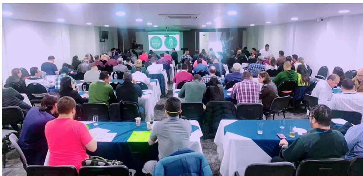
Fotografía de la 9na. Subasta de la Sociedad Numismática de Colombia