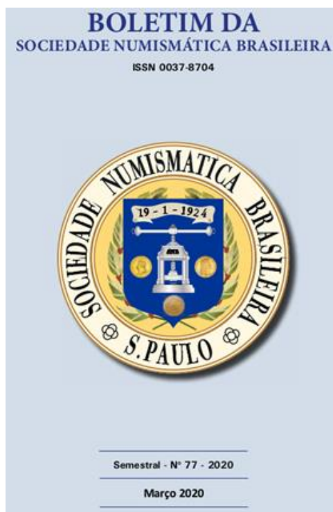
Carátula del Boletín No. 77 de la Sociedad Numismática Brasileira, 2020