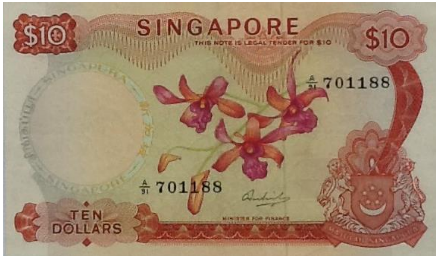
Banco Central de Singapur, 10 dólares, 1967