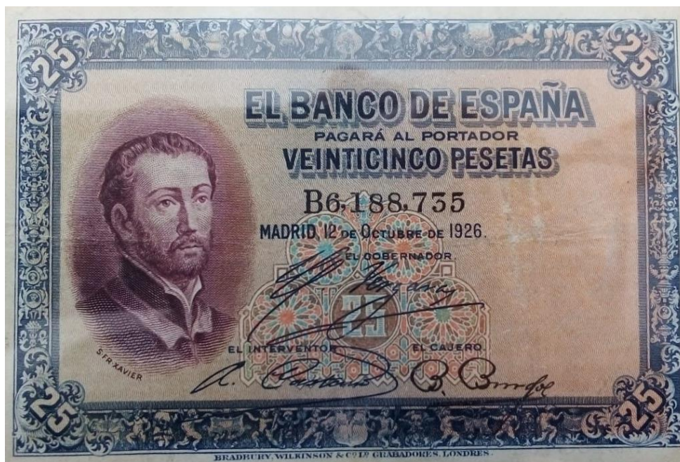
Banco de España, 25 pesetas, 1926