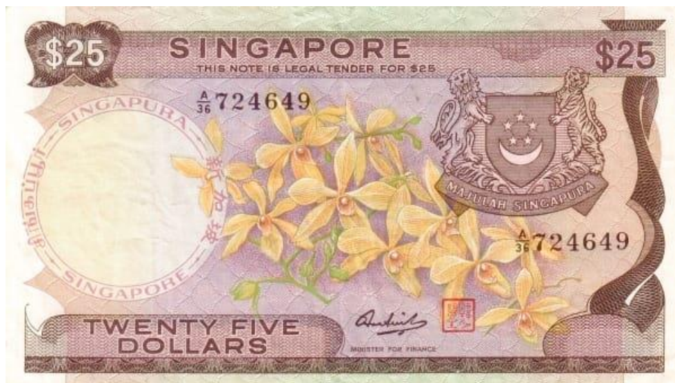
Banco Central de Singapur, 25 dólares, 1972