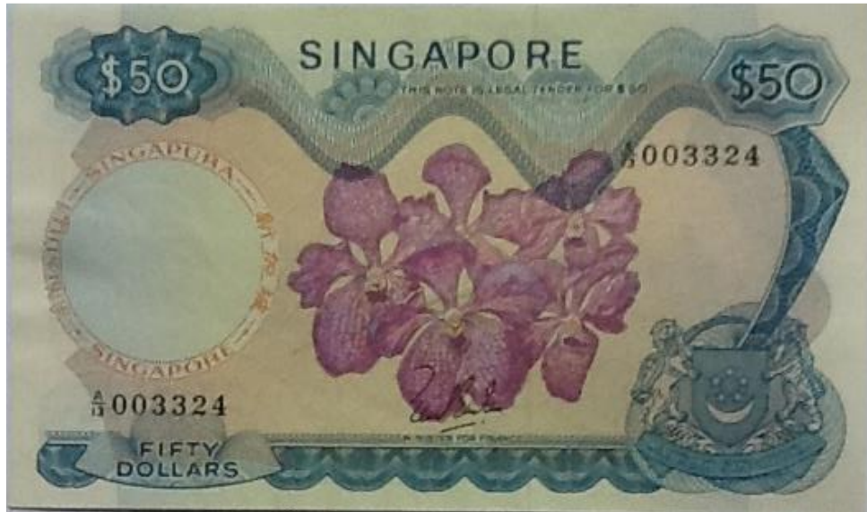
Banco Central de Singapur, 50 dólares, 1967

Por otra parte, en el billete de 50 rupias de Seychelles, emitido en 1998, se exalta en la parte central del anverso, la orquídea Angranthes Paille en Queue , un híbrido intergenérico que resulta de la combinación de Angraecum sesquipedale con Aeranthes arachnites . Las Angraecum sesquipedale , también conocidas como la orquídeas de Darwin, son unas epífitas endémicas de Madagascar, donde crecen a alturas de entre 120 y 150 metros en los árboles cercanos a la costa. Por lo general, se adjuntan a los árboles con menos hojas y a las áreas de la rama o el tronco que están más secas. Esto permite que la planta obtenga una gran cantidad de luz y movimiento del aire. Por su parte, las Aeranthes arachnites son una especie de orquídeas epífitas originarias de las Islas Mascareñas. Aeranthes : Flor en el aire. Arachnites : como araña.