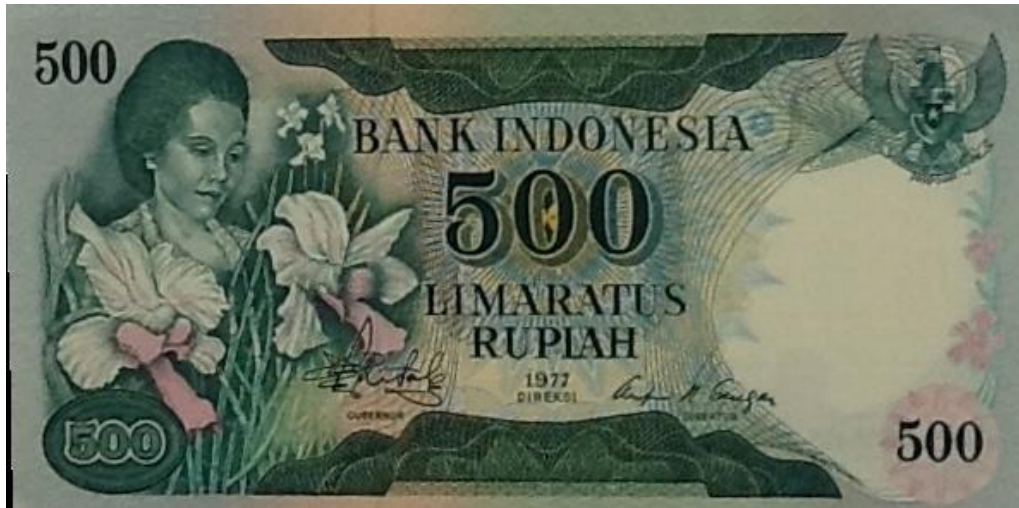
Banco de Indonesia, 500 rupias, 1977

De igual manera, el Banco de Indonesia en su valor de 500 rupias de la serie de 1977, nos muestra en el lado izquierdo del anverso, a una niña sosteniendo unas orquídeas del género Vanda , las mismas que aparecen en sentido vertical al lado derecho. Las orquídeas de esta familia están muy extendidas en el este y sudeste de Asia y Nueva Guinea; incluso, hay algunas especies que alcanzan a llegar hasta Queensland y algunas de las islas del Pacífico occidental.