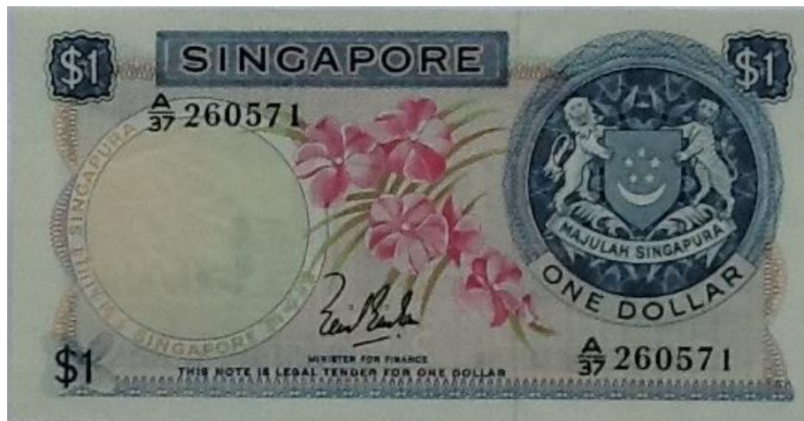
Banco Central de Singapur, 1 dólar, 1967

A continuación les compartimos los valores más bajos de la serie: 1, 5, 10, 25 y 50.