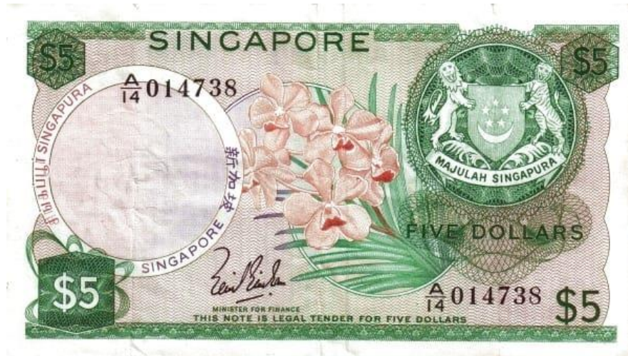
Banco Central de Singapur, 5 dólares, 1967