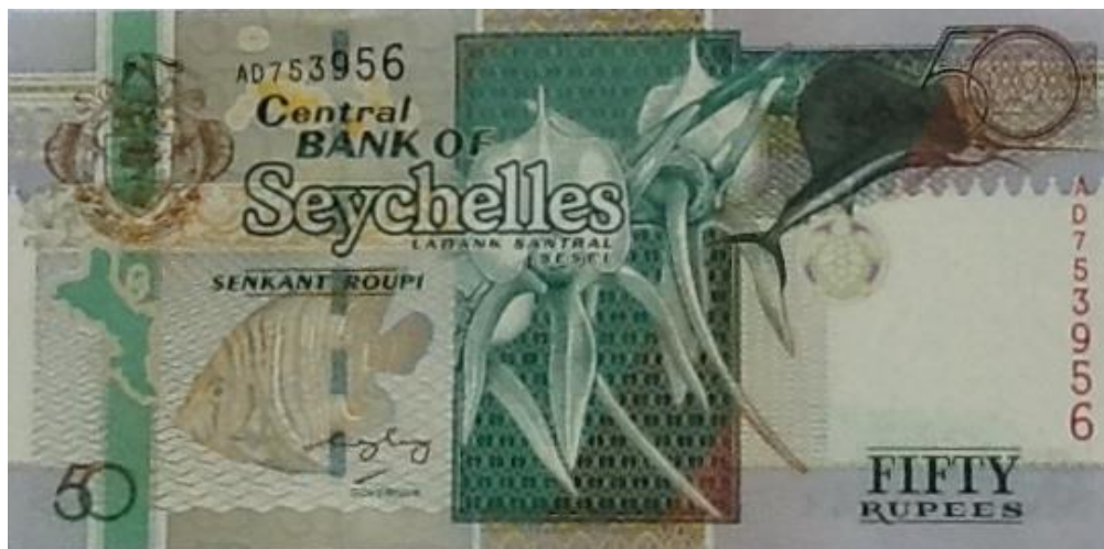
Banco Central de Seychelles, 50 rupias, 1998

Por otra parte, en el billete de 50 rupias de Seychelles, emitido en 1998, se exalta en la parte central del anverso, la orquídea Angranthes Paille en Queue , un híbrido intergenérico que resulta de la combinación de Angraecum sesquipedale con Aeranthes arachnites . Las Angraecum sesquipedale , también conocidas como la orquídeas de Darwin, son unas epífitas endémicas de Madagascar, donde crecen a alturas de entre 120 y 150 metros en los árboles cercanos a la costa. Por lo general, se adjuntan a los árboles con menos hojas y a las áreas de la rama o el tronco que están más secas. Esto permite que la planta obtenga una gran cantidad de luz y movimiento del aire. Por su parte, las Aeranthes arachnites son una especie de orquídeas epífitas originarias de las Islas Mascareñas. Aeranthes : Flor en el aire. Arachnites : como araña.