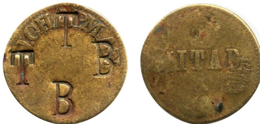
Mitad J. Chapman Resello TT BB (48)

Se conocía ya el resello BJ (o JB, según como se lea) en el anverso, no en el reverso.