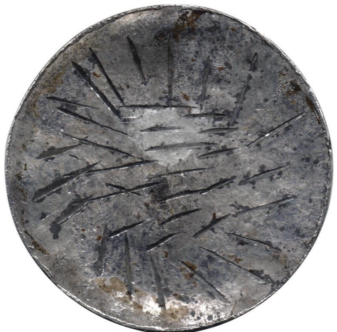
Prueba de anverso 8 reales Santa Fe, Fernando VI, Ca. 1756