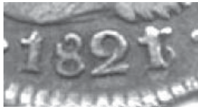
155-7, 1821/3 B A

Esta es una moneda de dos escudos, Fernando VII, acuñada por la casa de moneda de Popayán en la cual un "3" se usó para imitar el "2" de dos escudos. (Tomada del catálogo "Monedas de Colombia").