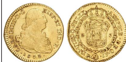
84-30, 1806 Manolo

084-30, 1806. Como la anterior pero sin punto antes de FELIX y con un defecto muy curioso a nivel de la D de IND.