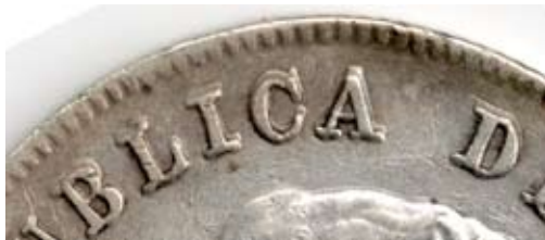
414-5a, 1916 Cincuenta Centavos. REPUBLICA DE remarcada. Presentada por Alexander Montaña

413-2b, 1906. 50 centavos de 1906 con las palabras "Y ORDEN" francamente remarcadas a la derecha. Imagen enviada por Pedro Claver Orozco