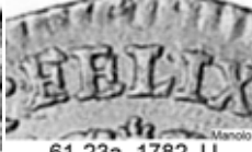
61-23a, 1782 JJ