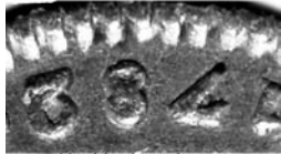
Upside down image