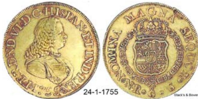
8 Escudos de cordoncillo 1755.