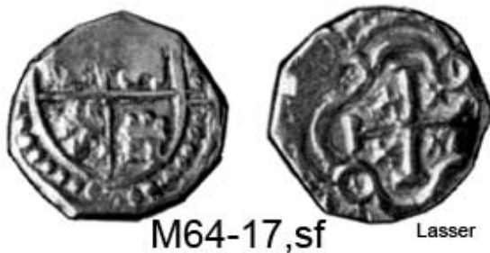
A esta pieza que aparece en los catálogos le modificamos el código y el sitio de publicación

Agradezco mucho a Herman su interés por mantenernos informados. Él sabe que difundimos los avances y hacemos las anotaciones correspondientes en los borradores de los catálogos. También aprovecho para manifestarle emocionadas felicitaciones por los resultados de sus investigaciones.