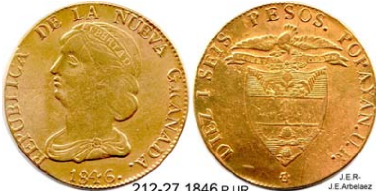
212-27,1846 P UR RAREZA. Ver página 7