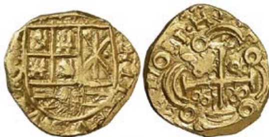
Diseño normal de las piezas de un escudo