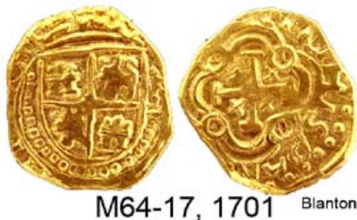
M64-17, 1701 Blanton