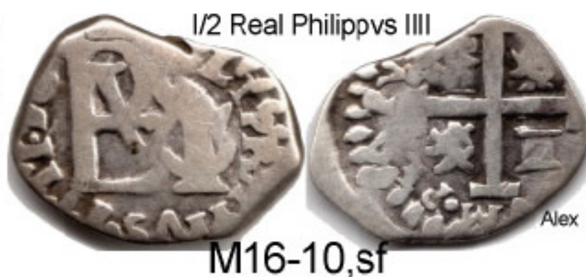
1/2 Real Philippvs IIII