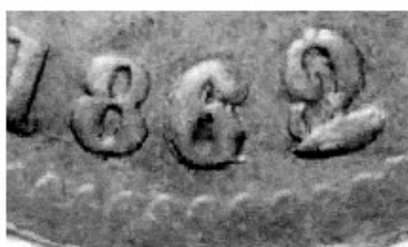
180-1, 1882/48 839

180-1 El diseño más común y la sobrefecha más clara representada por estos dos detalles.: