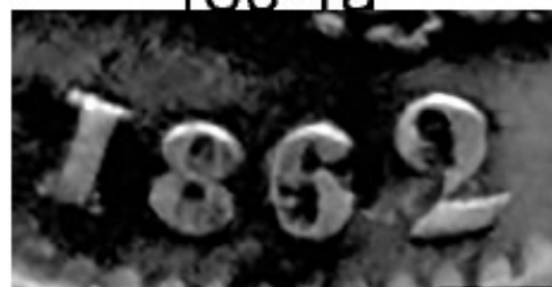
180-3 John FK

180-1a Similar a los anteriores, pero con la sobrefecha embotada por deterioro del troquel.