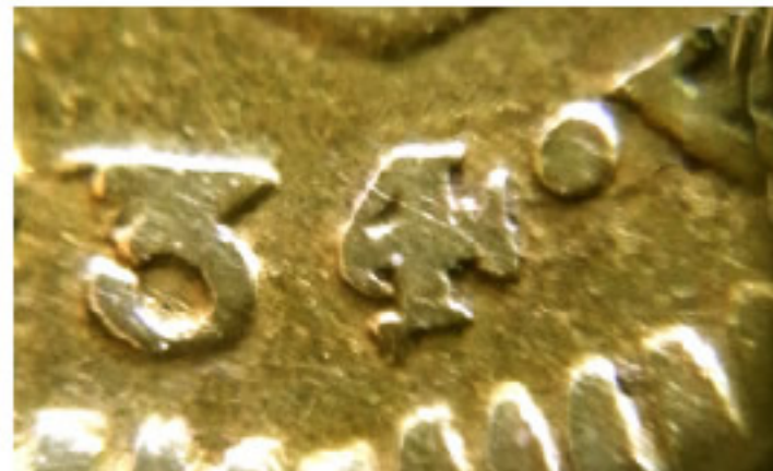
162-31, 1834/? 2005