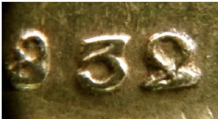
162-25, 1832/1 6251