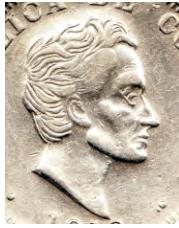
D- Cabello Intermedio N° 2