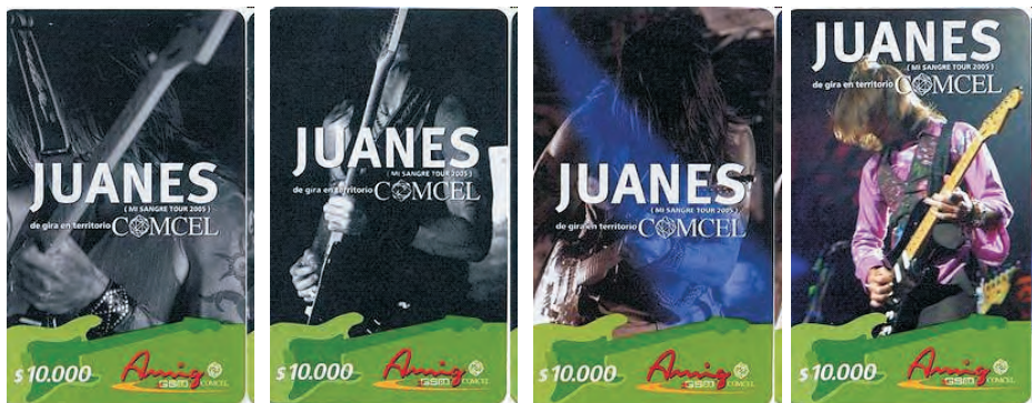
Tarjetas Prepago, Comcel, Colombia