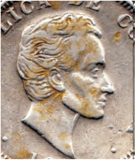
C- Cabello Intermedio N° 1