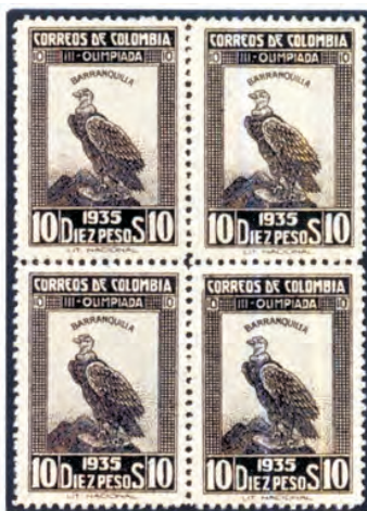
Cóndor Olimpiadas de Barranquilla 1935