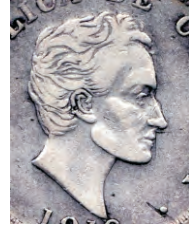
E- Cabello Intermedio N° 3

Cada variedad de cabello presenta diferentes tipos de diseño en las orejas: