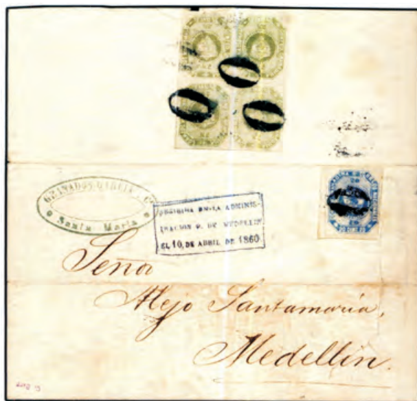
Lote 387, rematado por el precio base 50.000 euros

Los lotes fueron conformados por una sola pieza o por 50. Por ejemplo: el lote 334 con 50 sobres con cancelaciones pre filatélicas del período 1820 a 1850 inició con un precio base de 1.500 euros terminó vendido en 6.000. Lote 337 con 295 sobres con diferentes cancelaciones como Rioseco, Veragua, Quilichao, inició con 2.500 euros y terminó vendido en 14.000. Un sobre dirigido de Santa Marta a Medellín al señor Alejo Santamaría el 23 de marzo de 1860 y recibido el 10 de abril de 1860 porteado con un bloque de 4 estampillas de 2,5 centavos (la primera emitida en la Confederación Granadina, 1859) y otra de 20 centavos de la misma emisión fue subastado en 50.000 euros. Lote 421: Fracción de pliego, 60 estampillas de 100, de la estampilla de Un Peso, el más alto valor de la primera emisión nacional, con base de 15.000 euros, fue rematado en 22.000. Algunos lotes no fueron vendidos y muchos fueron subastados entre los 100 y 1.000 euros, la mayoría por valores muy superiores a los de las bases.