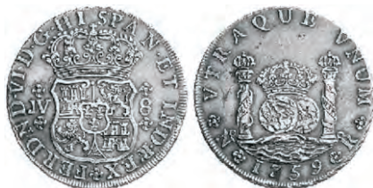
8 reales – 1759 – Tipo Restrepo 10

Es decir que a partir de la fecha y hasta el 31 de marzo de 2010 pueden votar vía email: andresyp@une.net.co o en la encuesta publicada en el blog: http://lepraynumismatica.blogspot.com/ entre las siguientes tres monedas para escoger la mejor moneda de Colombia de todos los tiempos: