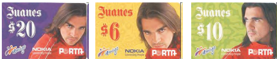
Tarjetas Prepago, Porta, Ecuador

Juanes, cuya historia comenzó con el metal y termino en una fusión, ha llevado el color local al rock mundial y ha logrado colocar en la música del continente el interés por los asuntos urgentes, las minas antipersona y las injusticias sociales.