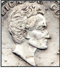
A- Cabello fino.