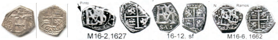
Medios reales acuñados en Santa Fe y clasificados en el catálogo de Monedas de Colombia y otro

La atribución a esta Ceca no es caprichosa. Por el contrario, se basa en tres premisas o mejor características que esta macuquina comparte con los especímenes conocidos de Cartagena, ya descritos e ilustrados más arriba y que son fáciles de cotejar: 1) Monograma con las letras delgadas y la P y la S ligeramente separadas. Aunque por efecto de la corrosión que la moneda presenta parezca en la foto que las letras están pegadas. Nótese además que los trazos de las letras conservan su independencia. Si se revisan los medios reales conocidos acuñados en Santa Fe, se establece que presentan las letras del monograma siempre más gruesas; 2) Castillos con la puerta sin base, abierta en la parte inferior. Esta característica es muy peculiar y bien diferenciadora, pues los medios reales que se conocen acuñados en Santa Fe durante el reinado de Felipe III, presentan siempre una base recta que cierra la puerta en la parte inferior. Más abajo se reproducen las fotos de cuatro medios reales de Santa Fe a manera de ejemplo, y 3) El acuartelamiento siempre es correcto: Castillo y León. Recuérdese que esa es una característica de las macuquinas de Cartagena, mientras que en los medios reales y demás monedas acuñados en Santa Fe es muy usual que exista mal acuartelamiento.