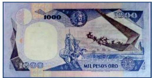
Mil pesos oro.

3 emisiones impresas por Imprenta de Billetes Santa Fe de Bogotá: 31 de enero de 1992, 1º de abril de 1992 y 4 de enero de 1993. Similares características a la emisión anterior. En las tres emisiones hubo reposición, estrella. En abril de 1992 existen