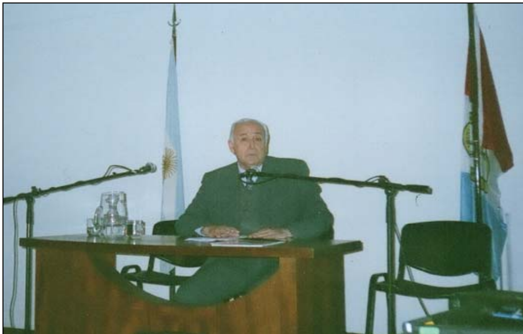
Conferencia dictada en la ciudad de Rosario el 28 mayo 2011, en el Museo Marc-Rosario

Promotor de la Unión Americana de Numismática (UNAN)