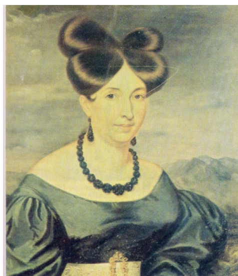
Doña Paula Jaraquemada Alquizar

En cuanto tuvo noticia de la batalla de Cancha Rayada, ocurrida el 19 de marzo de 1818, organizó a los peones de su hacienda de Paine (Maipo) y los envió bajo el mando de su propio hijo para que se pusieran al servicio del general José de San Martín, al que también proporcionó caballos, alimentos y pertrechos. Transformó su hacienda en un hospital para los soldados heridos en el combate, y el general San Martín instaló allí el cuartel general de los patriotas en retirada. Doña Paula, es sin duda la figura femenina relevante en la Guerra de la Independencia.