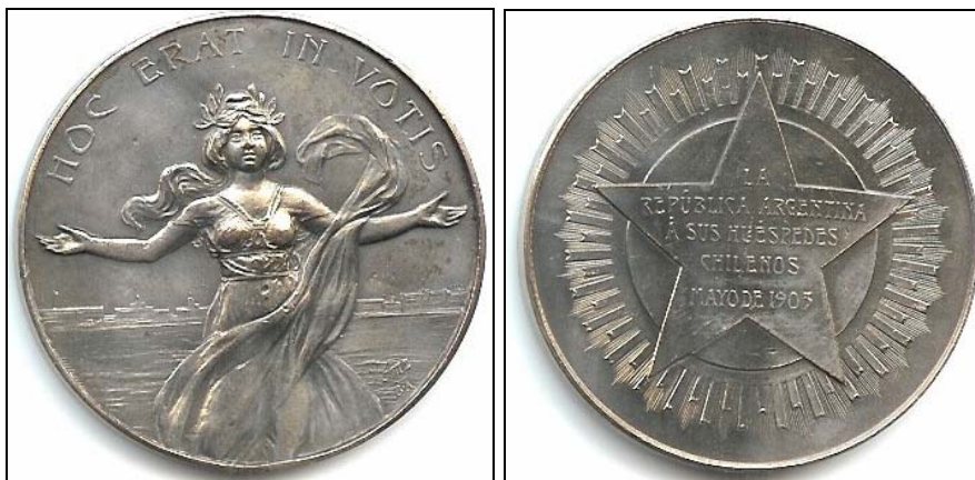
Medalla plateada de 55 gramos.

“La República Argentina a sus Huéspedes Chilenos. Mayo 1905”