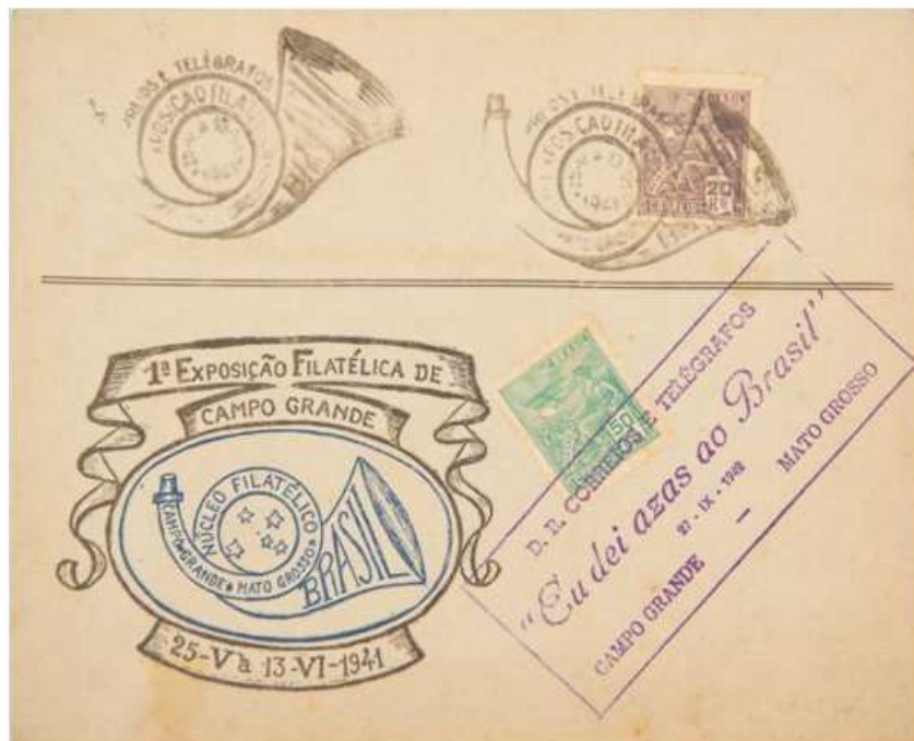
Sobre de la 1ª Exposición filatélica de Campo Grande – 1941, con el símbolo del instrumento musical de correos. Con el timbre: "Eu dei azas ao Brasil" – Campaña para la preparación durante la II Guerra Mundial - 27/IX/1942.

En la antigüedad, los carteros eran comúnmente conocidos como «correos» o «emisarios». Eran personas que recorrían grandes distancias a caballo transportando mensajes en forma de cartas . Actualmente, los carteros usan otros medios de transporte como la moto o la bicicleta .