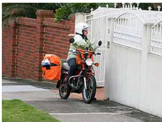
Cartero repartiendo entregas en motocicleta.