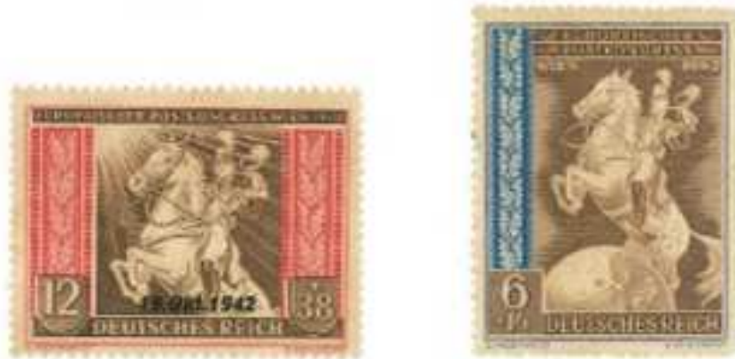
Sellos alemanes con la imagen del mensajero.

Por otro lado, nos llama la atención el instrumento de viento, que toca el mensajero, que es un Clarín , que con su agudo sonido llamaba a los vecinos al camino Real, a recibir su correspondencia.